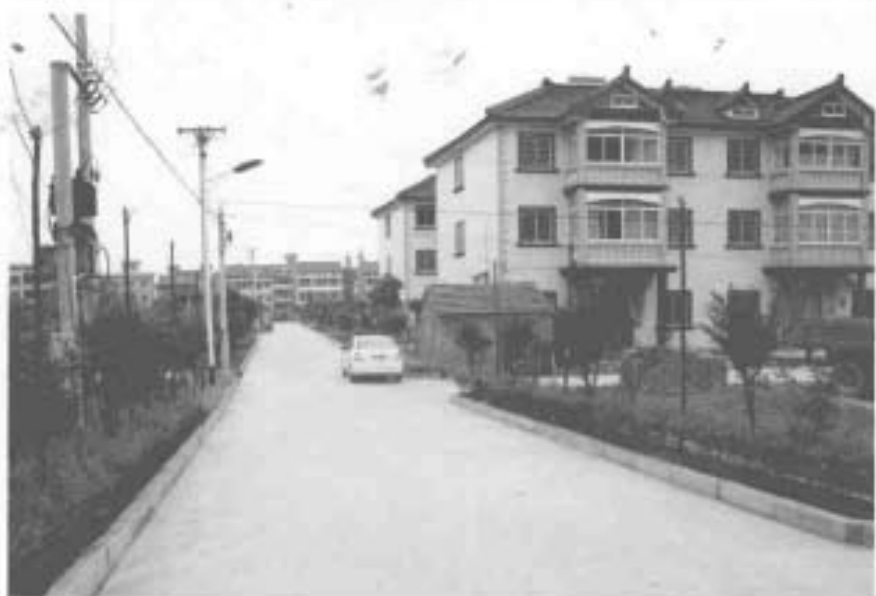
浇筑水泥以后的村道