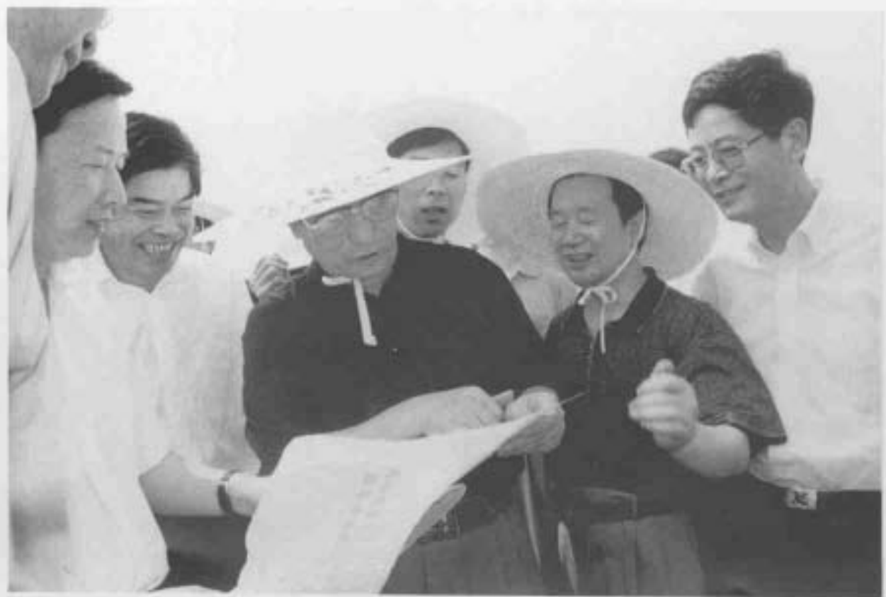
2000年8月1日,省委副书记、省长柴松岳到村属企业所建的标准塘工程工地视察