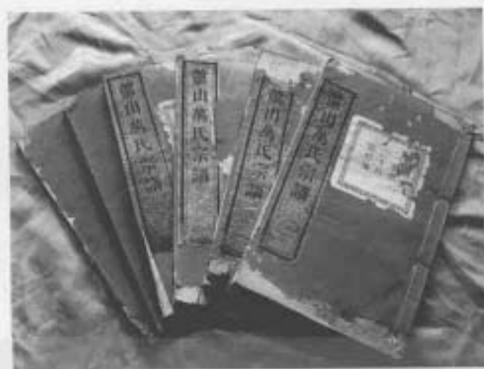
修编于清光绪二十五年(1899)的万氏宗谱