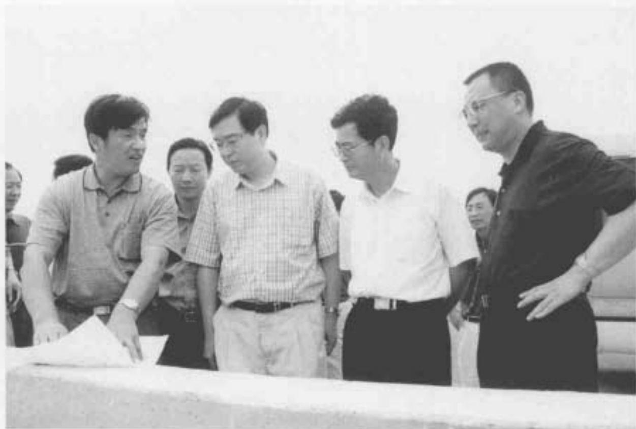
2001年9月11日,省委书记张德江视察村属企业所建的标准塘工程工地