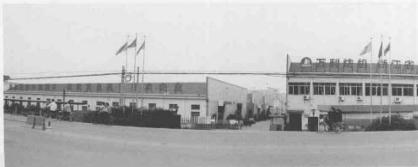
浙江万利纺织机械有限公司