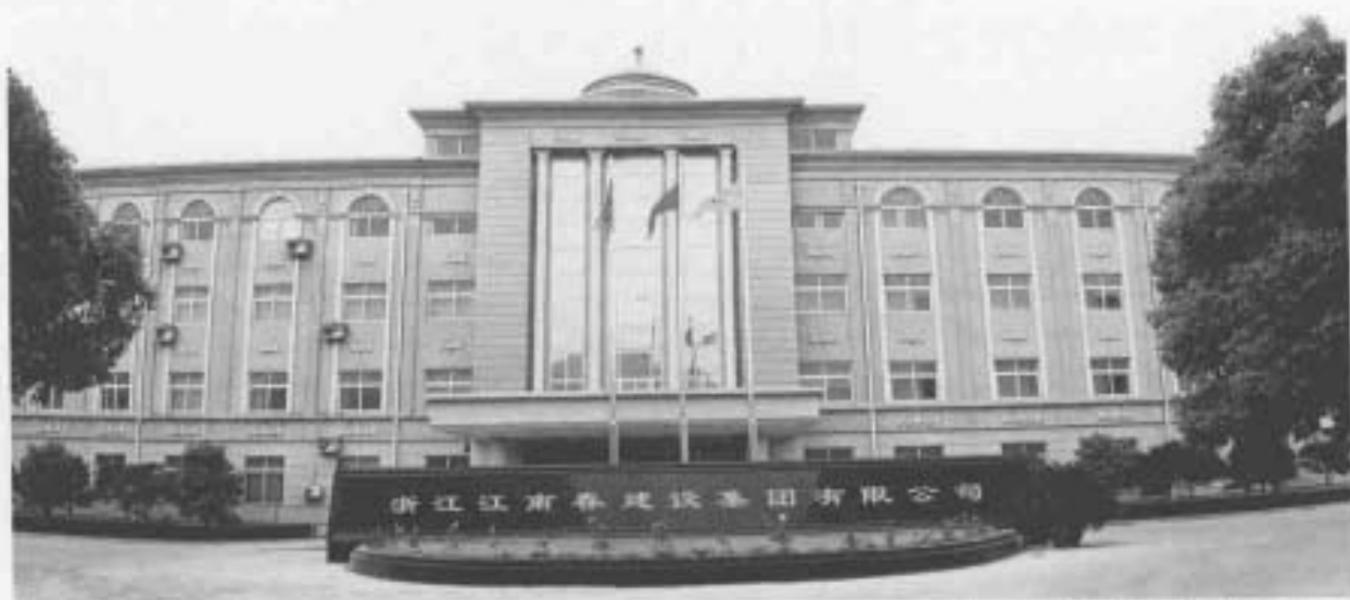
浙江江南春建设集团有限公司