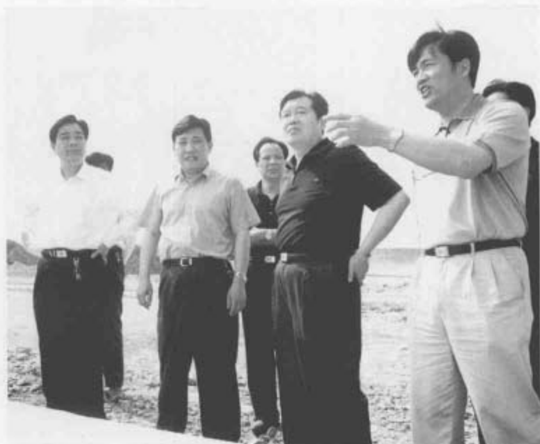
杭州市委副书记、萧山区委书记王建满到村企业所建的标准塘工程工地调研