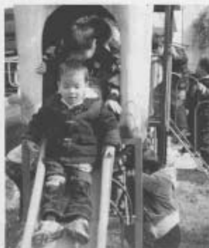
幼儿园室外活动(三)