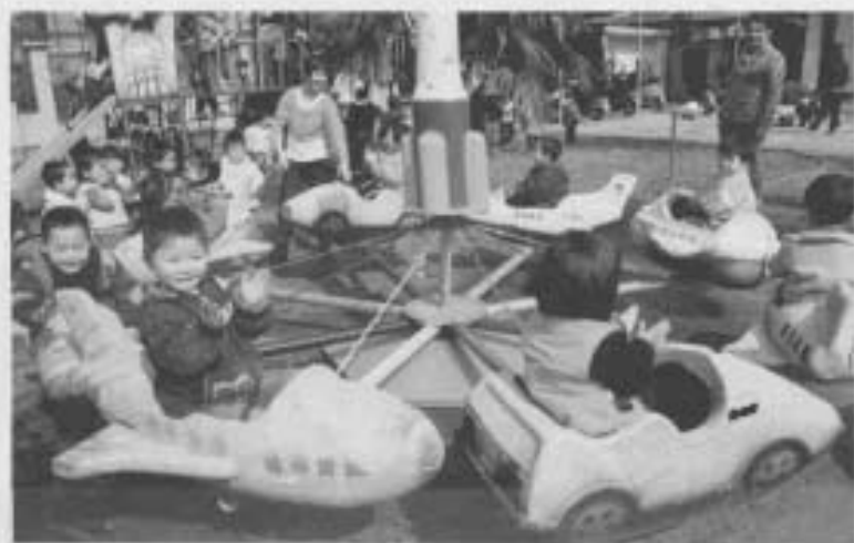
幼儿园室外活动(二)