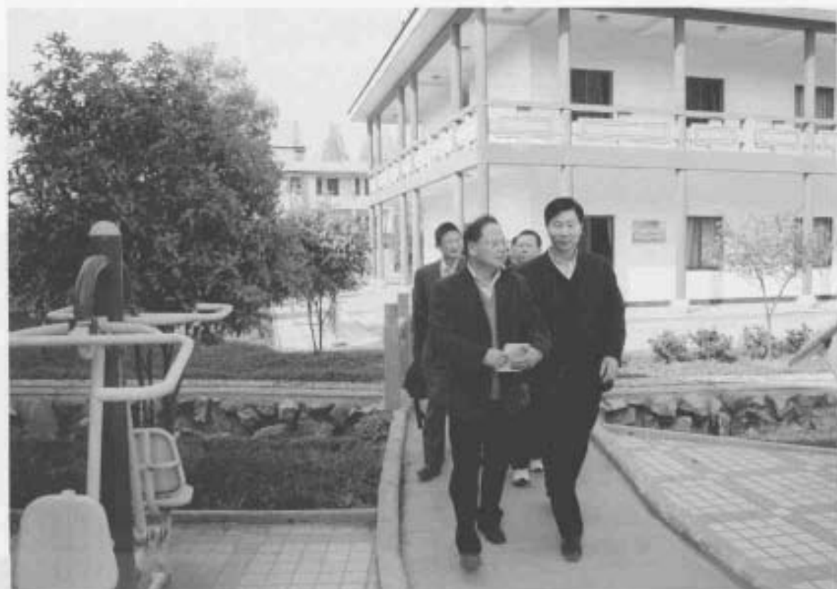
2007年4月4日,省民政厅副厅长黄永正到村文化中心调研