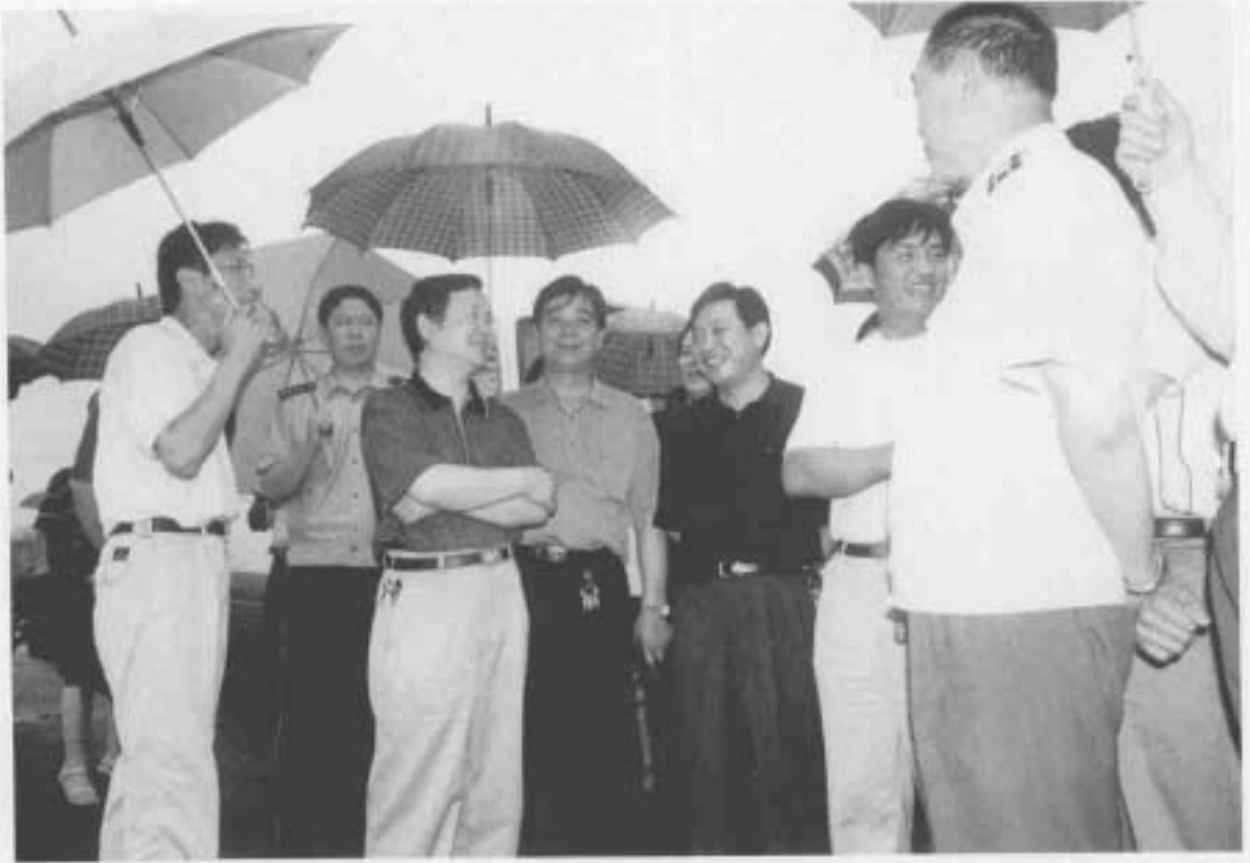
副省长章猛进视察村属企业所建的标准塘工程工地