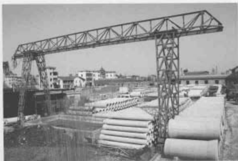
“青峰”牌钢筋混凝土排水管