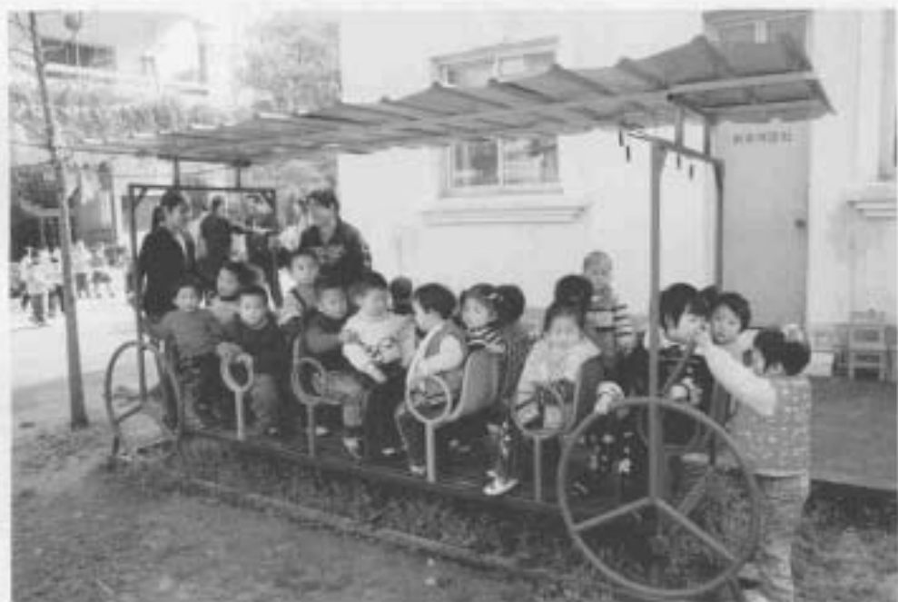
幼儿园室外活动(一)