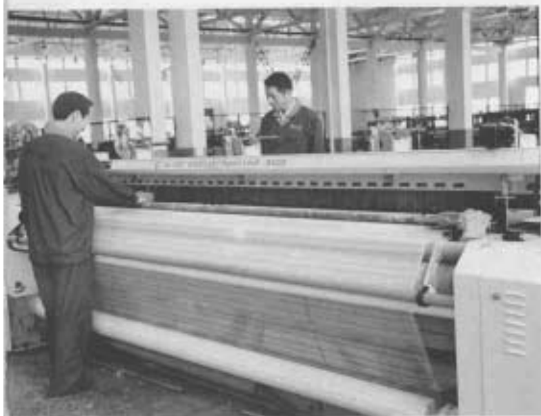
“万利”牌 WL450 剑杆织机