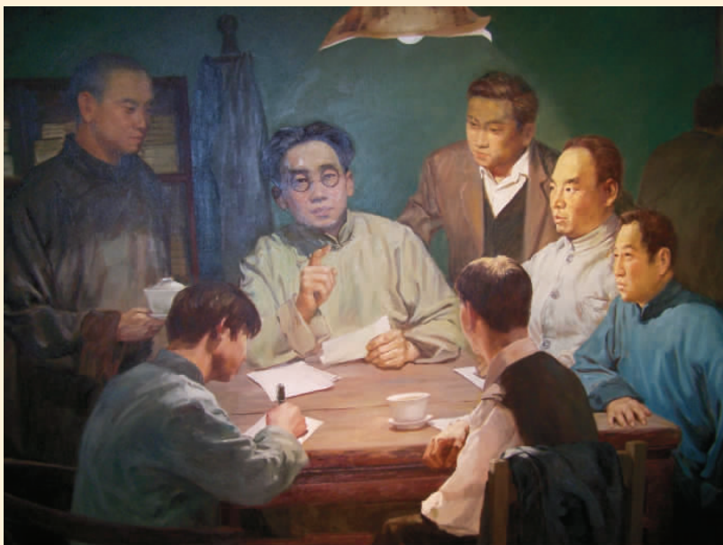
高君宇创建山西第一个党组织