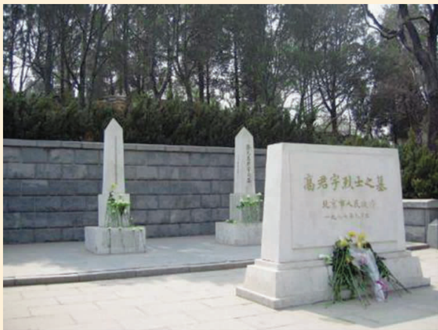
北京陶然亭高君宇烈士之墓