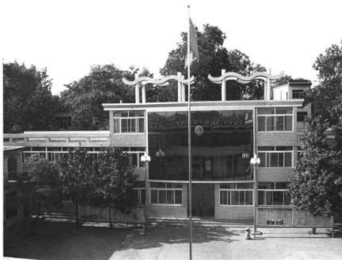
告成镇机关办公楼