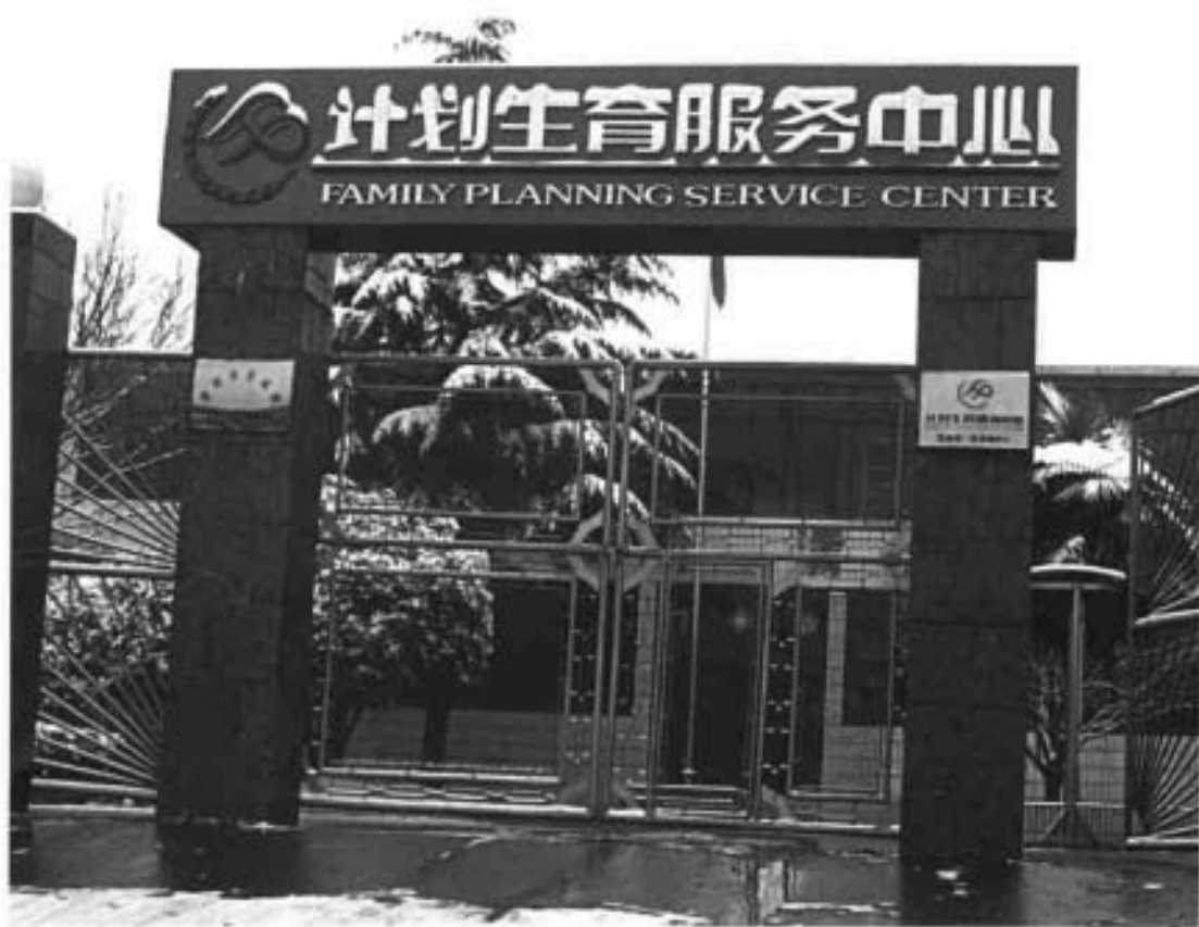
告成镇计划生育服务中心