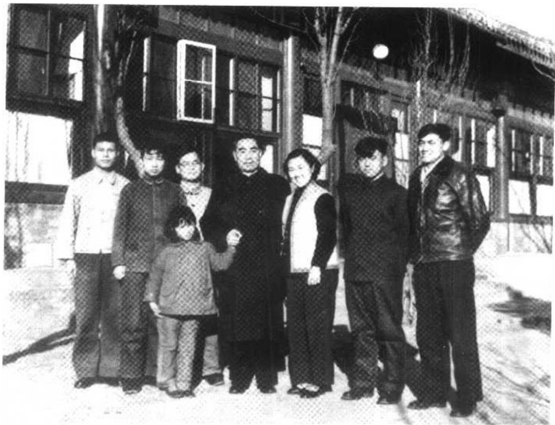
▲ 1961年春节，西花厅。左起：龙桂辉、周秉钧、周尔辉、周恩来、周秉德、周尔萃、周保章。