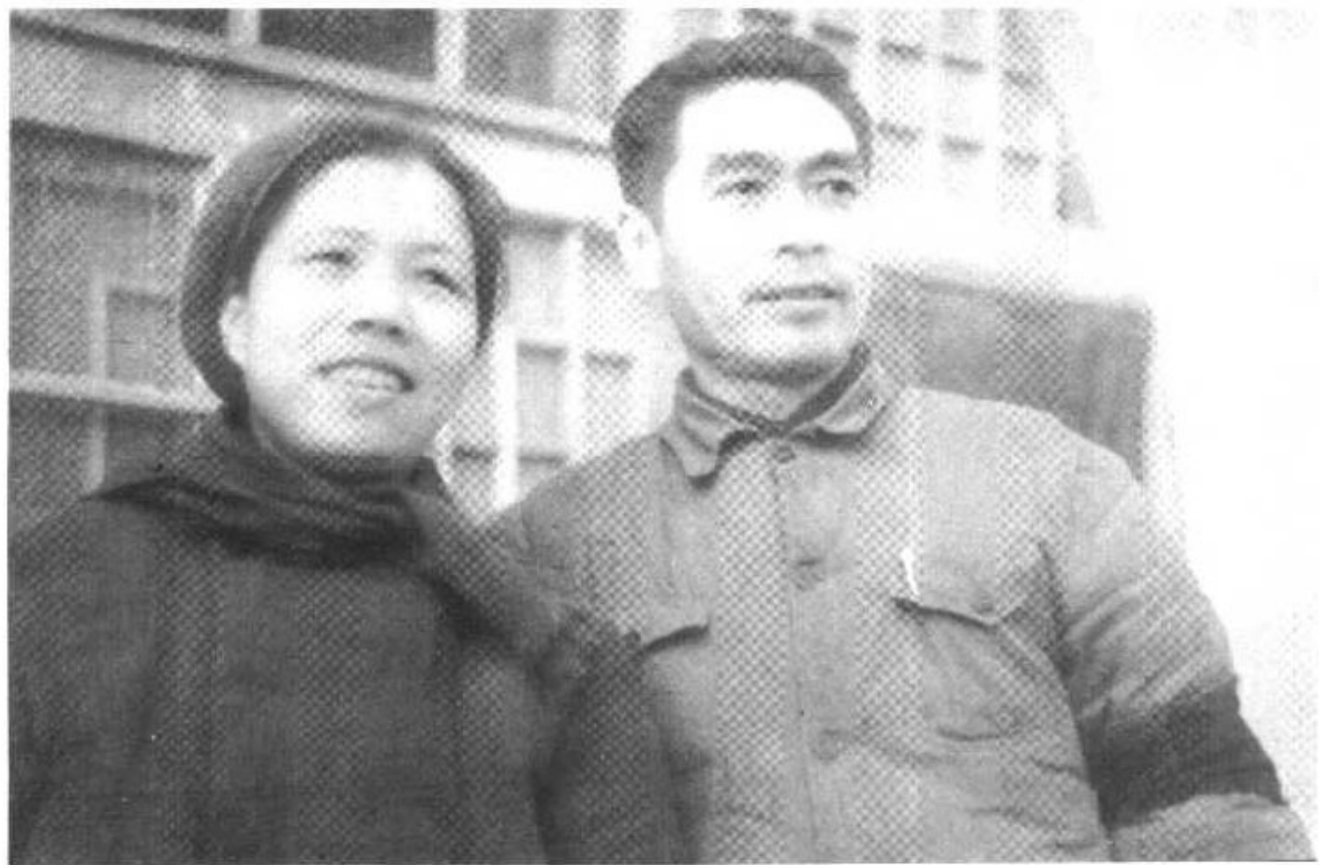
▲ 周恩来、邓颖超 1942 年在延安，臂上为父戴孝。