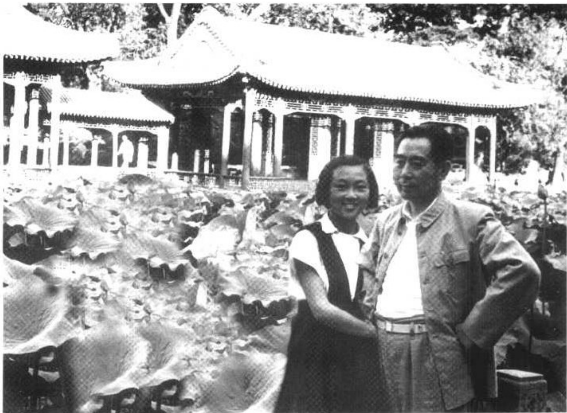
▲ 周恩来同侄女周秉德， 1951年夏在颐和园谐趣园。