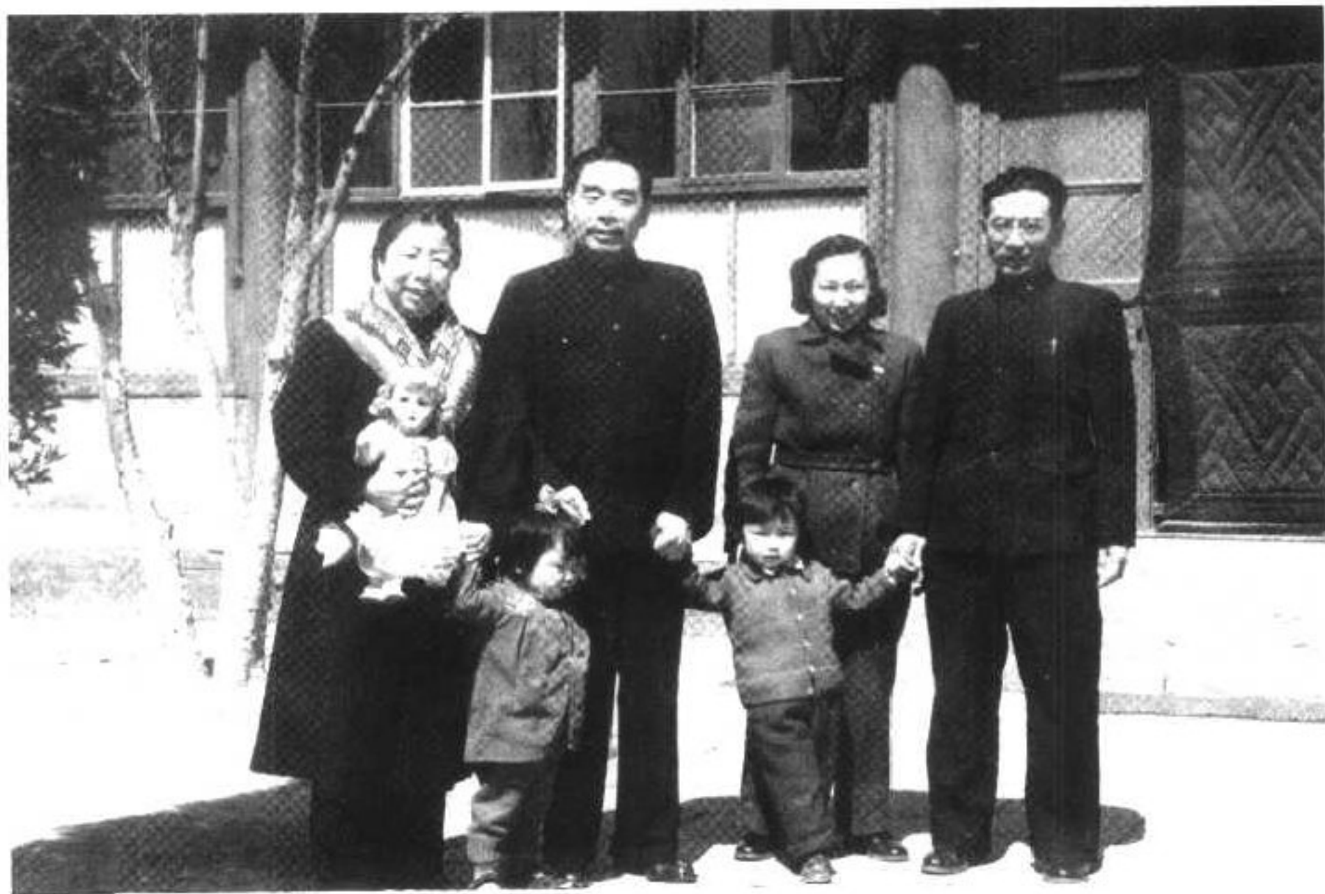
▲ 1955年4月，周恩来、邓颖超与三弟周同宇、弟妹王士琴及他们的子女秉和、秉建在西花厅。