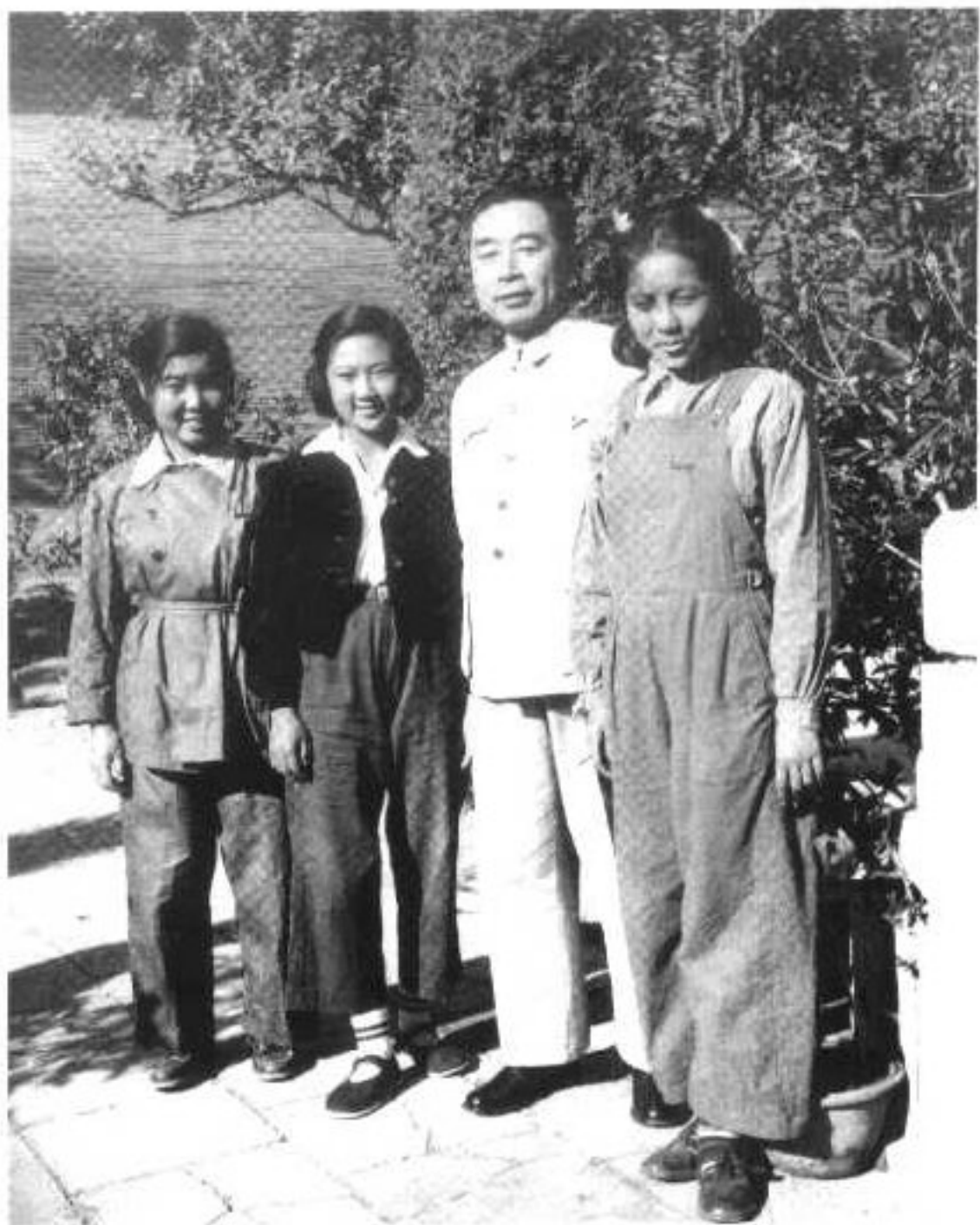
► 1950年春，中南海。 左起：孙新世、周 秉德、周恩来、叶剑眉。