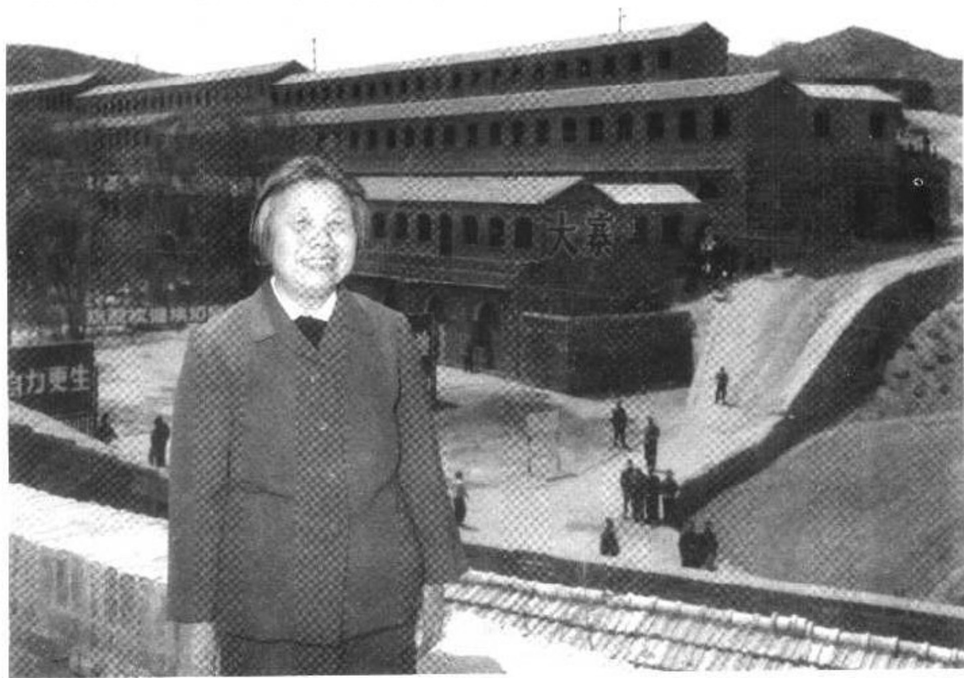
▼ 邓颖超1973年4月23日在大寨。