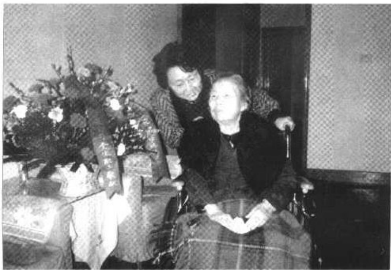
◀ 1992年3月7日周秉德去北京医院病房看望伯母邓颖超。