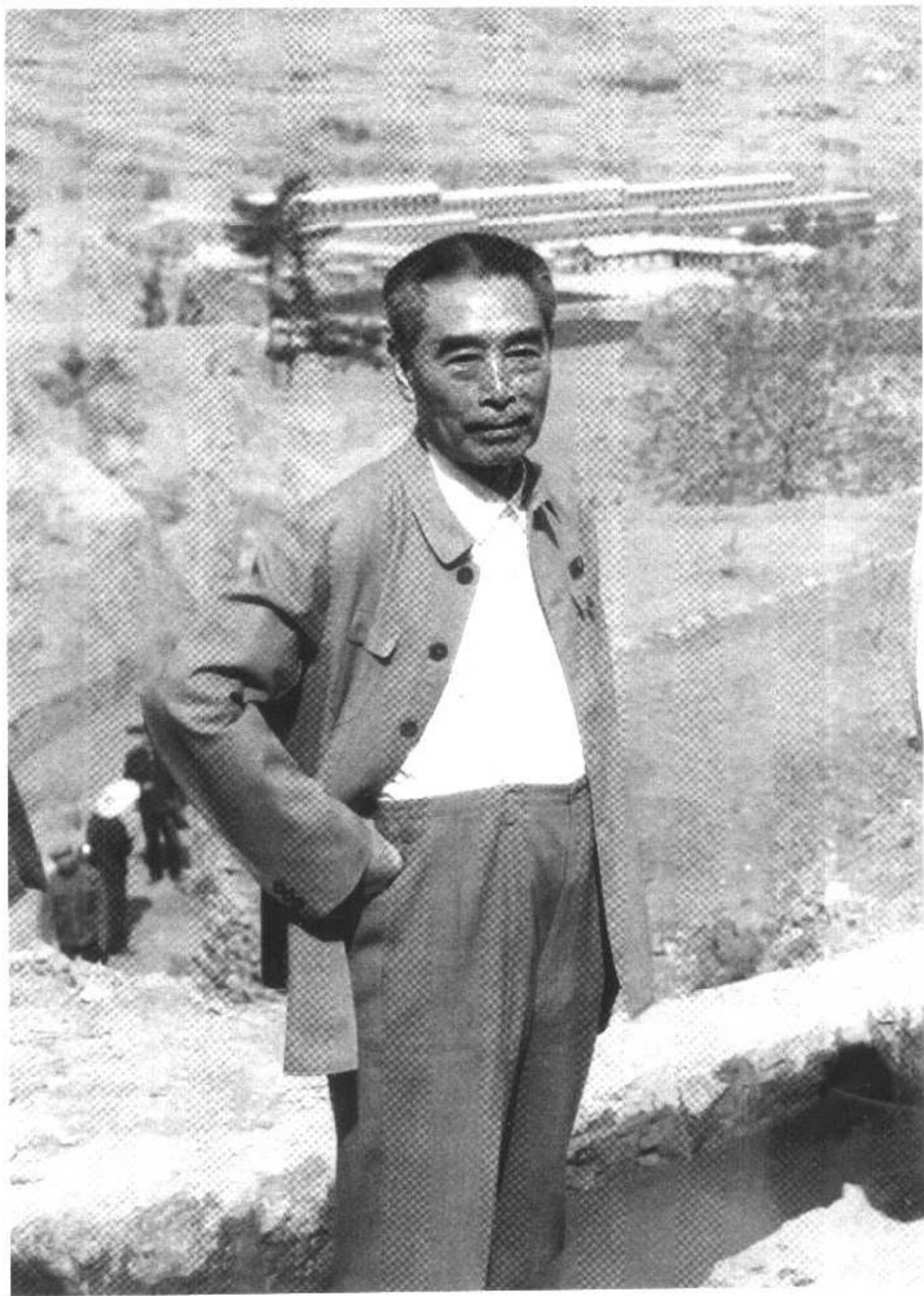
我的伯父周恩来（1973年4月23日在大寨）。