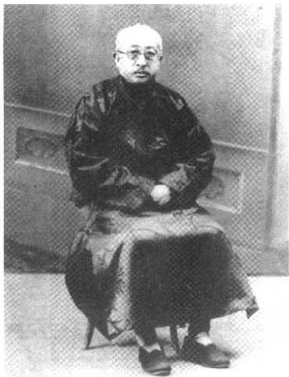
◀ 周恩来四伯父周曼青（贻 赓）1930年冬。