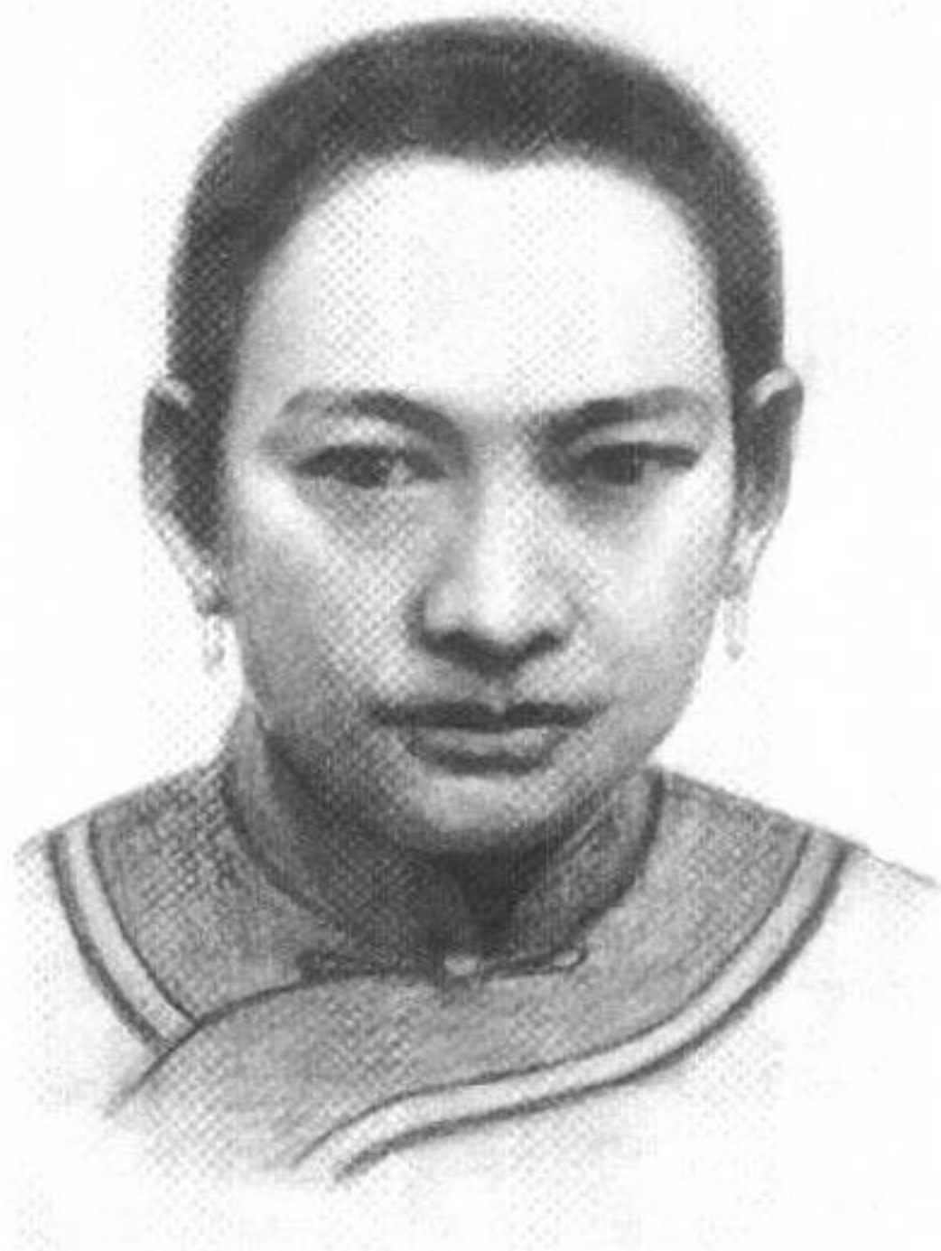
▶ 周恩来母亲万冬儿（十二姑）画像。