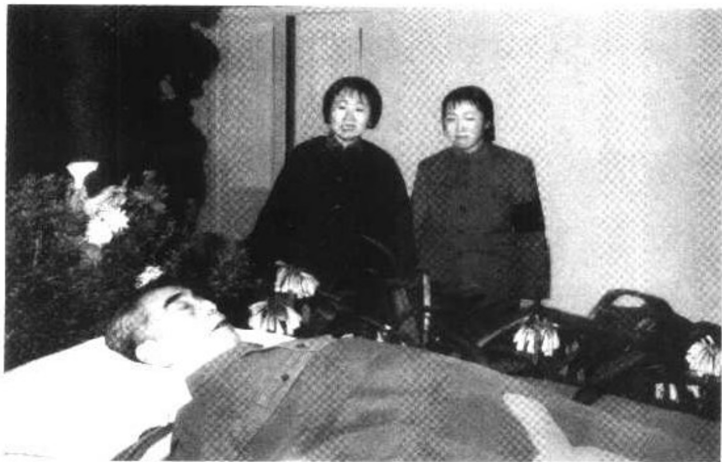
◀ 1976年1月10日，周秉德、周秉建向伯伯周恩来遗体告别。