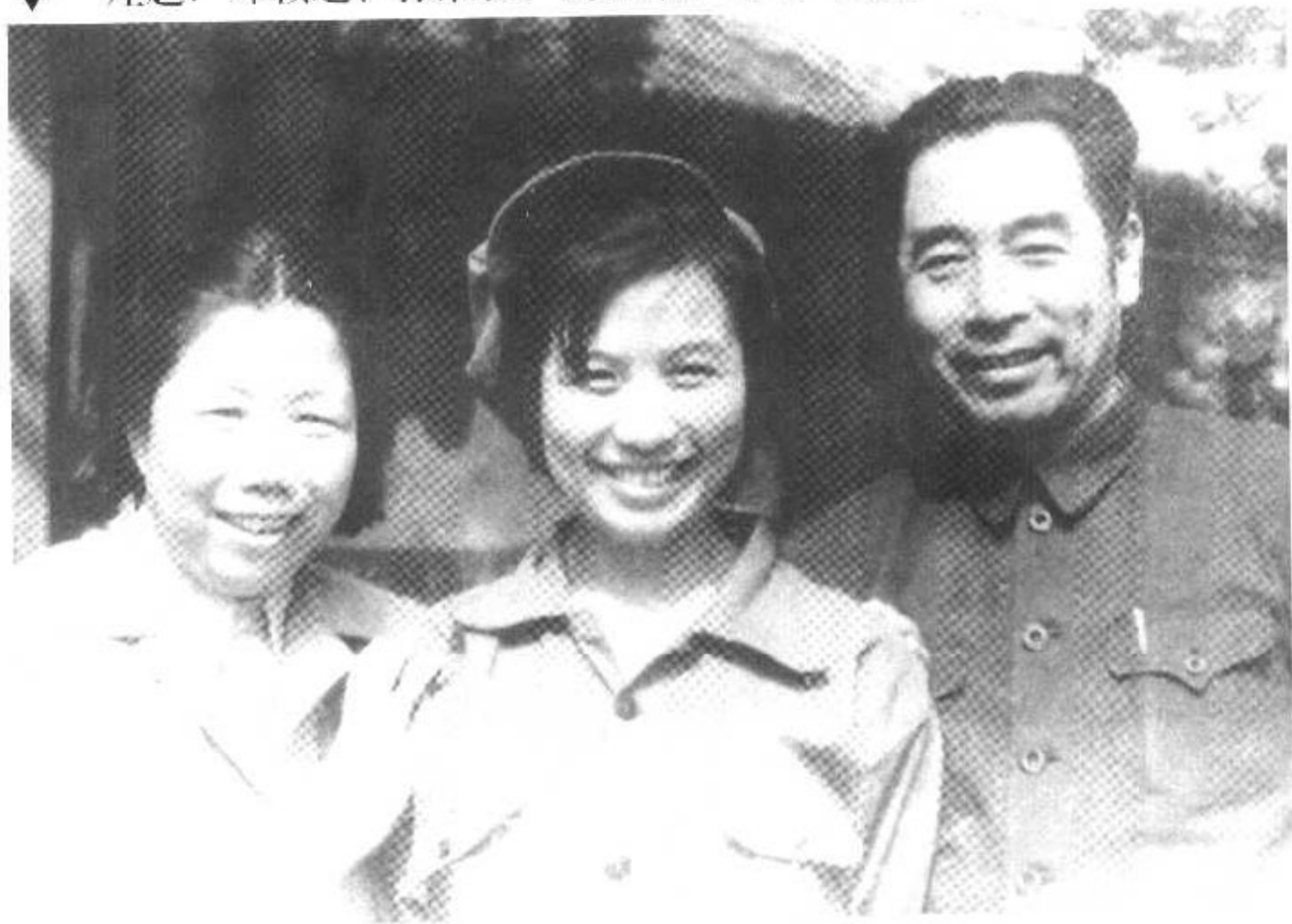
▼ 左起：邓颖超、孙维世、周恩来，1949年夏。