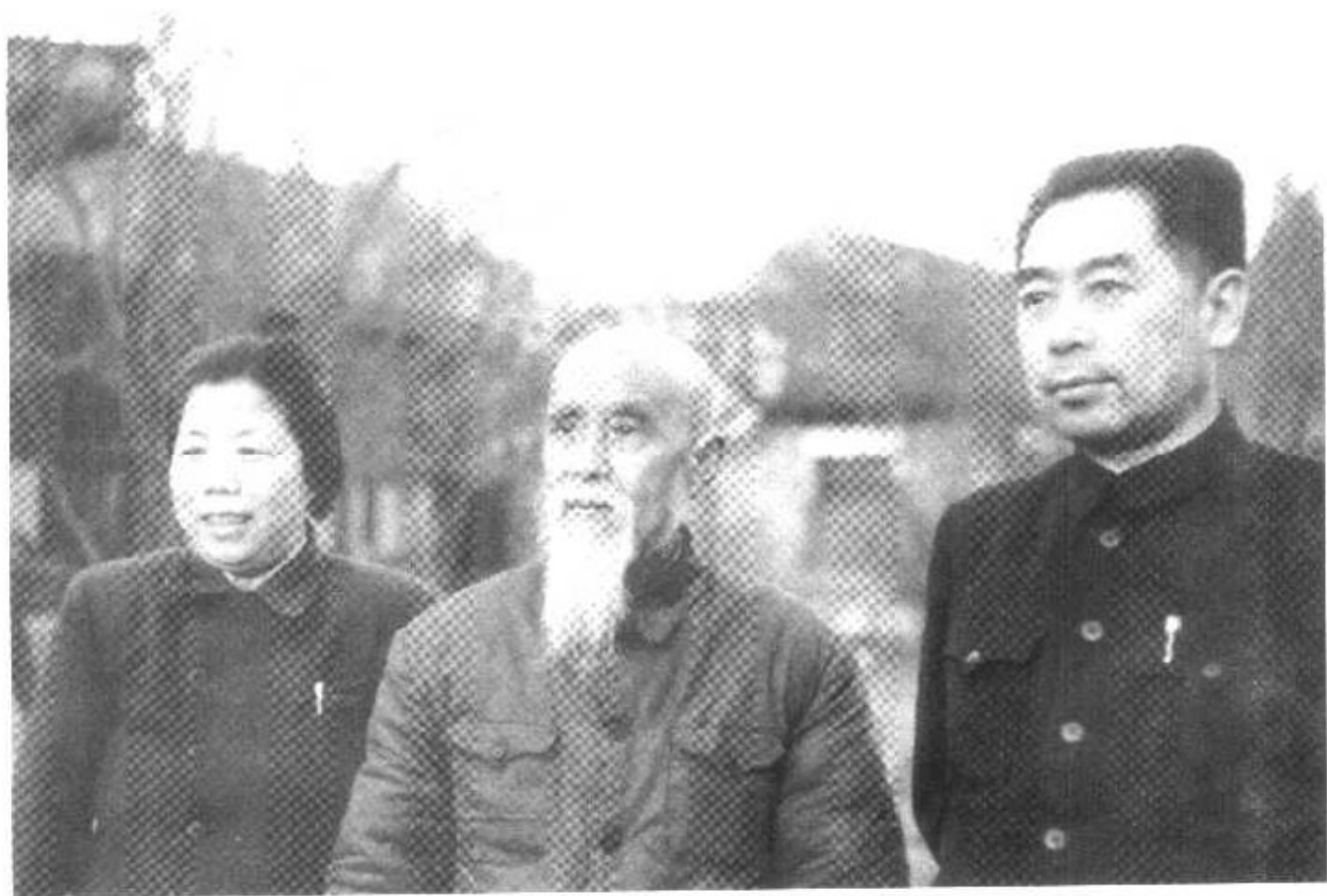
▲ 周恩来、邓颖超与六伯父周松尧（贻定）1950年冬于西花厅。