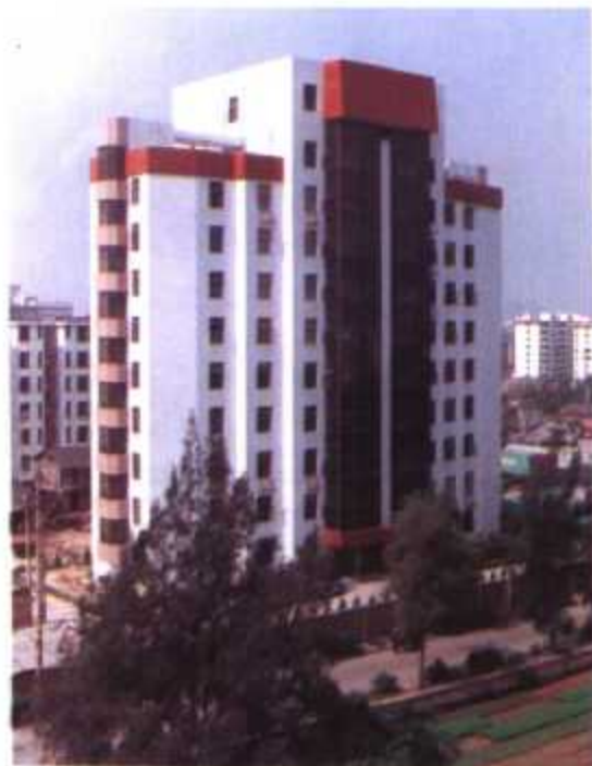
▼ 福建省计划生育非人灵长类实验中心