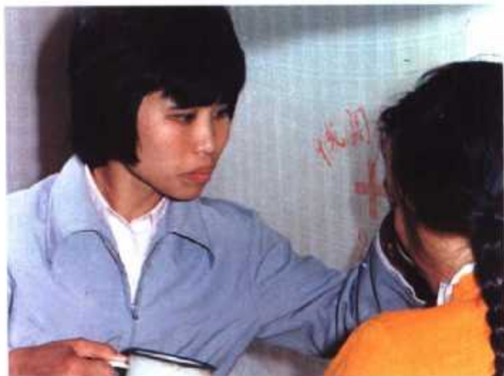
▲ 计划生育专职干部为落实避孕措施的育龄妇女服务