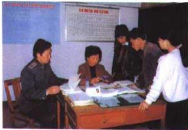
▲ 福州市台江农贸市场经营者持婚育证明书在市场计生办签订计划生育公证、计划生育协议书