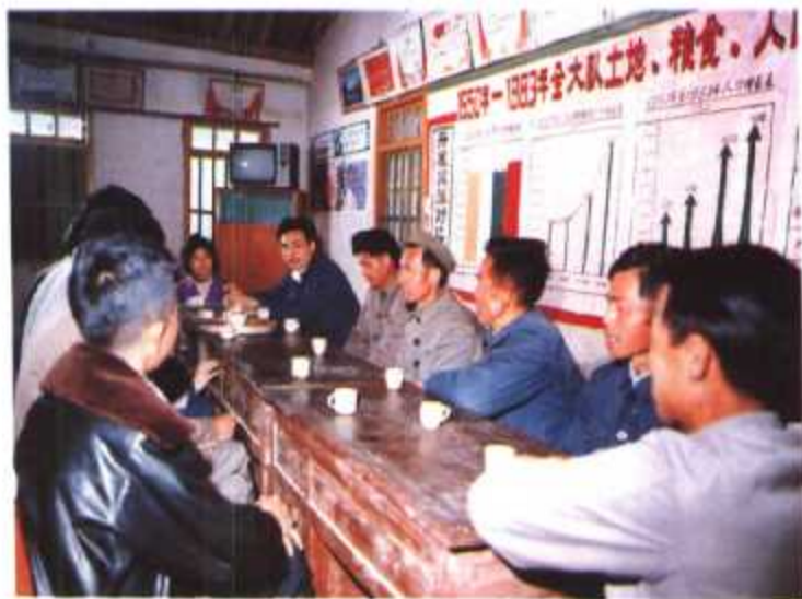
◀ 基层干部通过算帐对比， 提高实行计划生育的自觉性