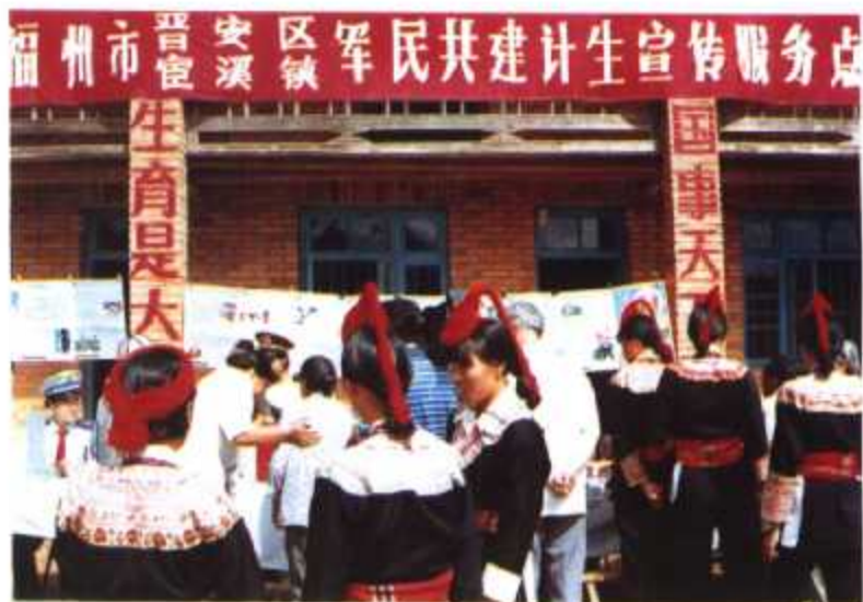
▶ 福州市晋安区宦溪镇 军民共建计生宣传服务点