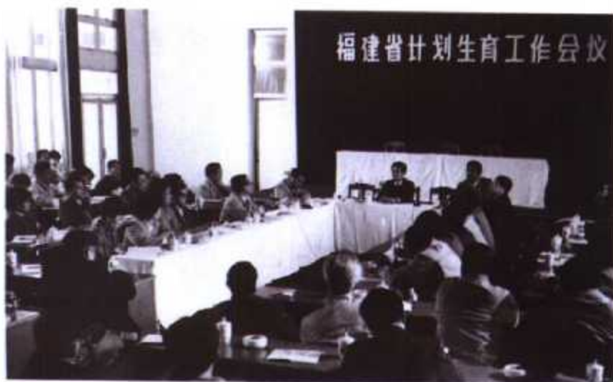
▶ 1990年,福建省省长王兆国(中)在全省计划生育工作会议上讲话