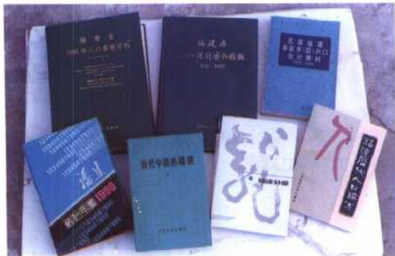
▲ 福建省已出版的人口专著