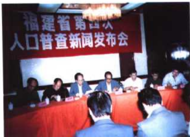
► 福建省第四次人口普查新闻发布会