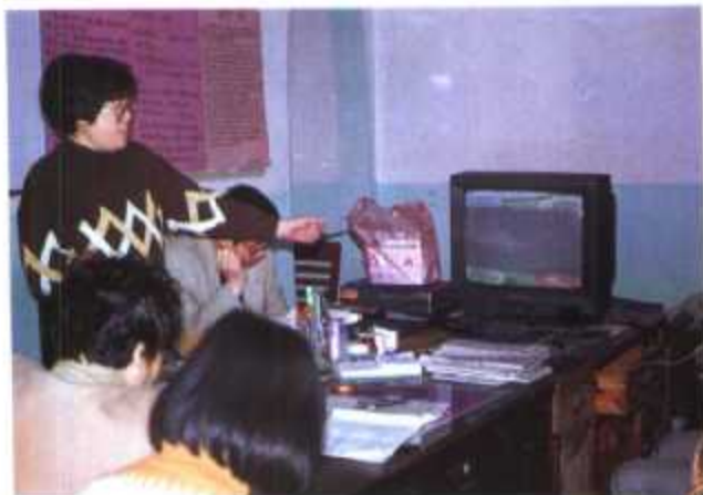
◀ 育龄妇女在上避孕节育知识课