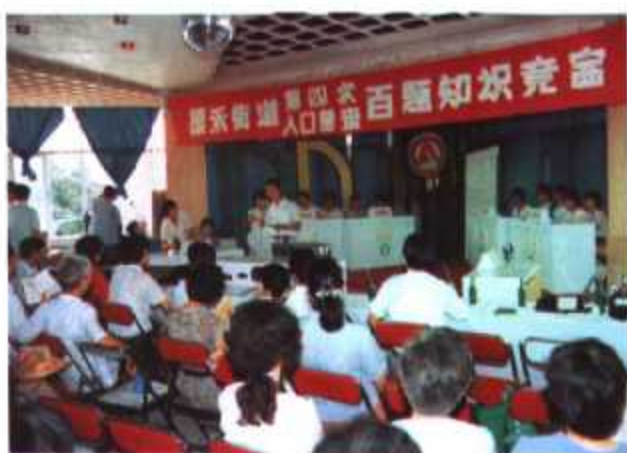
▲ 厦门市开元区厦禾街道第四次人口普查百题知识竞赛