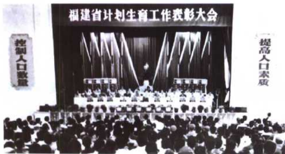
▲ 福建省计划生育工作表彰大会