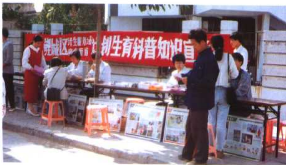
◀ 泉州市鲤城区计划生育 科普知识宣传点