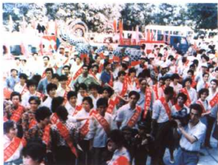
▲ “十一亿人口日”福州组织街头宣传