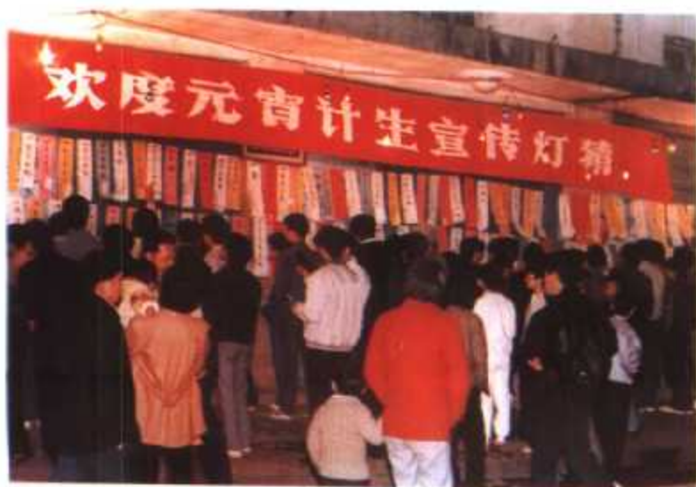
◀ 泉州市“欢度元宵计划生育宣传灯猜”