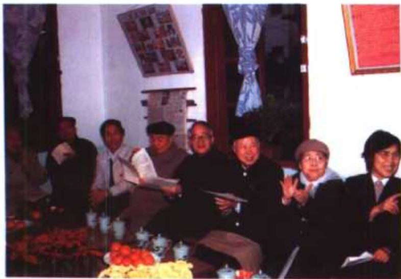
◀ 1989年12月,原全国政协副主席、中国计划生育协会会长王首道(右三)视察福建省计划生育工作