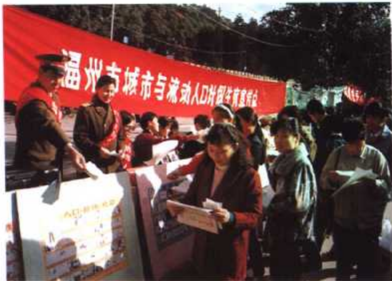
► 福州市“城市与流动人口计划生育”宣传点