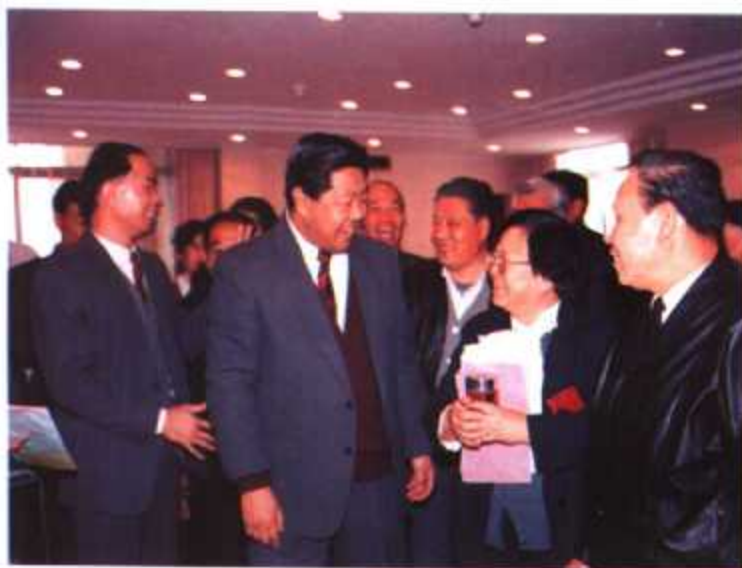
▲ 1991年,国务委员、国家计生委主任彭珏云(右二)视察福建省计划生育工作