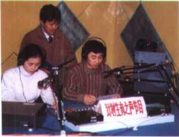
▲ 福州市计生委、计生协与福州人民广播电台联合创办“福州计划生育之声”节目