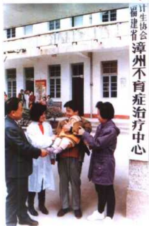
▲ 福建省计生协会漳州不育症治疗中心