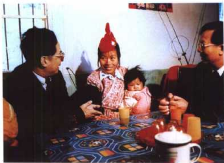
◀ 1996年,福建省省长陈明义(左一)春节期间到连江县慰问畲族计划生育户