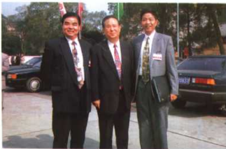
► 国务院副总理姜春云(右二)在四川召开的全国计划生育三结合工作会议上与福建代表合影