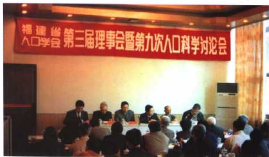
▲ 福建省人口学会第三届理事会暨第九次人口科学讨论会