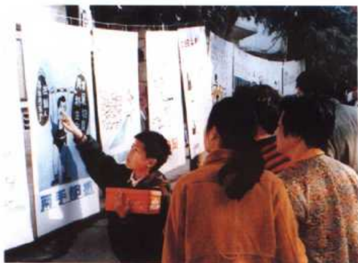
▲ 街头计划生育宣传漫画展