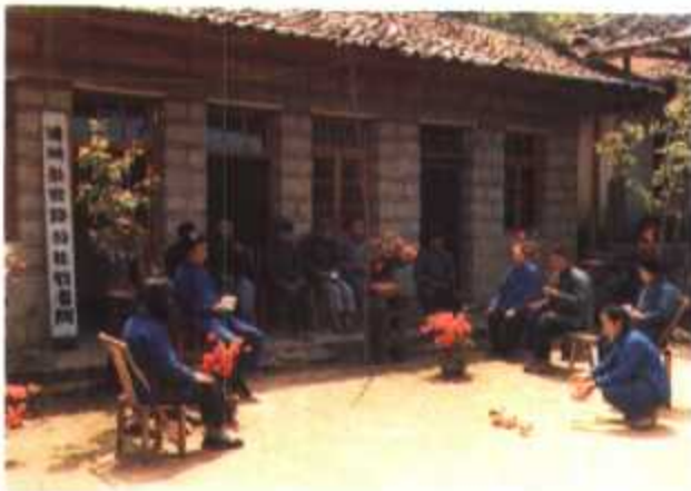
▲ 浦城县官路敬老院