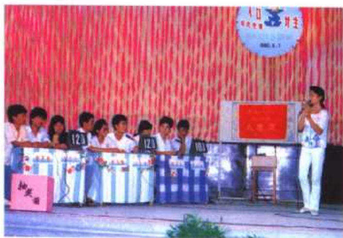
▲ 晋江市举办“人口与计生知识竞赛”