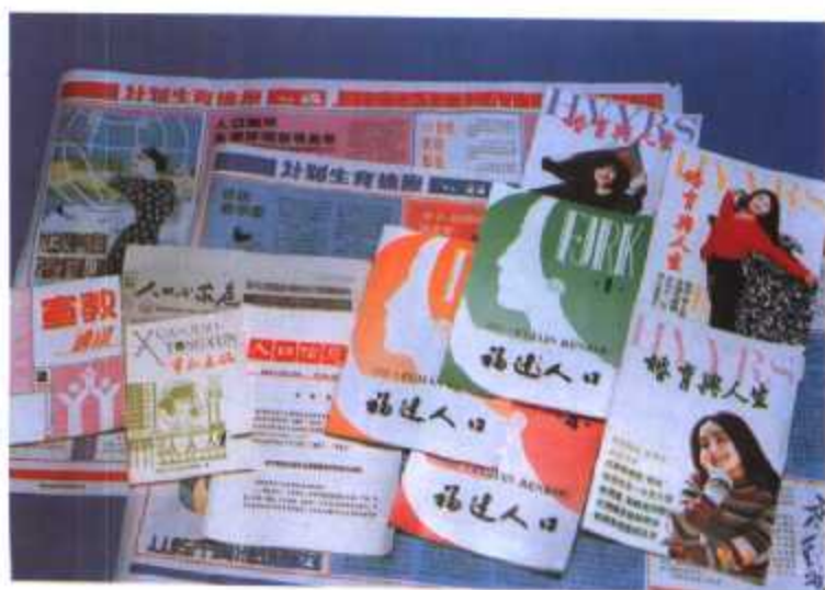
◀ 福建省计划生育委员会出版的报刊