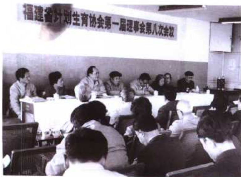
◀ 福建省计划生育协会第一届理事会举行会议