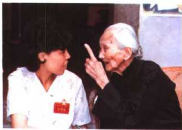
▲ 人口普查员上门为百岁老人登记