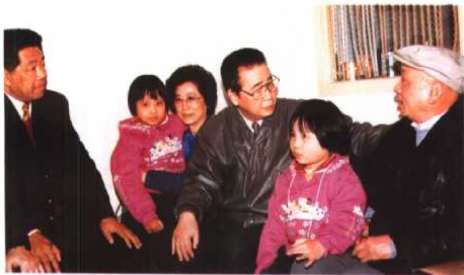
◀ 1989年,国务院总理李鹏(右三)视察福建期间看望退休老工人