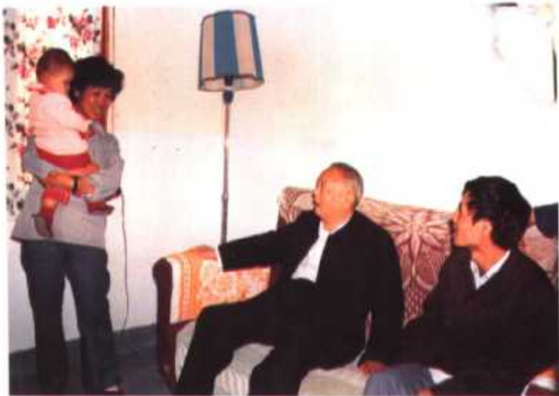
► 1984年11月1日,国家主席李先念(右二)在三明钢铁厂看望独生子女户