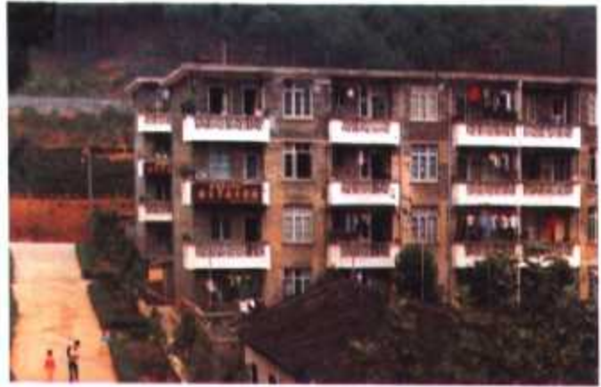
▲ 80年代初,福建顺昌合成氨厂建立独生子女光荣楼