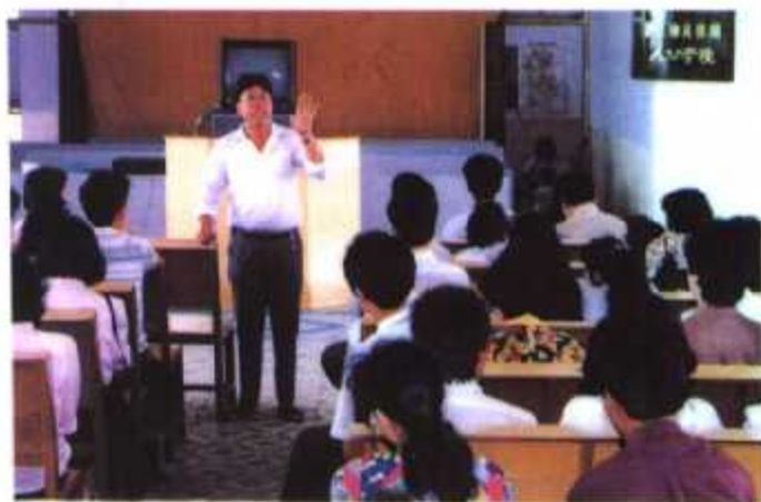
▲ 晋江市英林镇人口学校