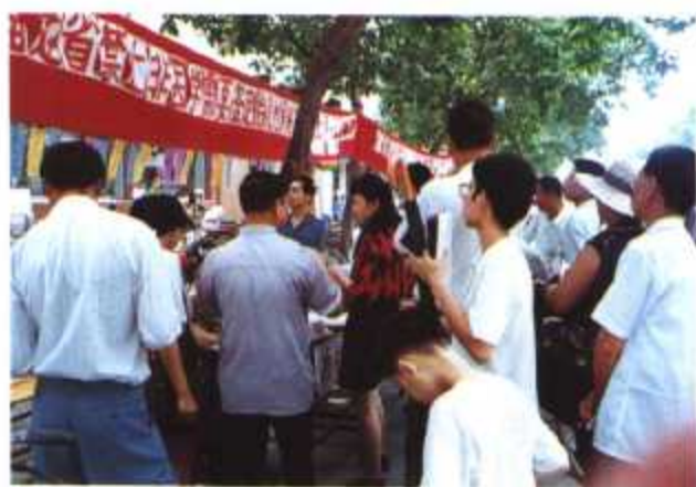
▲ 福建省“禁止非医学需要鉴定胎儿性别”的宣传活动