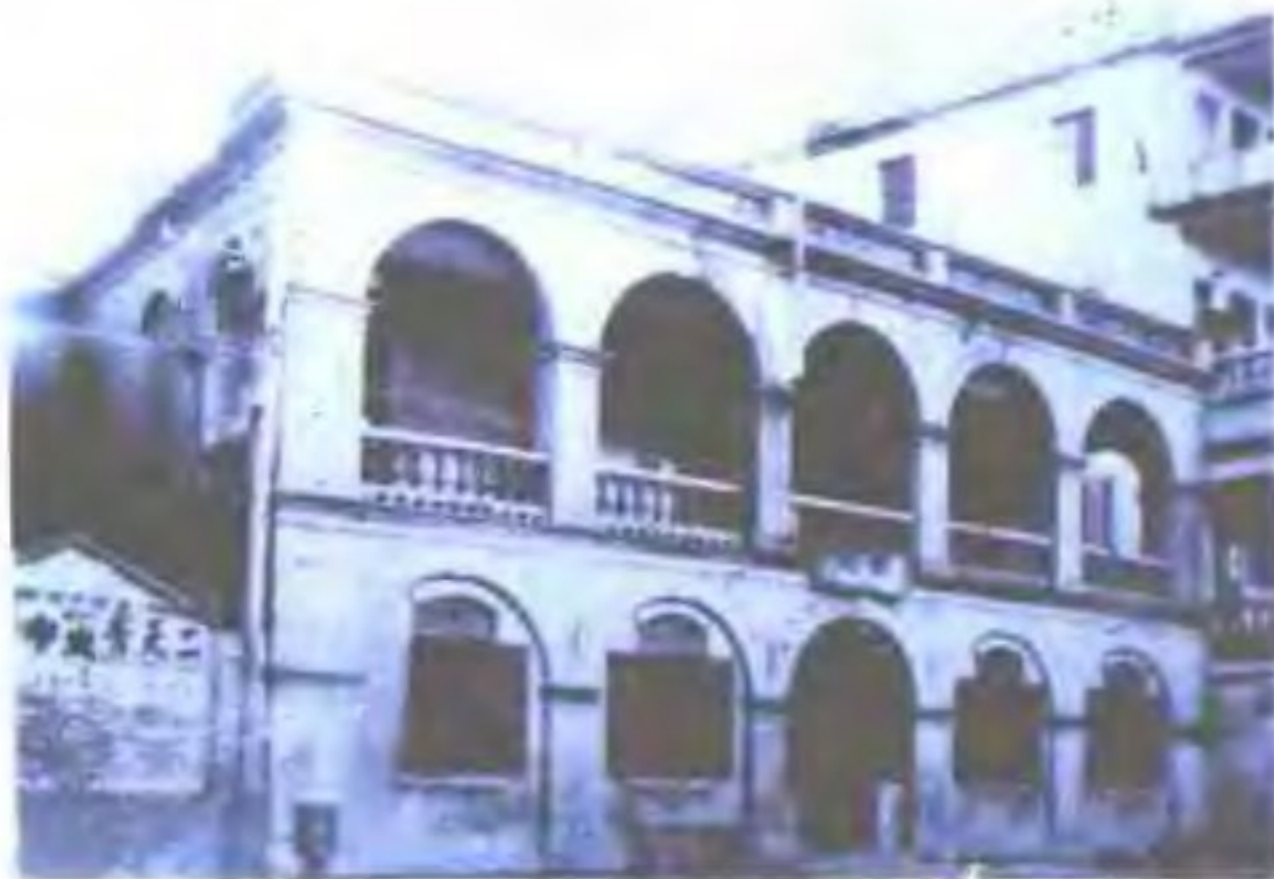
民国时期的厦门邮局