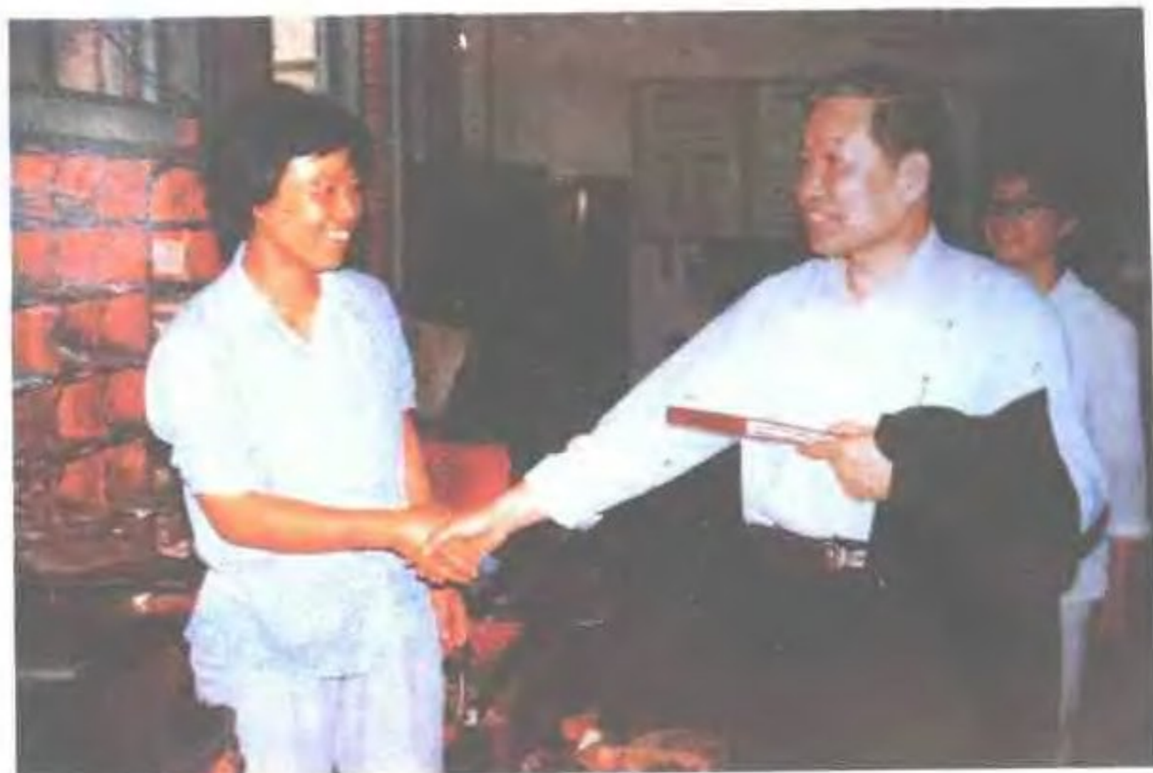
1985年10月11日， 邮电部部长杨泰芳视察 福建省邮件转运处