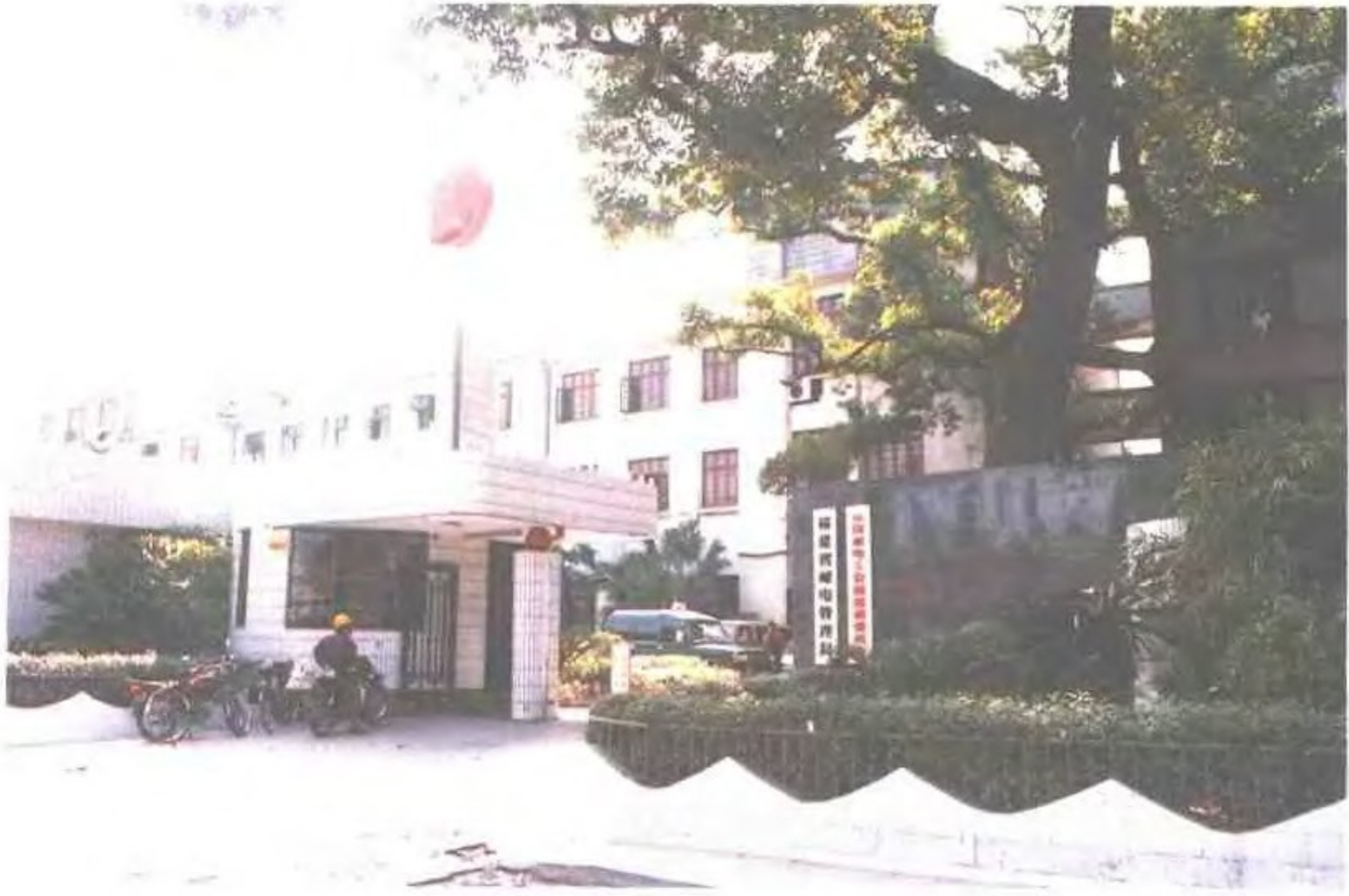
福建省邮电管理局