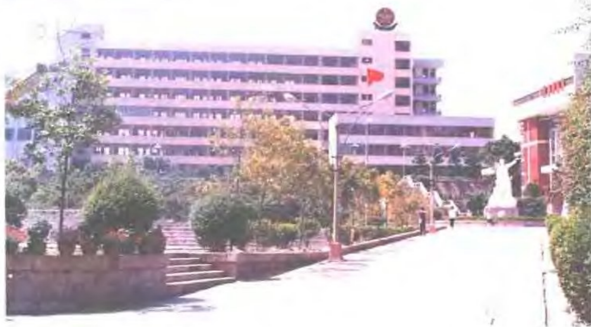
福建省邮电学校教学大楼