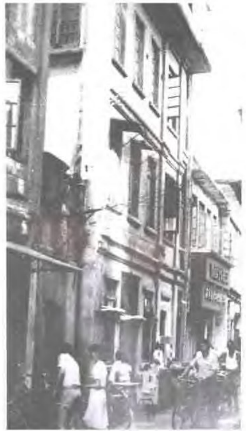
民国时期的厦门电话公司