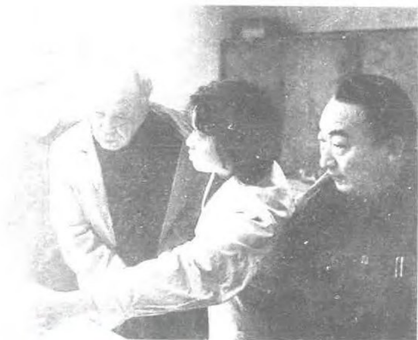
1985年1月11日,国务院副总理万里视察福州电信局程控电话设备