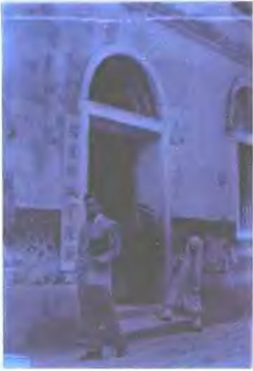
建邮政管理局 民国时期，设在福州泛船浦的福