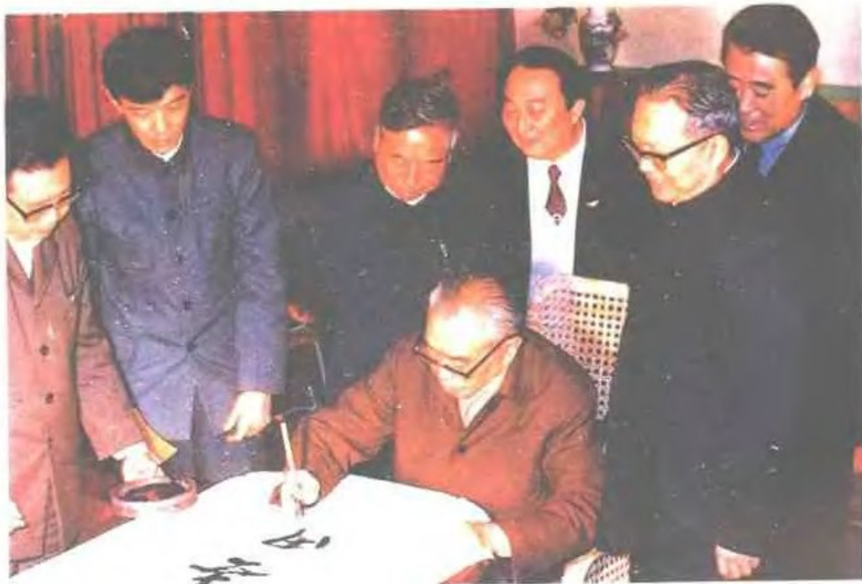
1987年1月20日， 全国人大常委会副委员 长朱学范视察福州电信 局并题词作勉