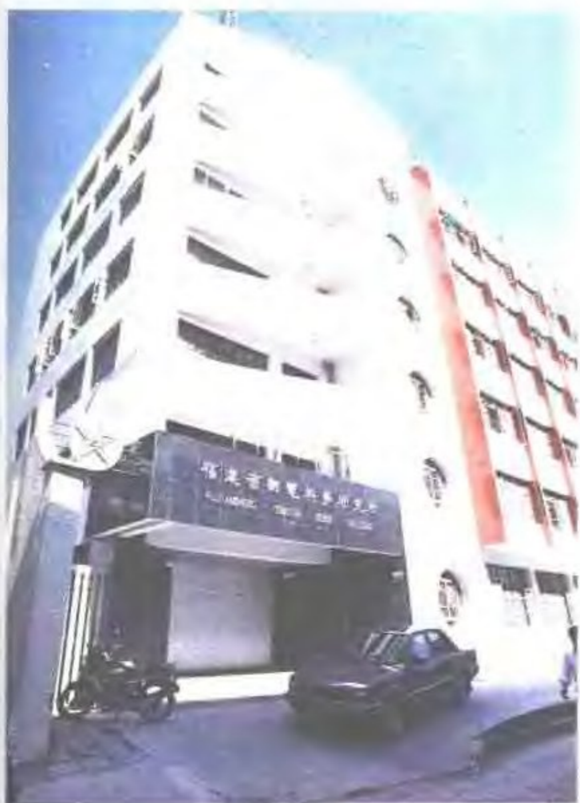
福建省邮电科学研究所