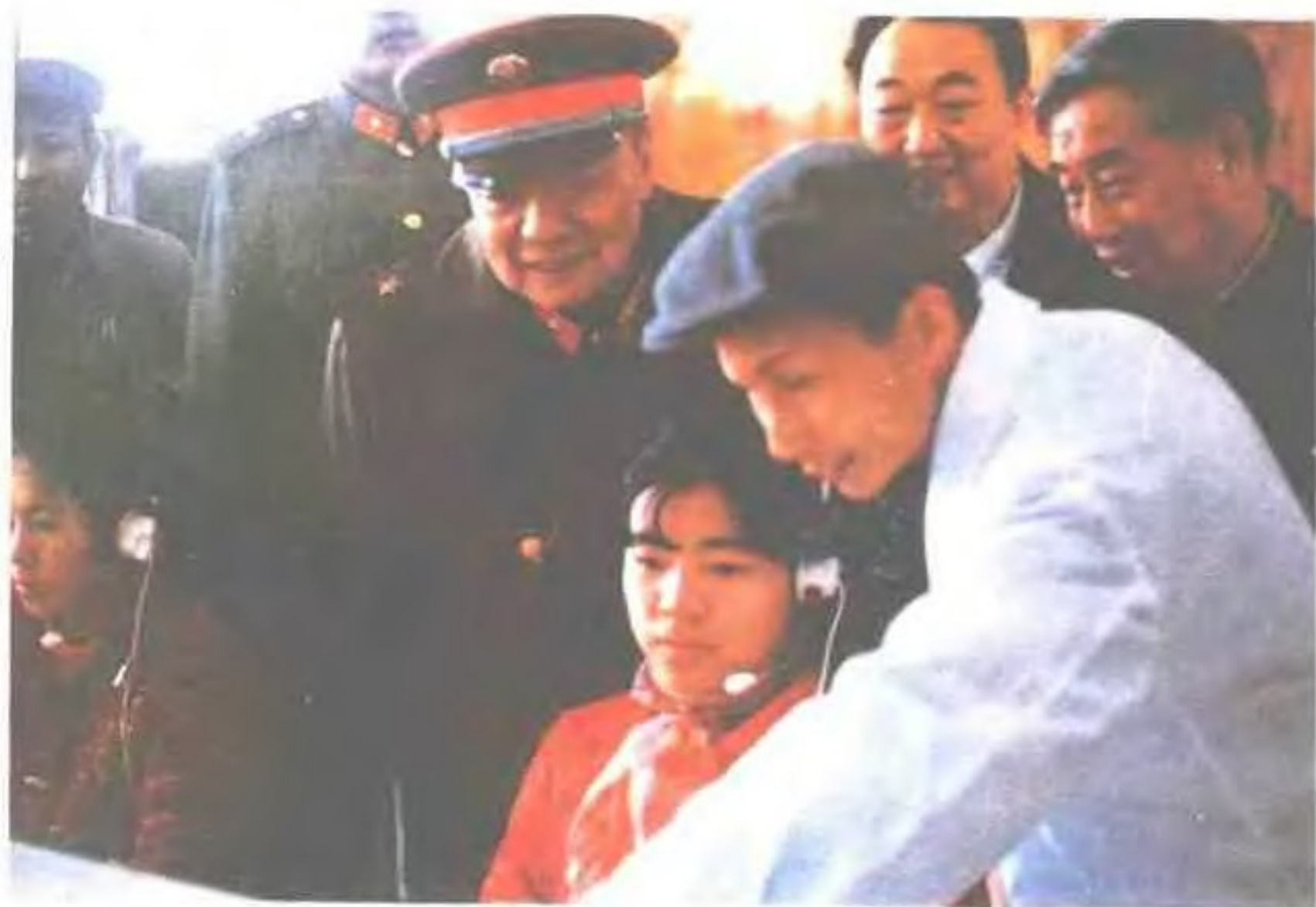
1986年2月8日,中央军委副主席杨尚昆视察福州电信局长途交换台