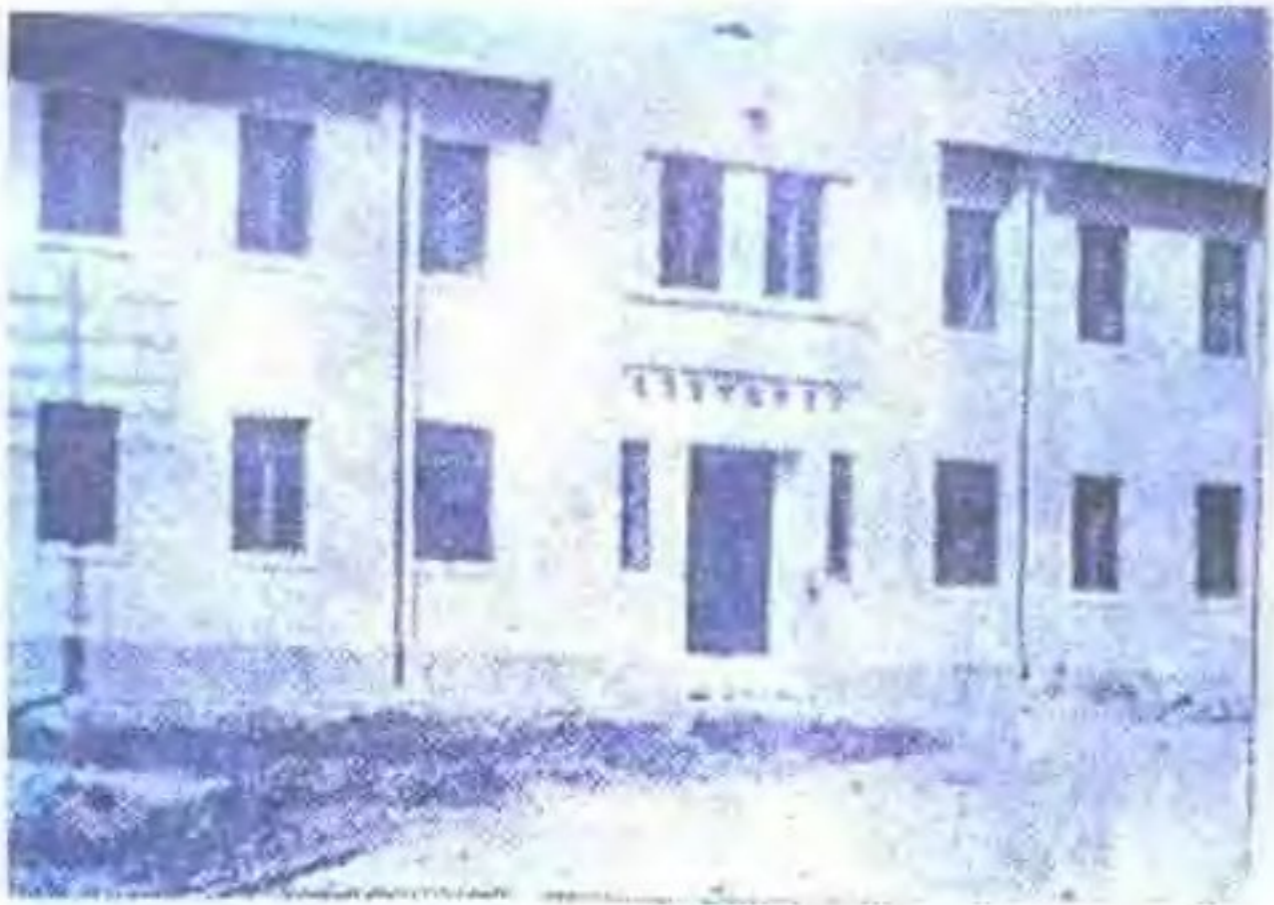
民国时期，设在福州东窑的福州电信指挥局