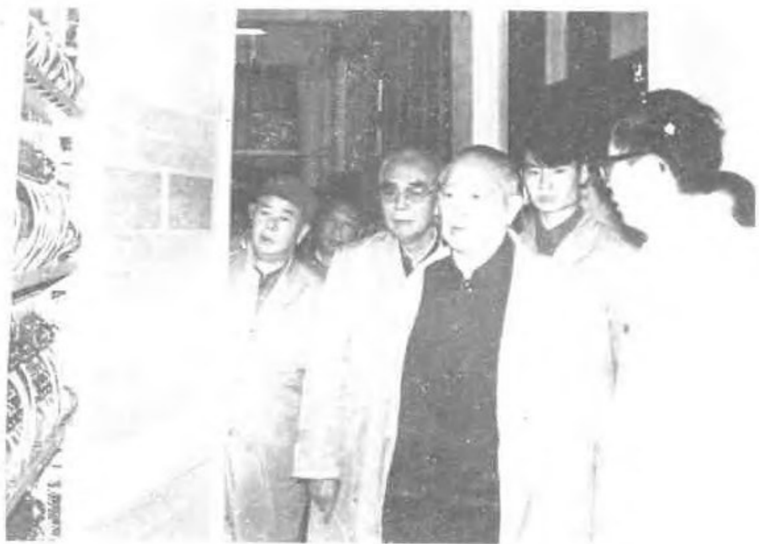
1982年11月,全国第一套万门程控电话在福州开通后,1983年10月18日,国家主席李先念视察福州电信局程控电话设备