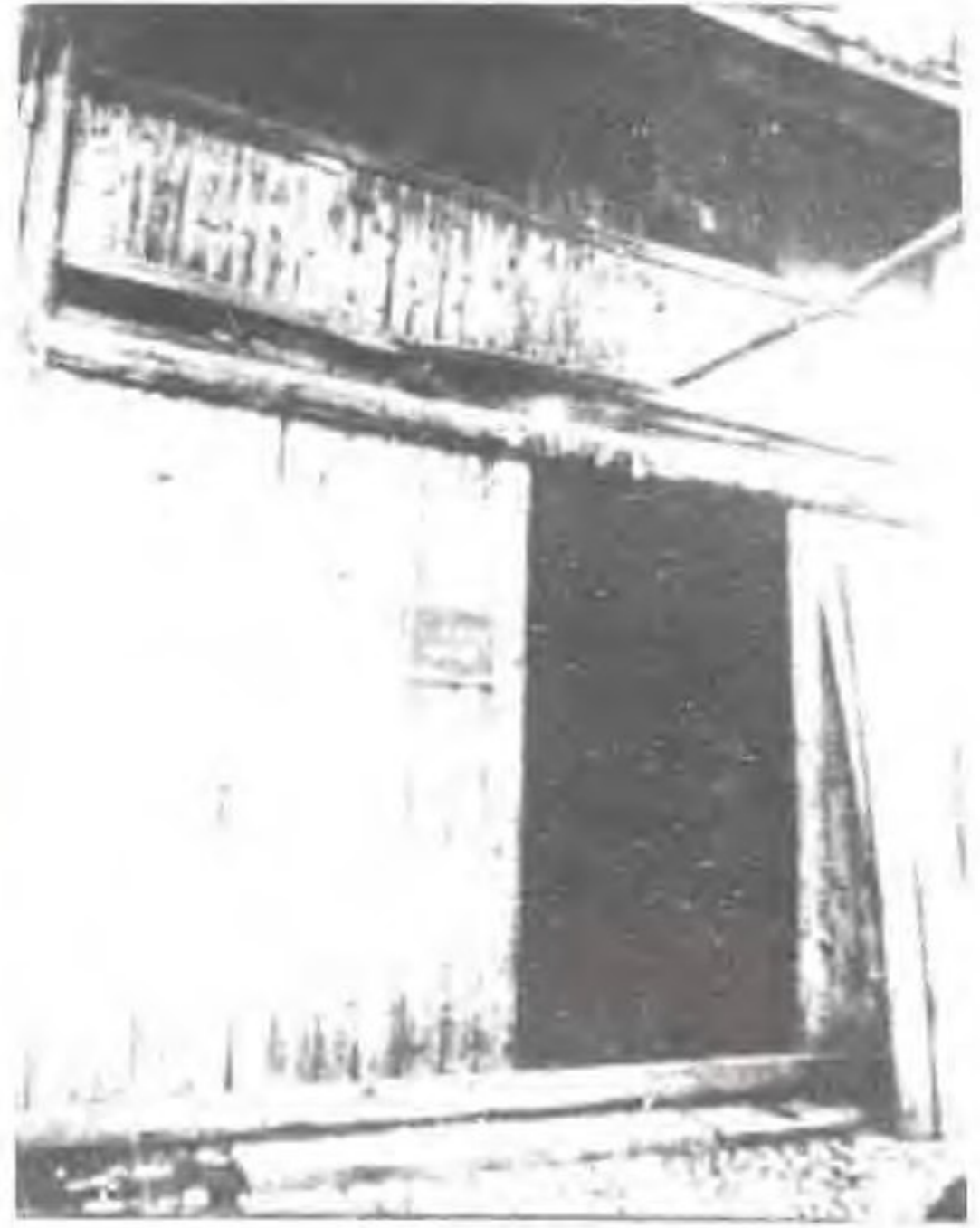
1932年，设在长汀县五通街的中华苏维埃福建省邮政管理局