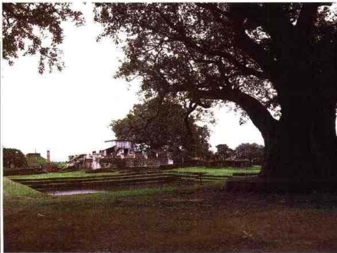
图3 尼泊尔 蓝毗尼园遗址