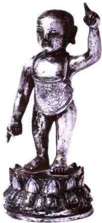
图1 明代金铜释迦太子诞生像 高17.5厘米 美国旧金山亚洲美术馆藏

如果没有诞生释尊(图1),佛像也就不能产生。然而,佛像从其创始期开始,到底在多大程度上更接近释尊的真容呢?莫如说,是在多大程度上被理想化,即佛像在其制作的地方是在多大程度上受到当地风土强烈影响的。顺着佛像的系谱,可以看清其地域及其地域上释尊的理想像和真实姿容之间的差别。在这里,首先从社会环境和人种观点出发,依据史实,尽可能地将释尊的生涯概观如下。