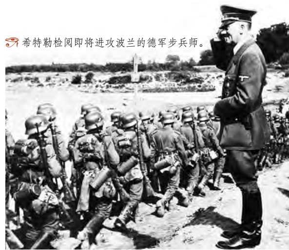
希特勒检阅即将进攻波兰的德军步兵师。

可是，这个时候已经太晚了，海涅及其小分队已经打响了第二次世界大战的第一枪，波兰人开始对德国有所提防，6天之后，也就是1939年9月1日凌晨4点45分，战争终于爆发了。