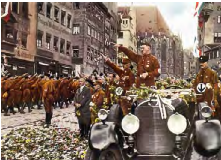
👉 不可一世的希特勒曾经受到德国民众的狂热拥戴。

这个时候，德军相继占领了北欧小国丹麦和挪威，德军最高统帅部认为进攻西欧的时机已经成熟。1940年5月7日，希特勒下令实施略作修改的“黄色计划”。早前由于情报泄露，在集团军参谋长曼施坦因的提议下，将原计划经比利时中部以法国巴黎为主要突击方向改为以阿登山区为主要突击方向，该建议令希特勒大加赞赏。他们派出250万德国军队集结在法国、荷兰以及比利时边界。