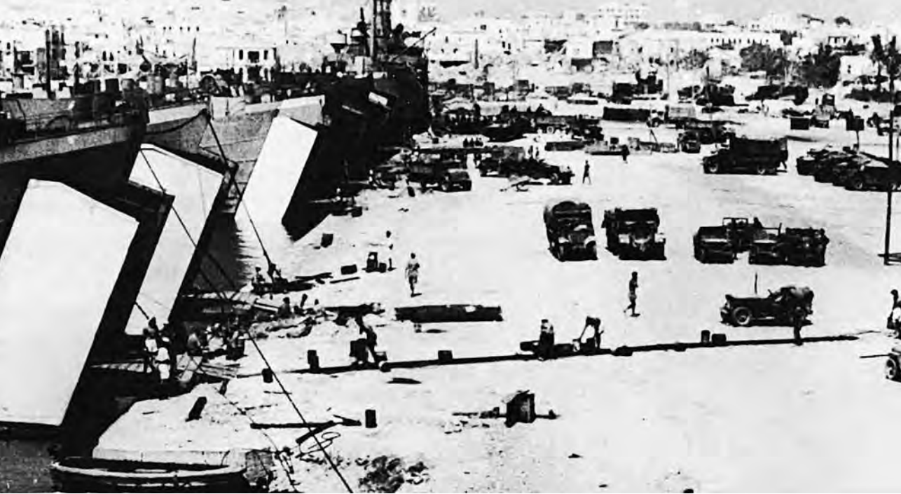
1943年，盟军在突尼斯苏塞港集结准备进攻意大利西西里岛。

飞机被击伤，伞兵们无奈之下顾不上方位对与不对，慌慌张张地便跳了下去。在10日凌晨，美第82空降师的2000余名伞兵七零八落地着陆了，许多伞兵，连盖文上校本人在落地后都不相信是否是落在了西西里岛上。显然，预定的任务是完不成了，他们只好一边各自为战，一边收拢失散的部下，至中午时，已收拢200余名伞兵，在兵力不足的情形下，他们仍击退了德军对美第45师登陆场的反扑。