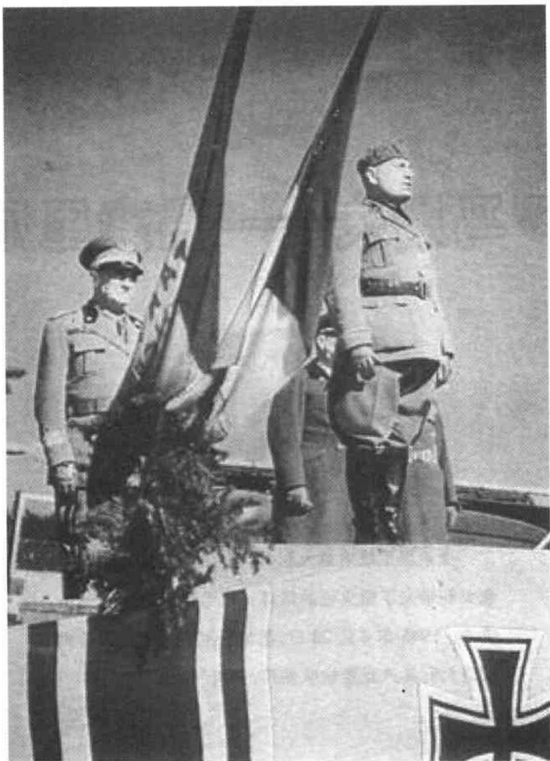
罗马屠夫——墨索里尼