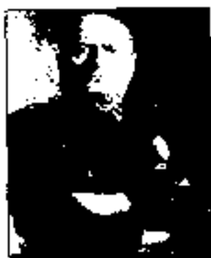
罗马屠夫——墨索里尼