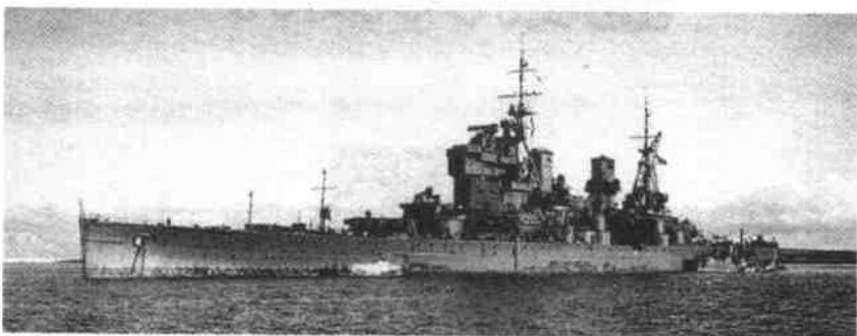
“英王乔治五世”号战列舰