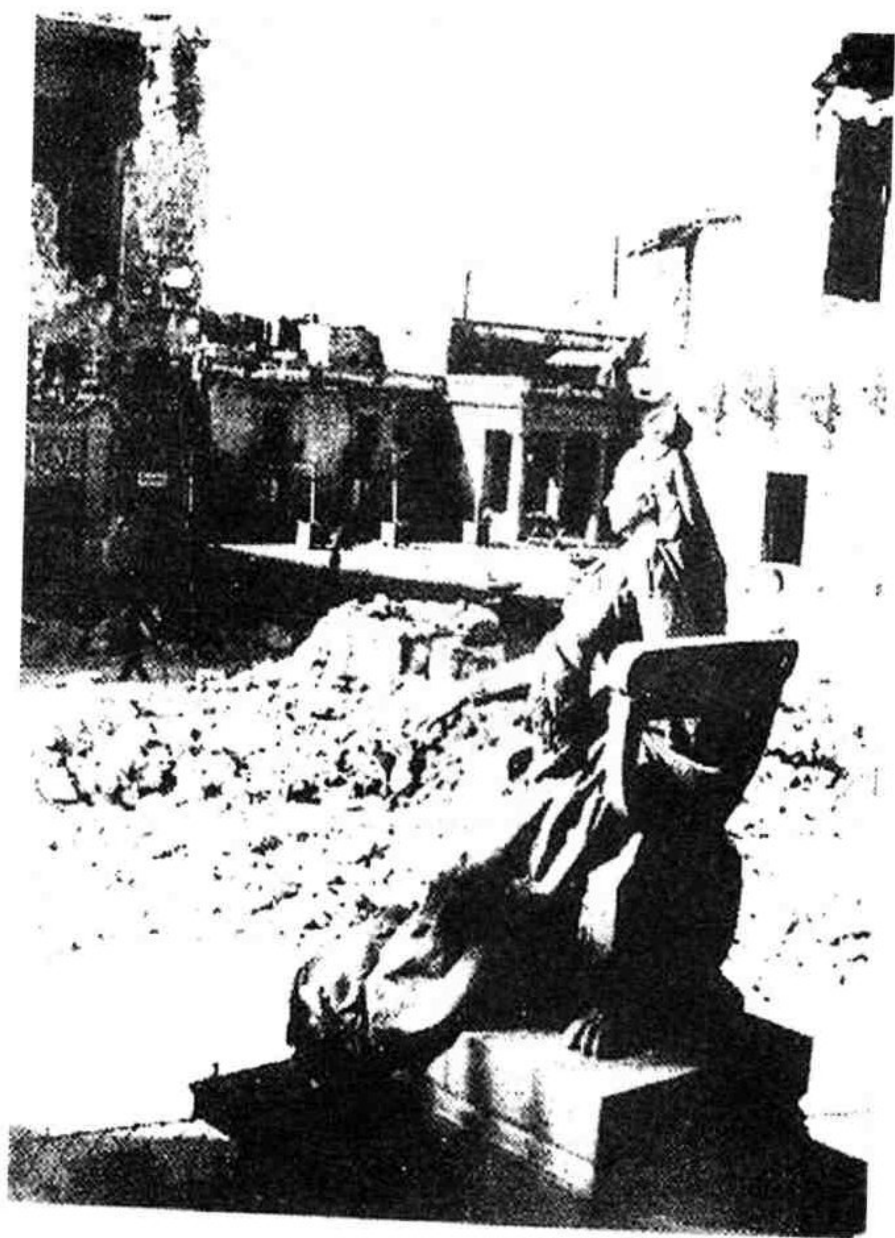
遭意军破坏的城市一片断垣残壁