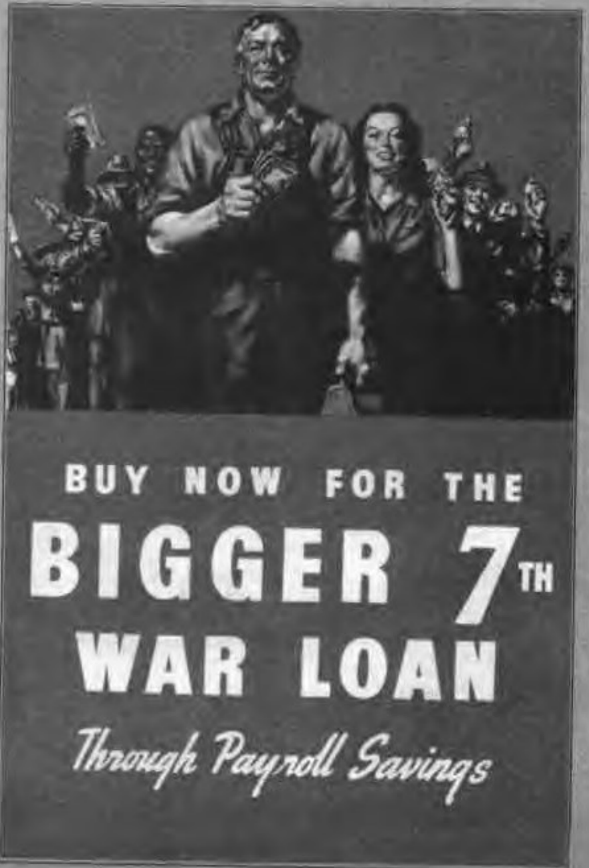
家园已成为一片废墟(左上),正在祈祷的孩子(右上),这一切都警告美国人,他们的港湾开始不安全。右图为踊跃购买8500万战争债券的美国公民。