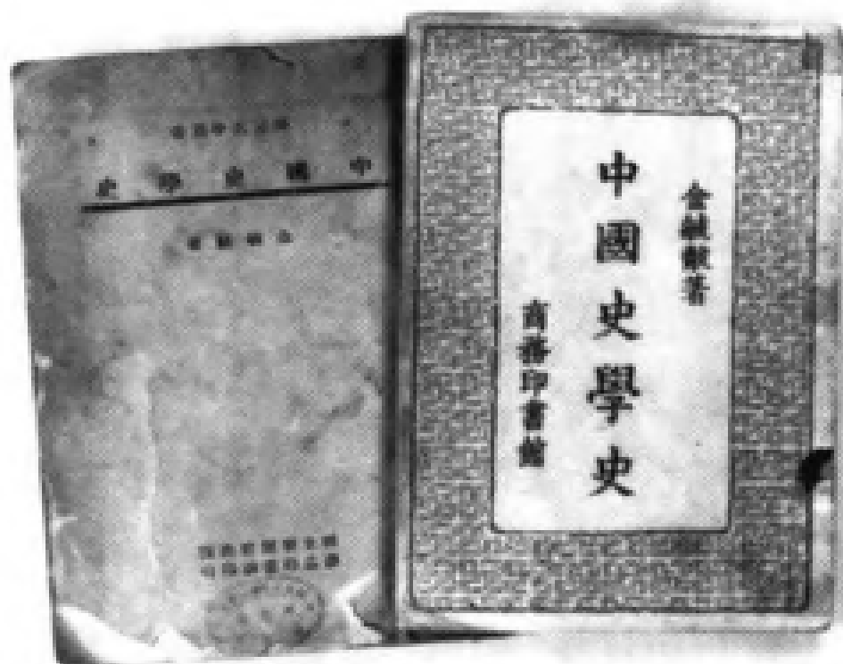
1944 年和 1957 年商務印書館出版的《中國史學史》書影