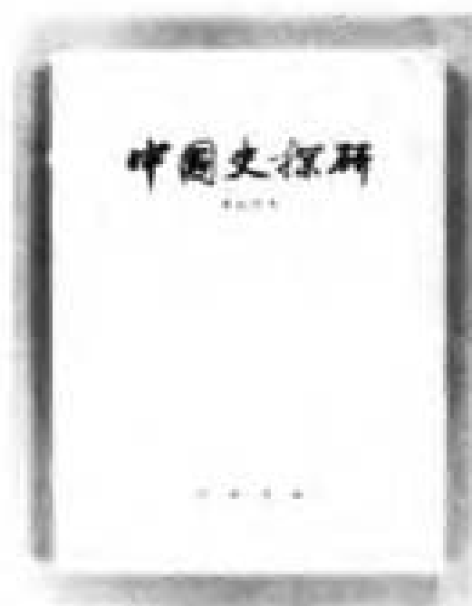
《中国史探研》中华书局 1981 年版书影