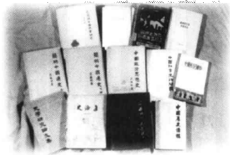
吕振羽先生部分论著书影