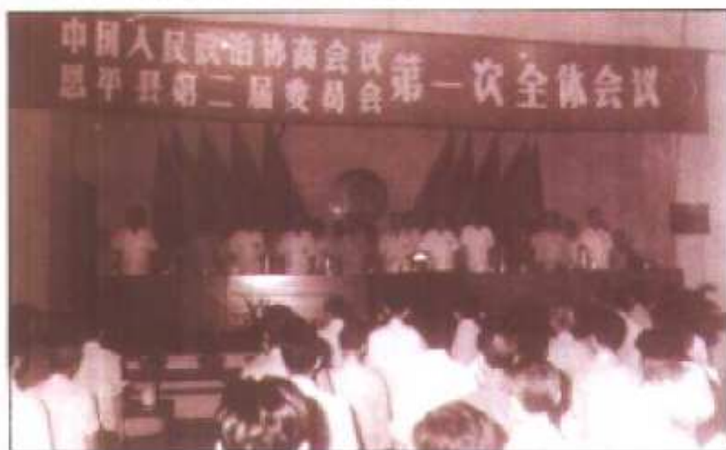
△县政协二届一次全委会于1984年5月16日至23日在恩城召开。图为大会开幕式。