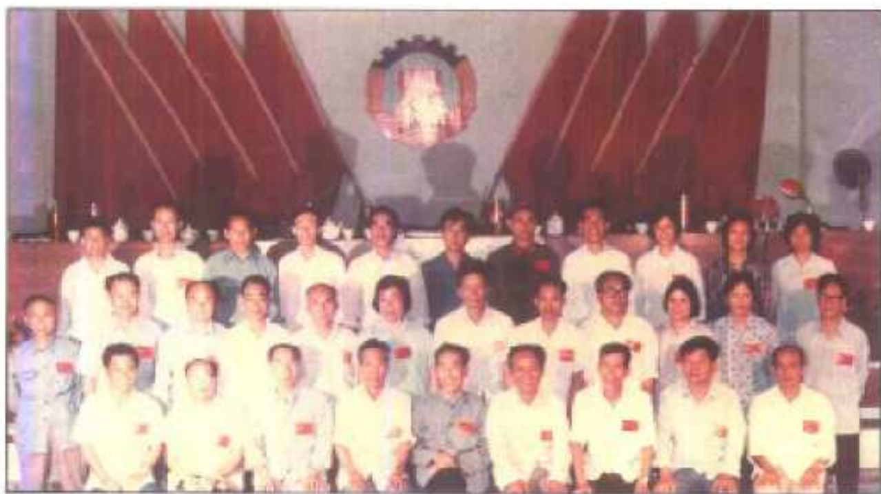
△县政协二届一次会议当选常委合影。