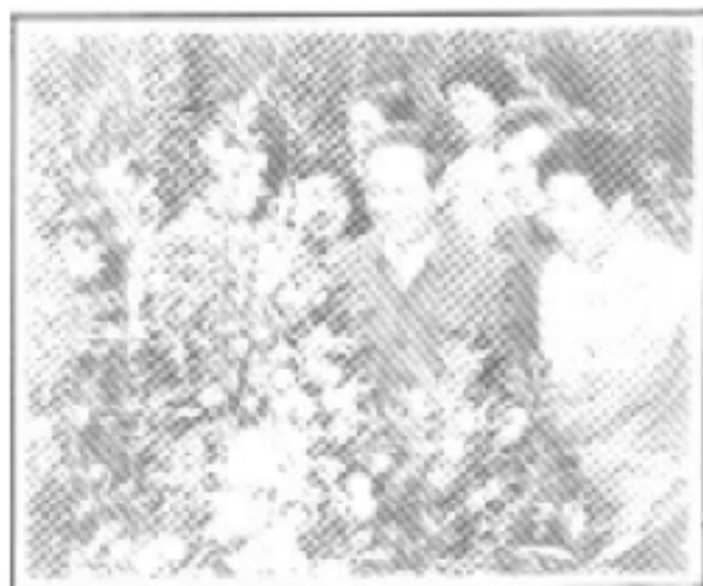
△关中人副主席和农业组委员在柑桔园。