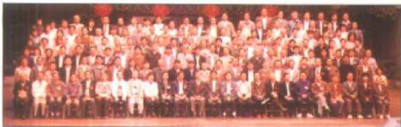
△县政协四届三次全体委员合影。