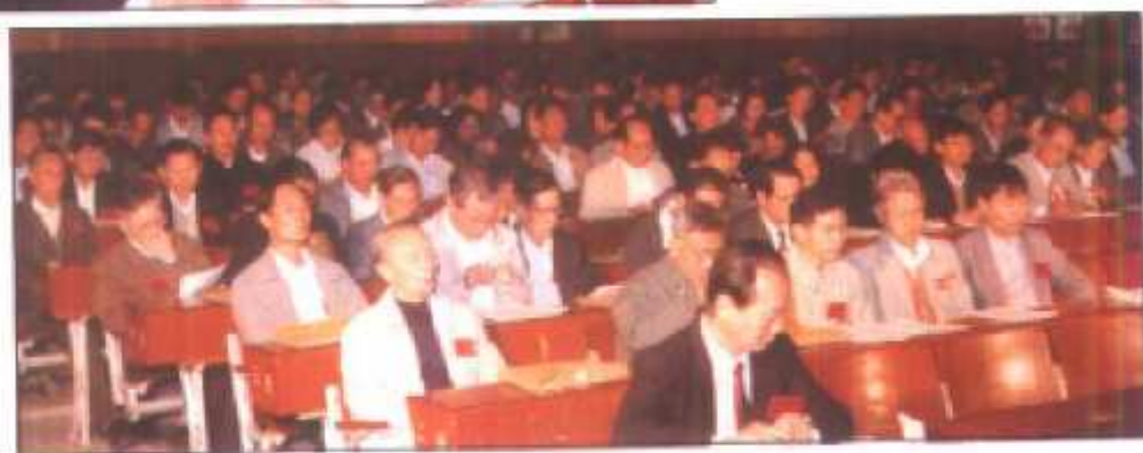
△在四届二次会议上，全体委员听取政协常委会的工作报告。