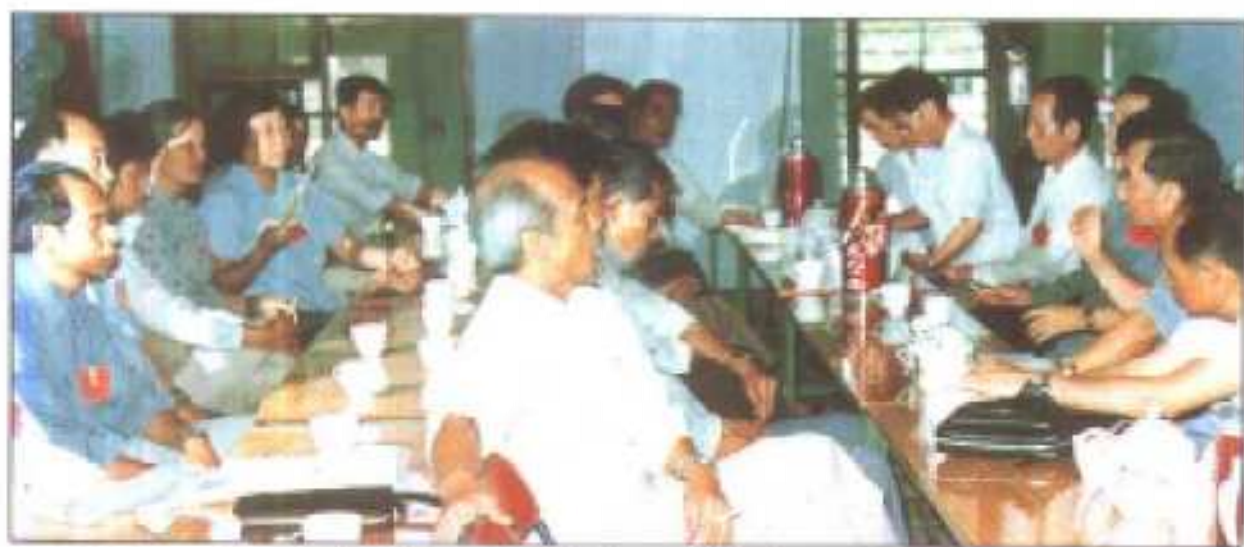
△县政协二届一次全委会选出的常委们在讨论。