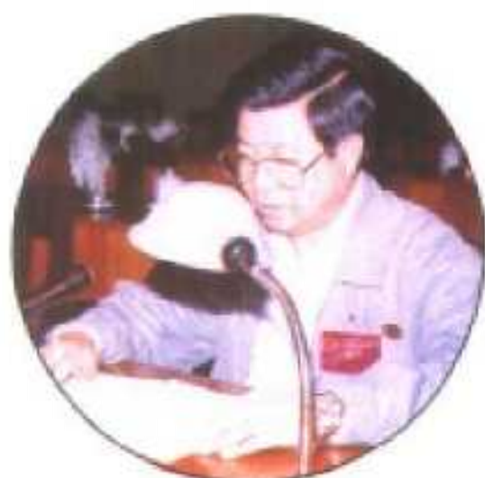
△钟国特委员(工业界)在三届一次大会上发言。