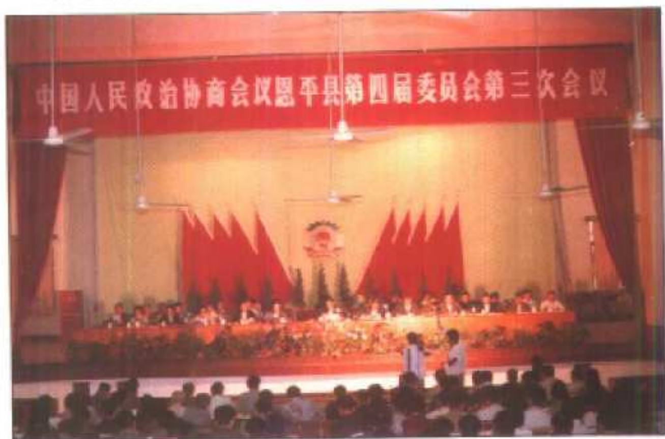
△图为县政协四届三次会议会场。