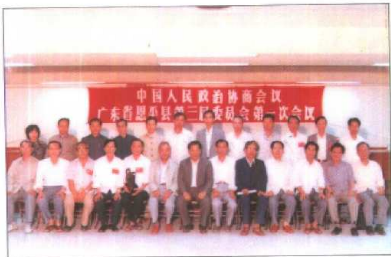
△县政协三届一次会议期间,县委、县人大、县政协、县纪委领导同新当选的政协领导合影。