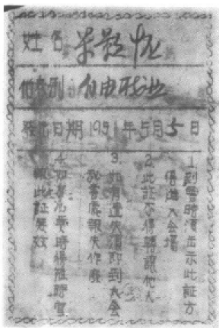
图为代表会议出席证背面