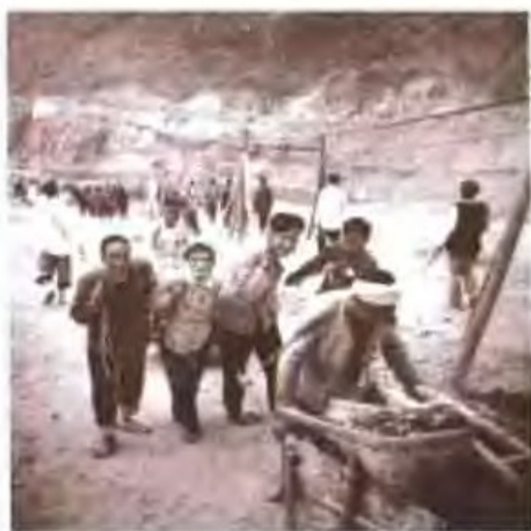
宣传队员参加劳动