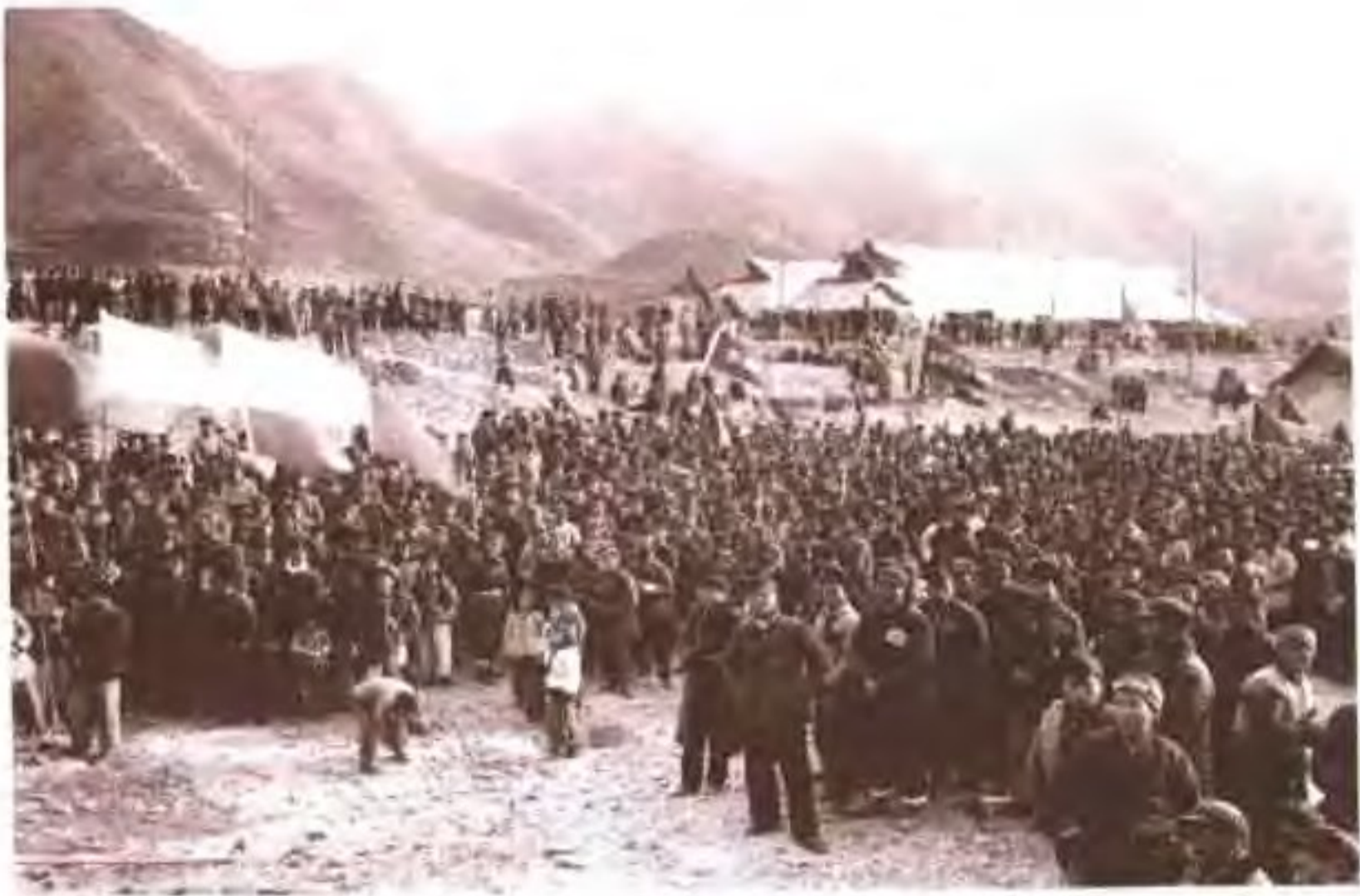
1959年12月、横器水库堵口誓师大会会场