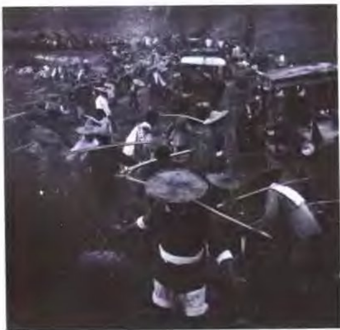
横锦水库施工场面之三