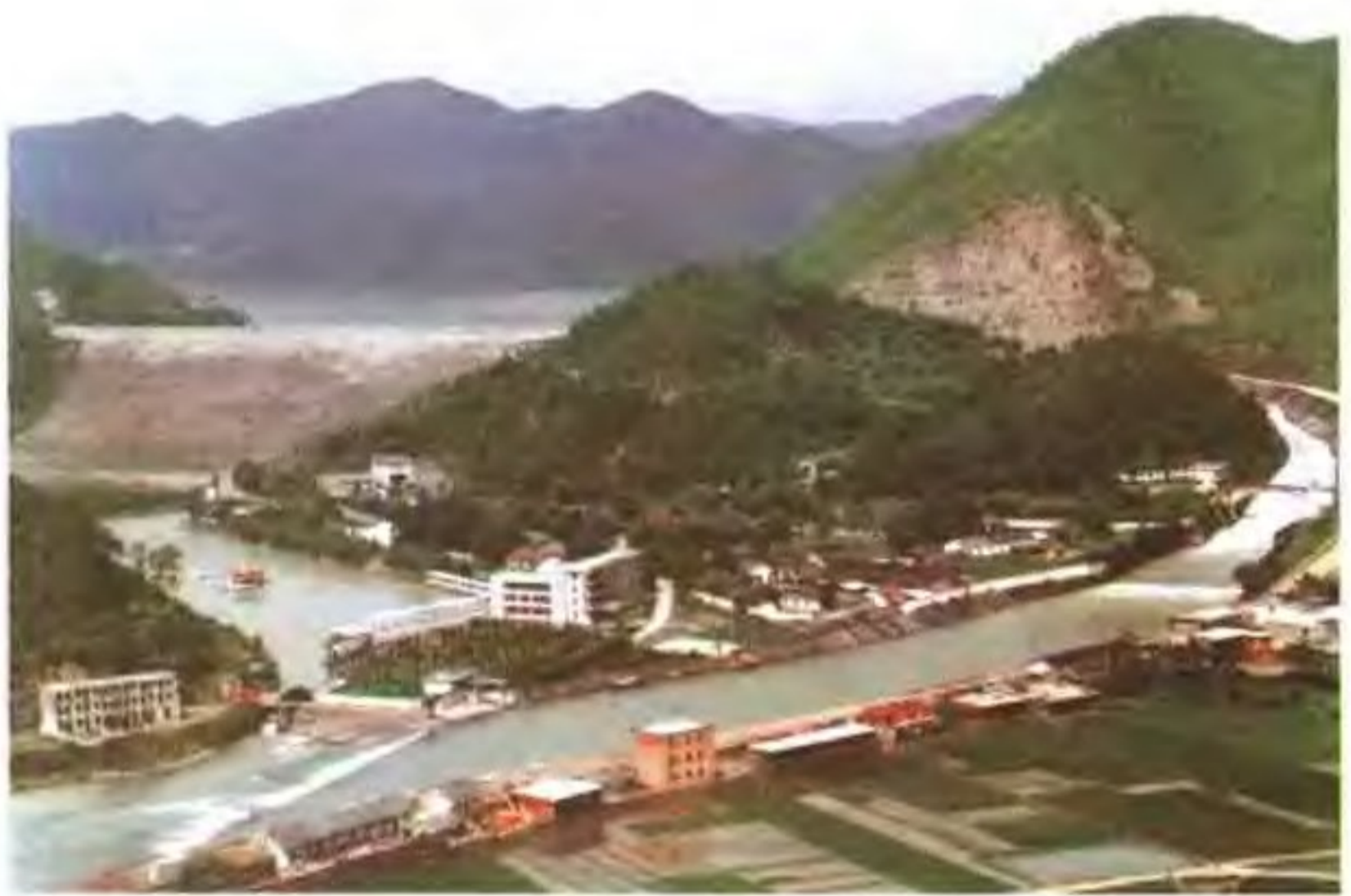
横锦水库景观照之二