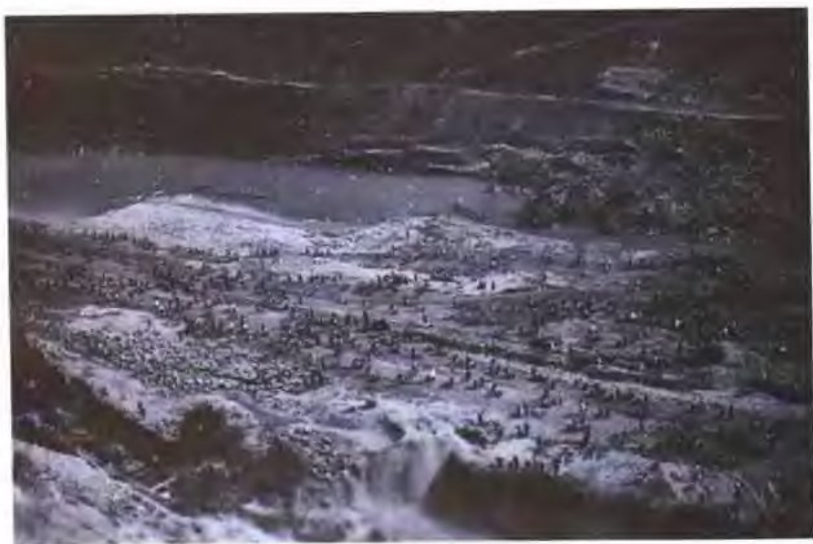
横锦水库施工场面之四