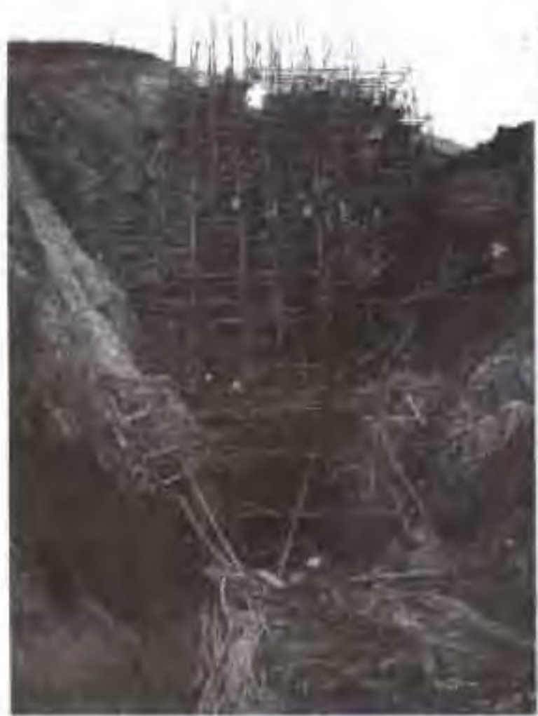
正在施工的横锦水库发电隧洞