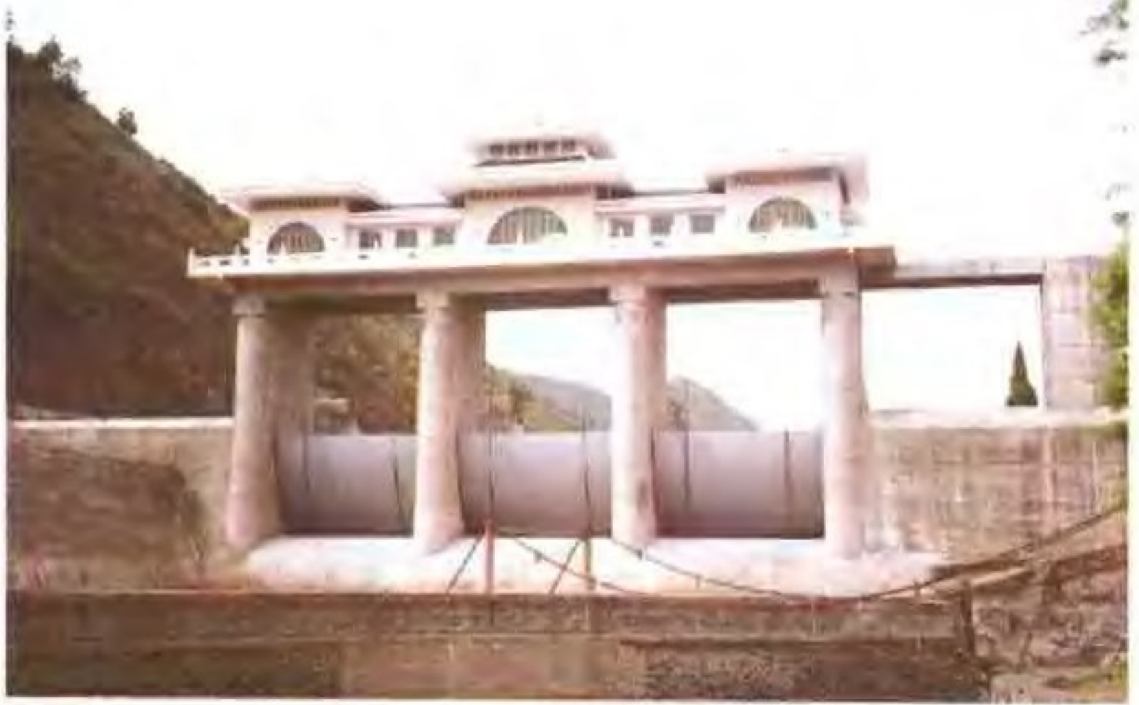
横锦水库景观照之一