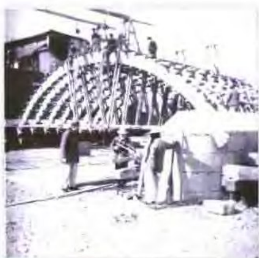
歌山大桥渡槽施工中