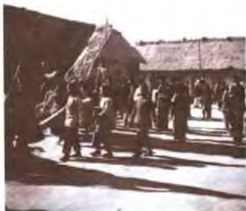
横锦水库工地民工营房曾两次失火 图为火灾后群众前来慰问