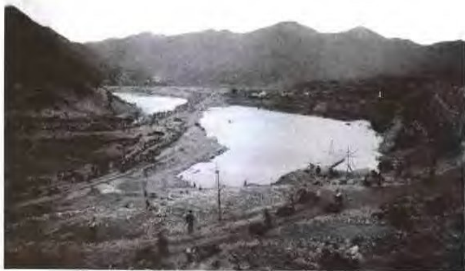
横锦水库施工场面之一