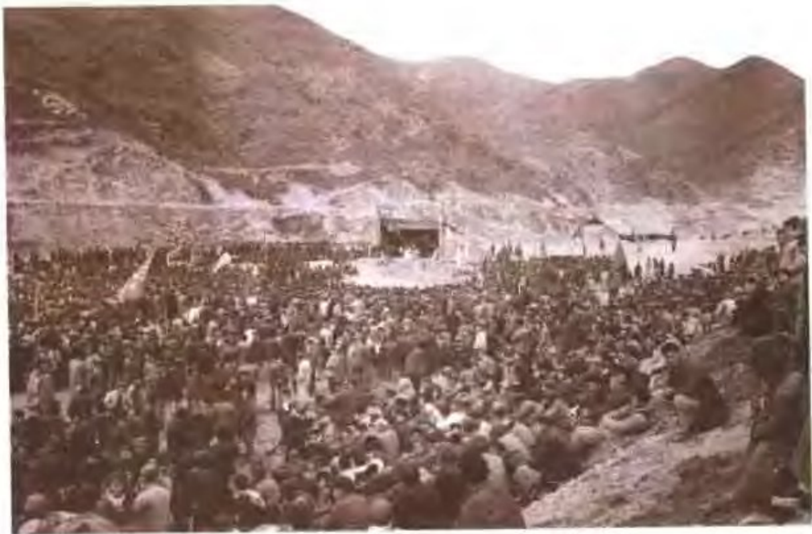
横器水库工地颁奖大会会场