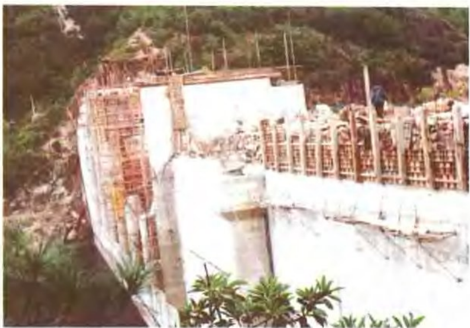
南江水库加高加固工程施工