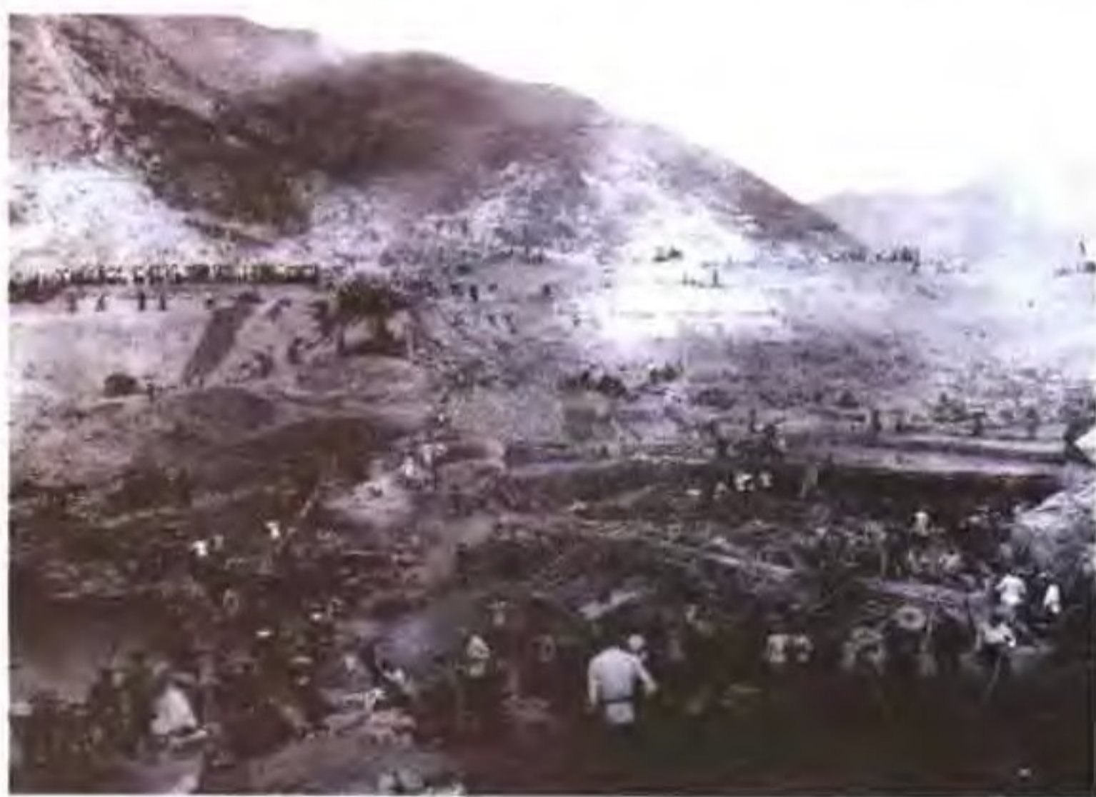
横锦水库施工场面之二