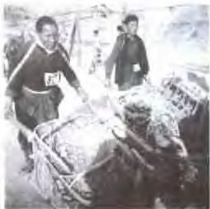
横锦水库工地拉车比赛现场