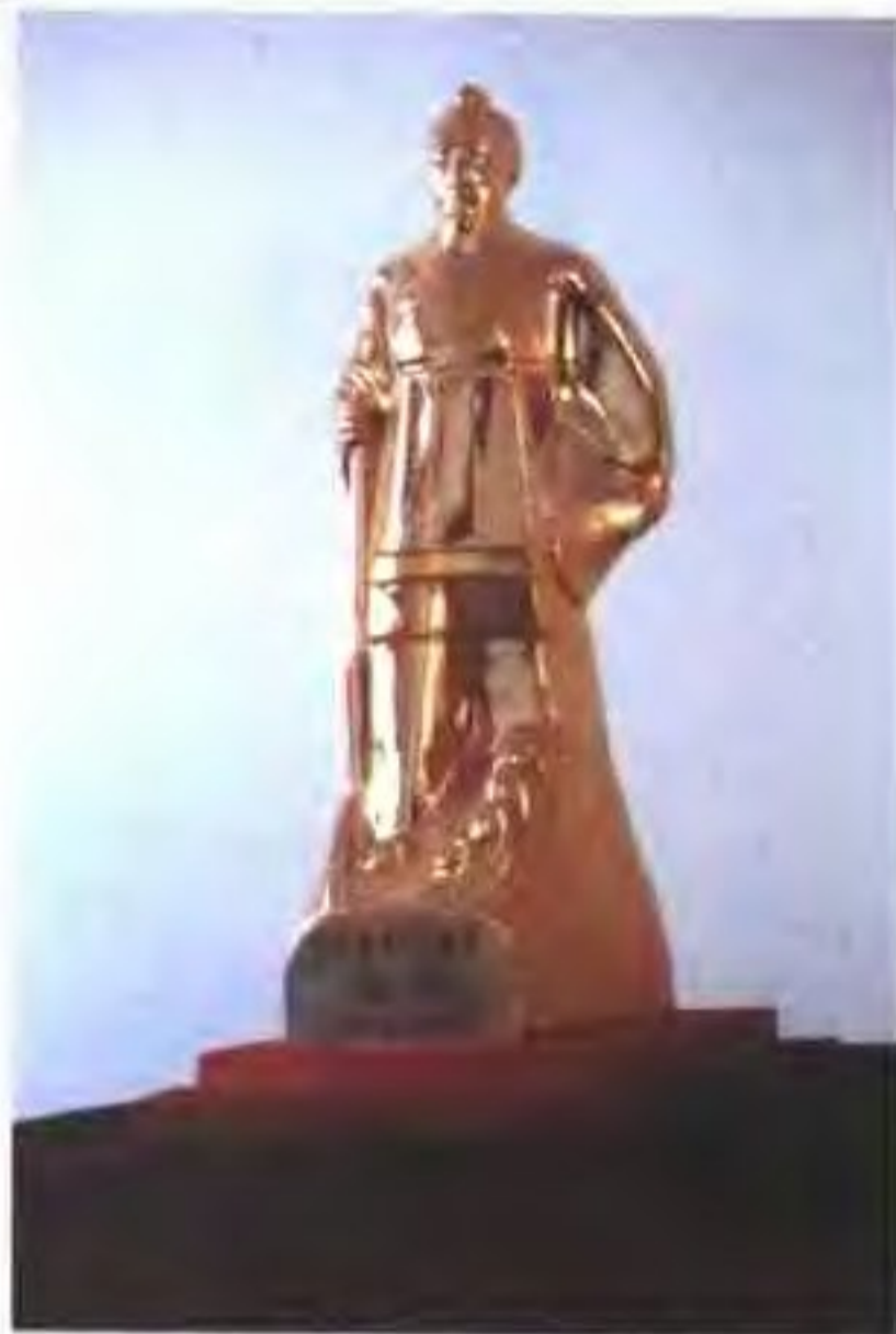
2001年获省水利建设“大禹杯”金奖