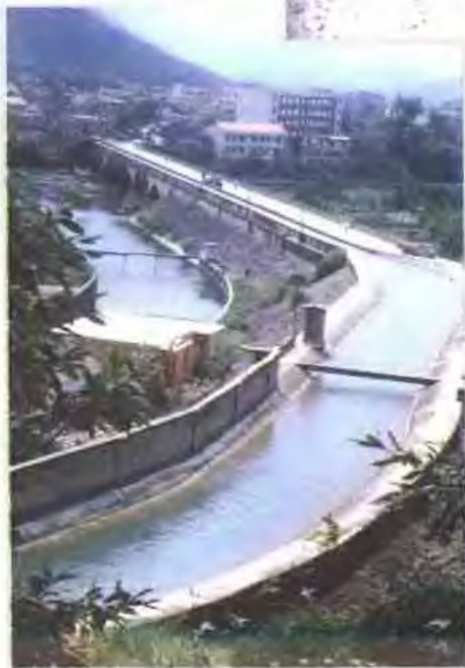
建成后的歌山大桥渡槽