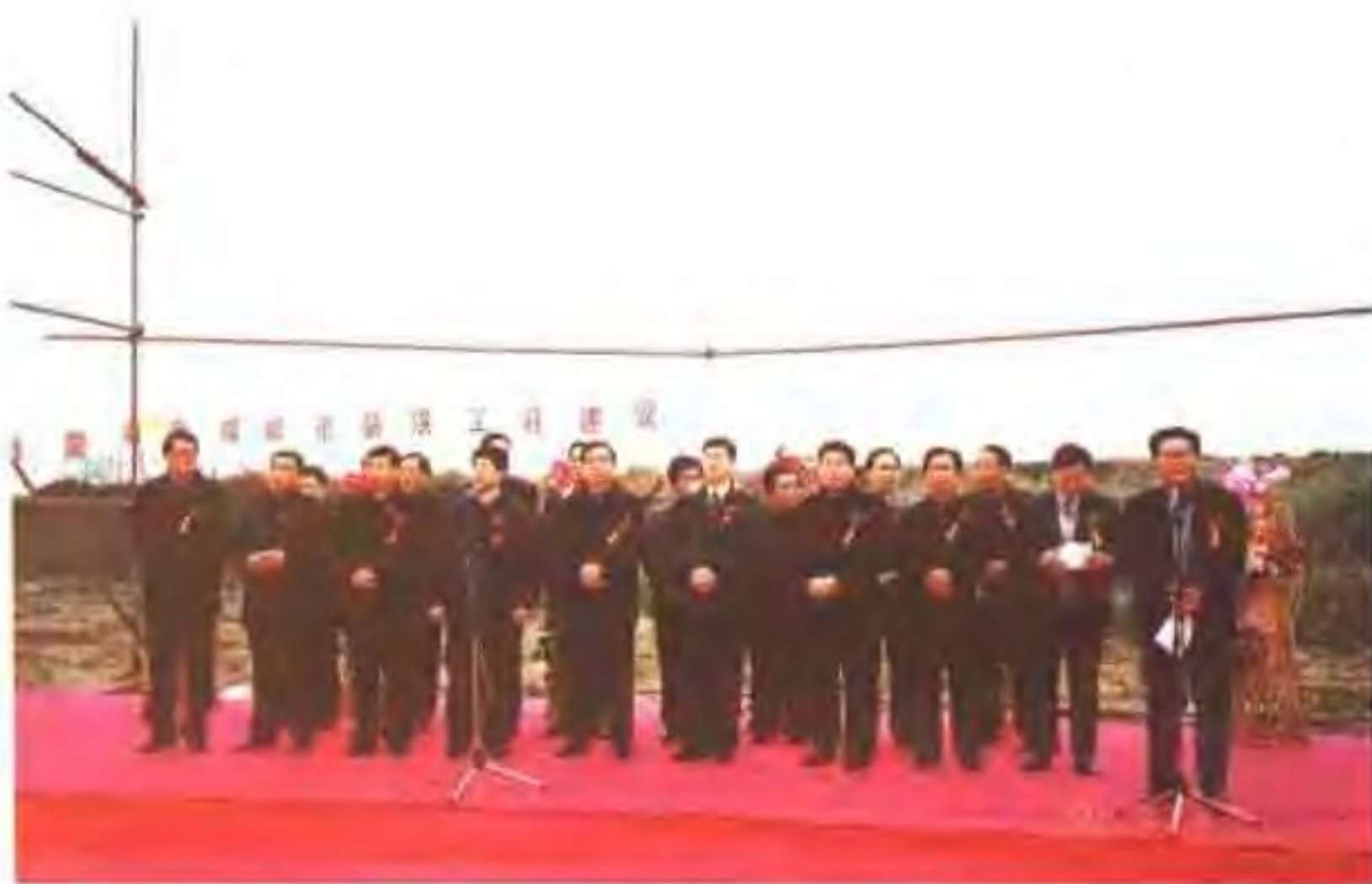
2001年2月8日常务副省长吕祖善、金华市委书记汤黎路等 参加我市城市防洪二期工程开工典礼