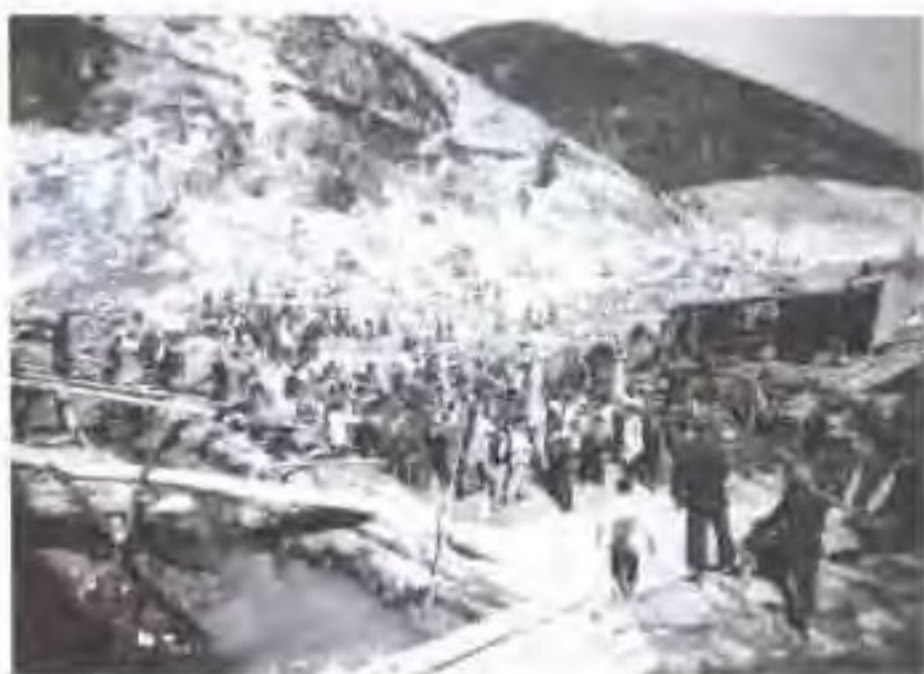
横锦水库工地心墙夯土大会战