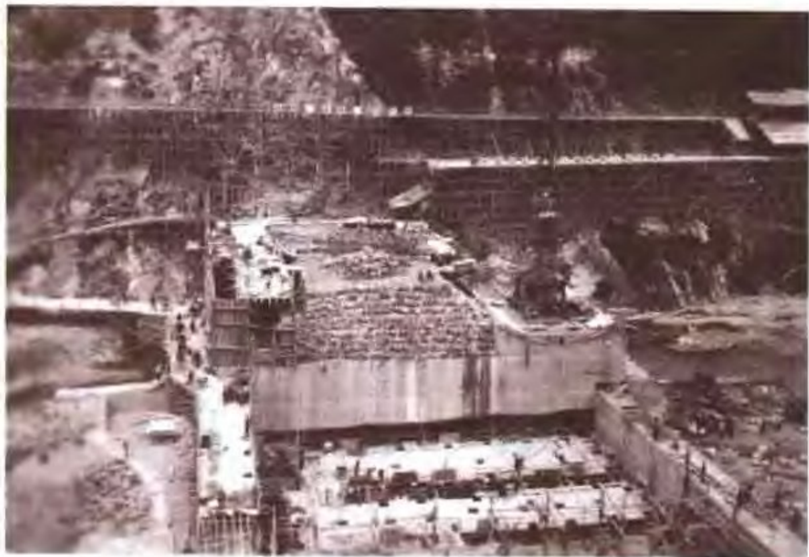
南江水库大坝施工现场