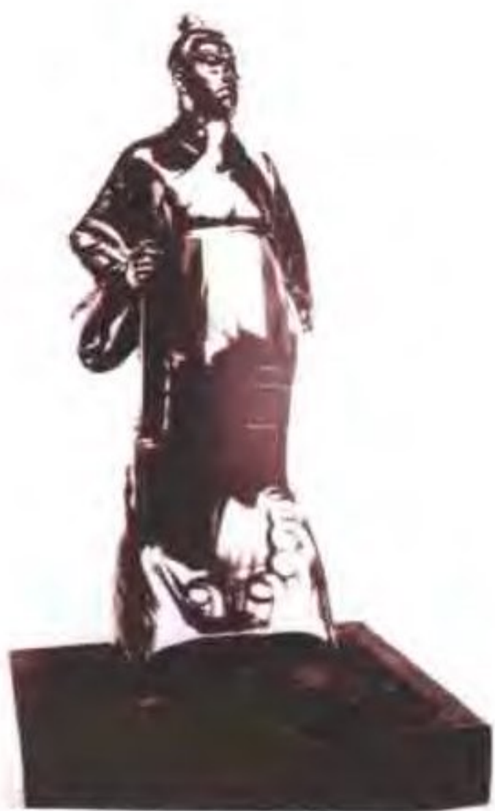
1995年获省首届水利建设“大禹杯”铜奖