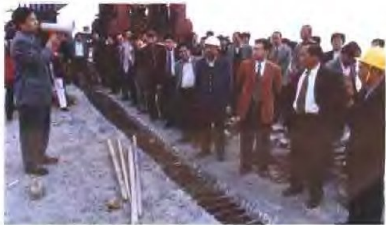
▷ 德庆西江大桥合龙。