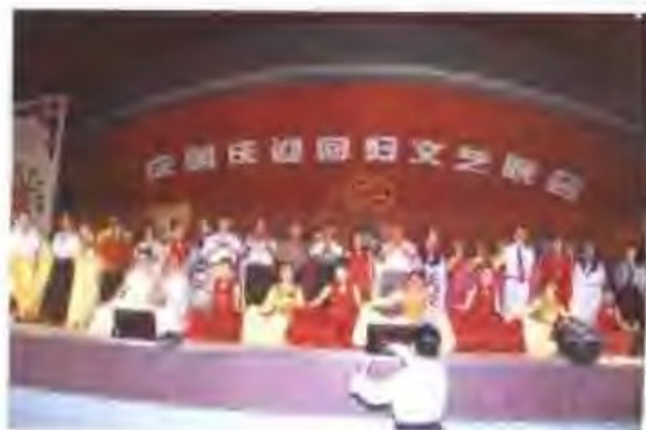
▷ 县交通系统举行庆祝建 国50周年文艺晚会。