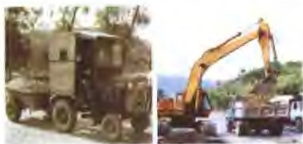
◁ (左图) 过去用拖拉机运载材料, 人力养护公路。(右图) 现在使用汽车、挖掘机等机械养护公路。