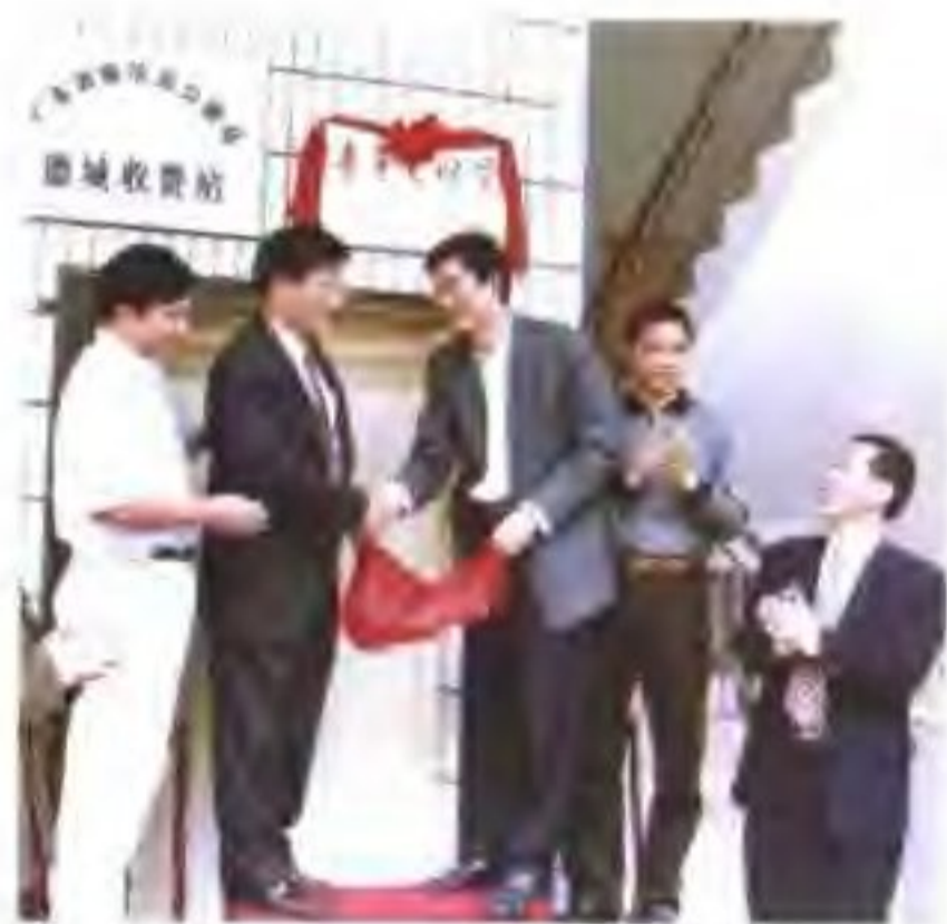
◁ 德城收费站被团省委授予 青年文明号。