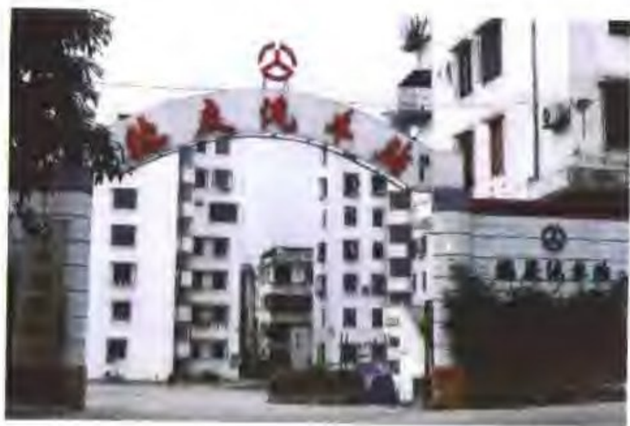
◁ 德庆汽车站。

▷ 昔日德庆港口为我县客货运输发挥了巨大的作用。图为德庆港口客运办公楼原貌，该楼于1997年11月修筑堤路时被拆除。