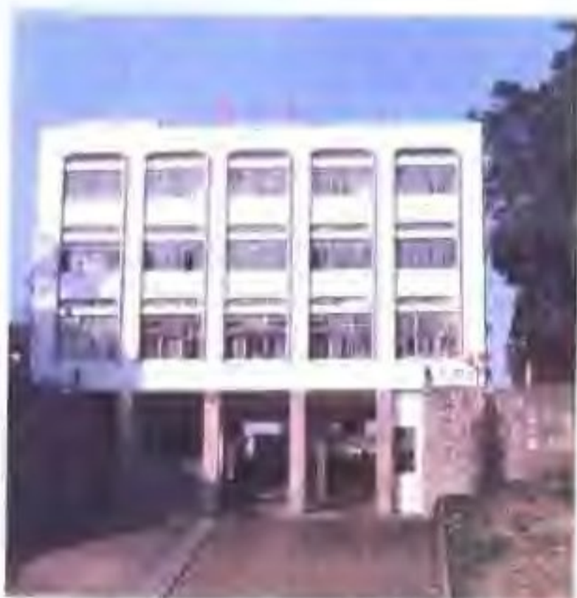
▽ 德庆康州港。

▷ 昔日德庆港口为我县客货运输发挥了巨大的作用。图为德庆港口客运办公楼原貌，该楼于1997年11月修筑堤路时被拆除。