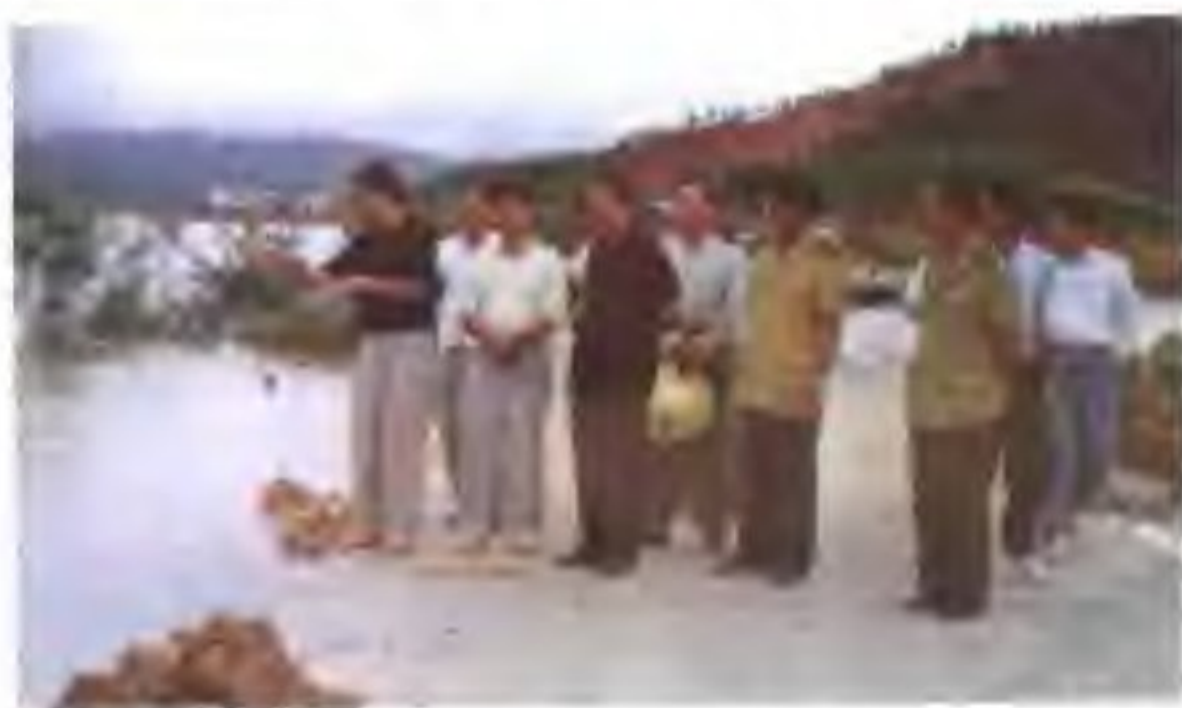
▷ 1998年7月省市公路部门领导到被西江洪水毁坏的国道321线九市三洲段公路调查水毁情况。