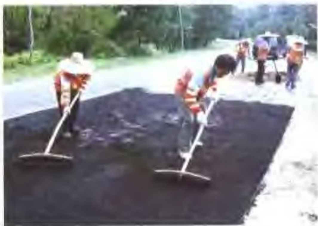
▷ 道班工人养护沥青路面。