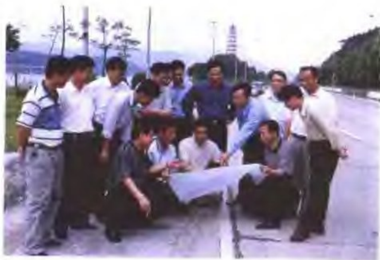
◁ 主管交通公路的县领导与县交 通公路部门领导 现场研究公路交 通建设规划。