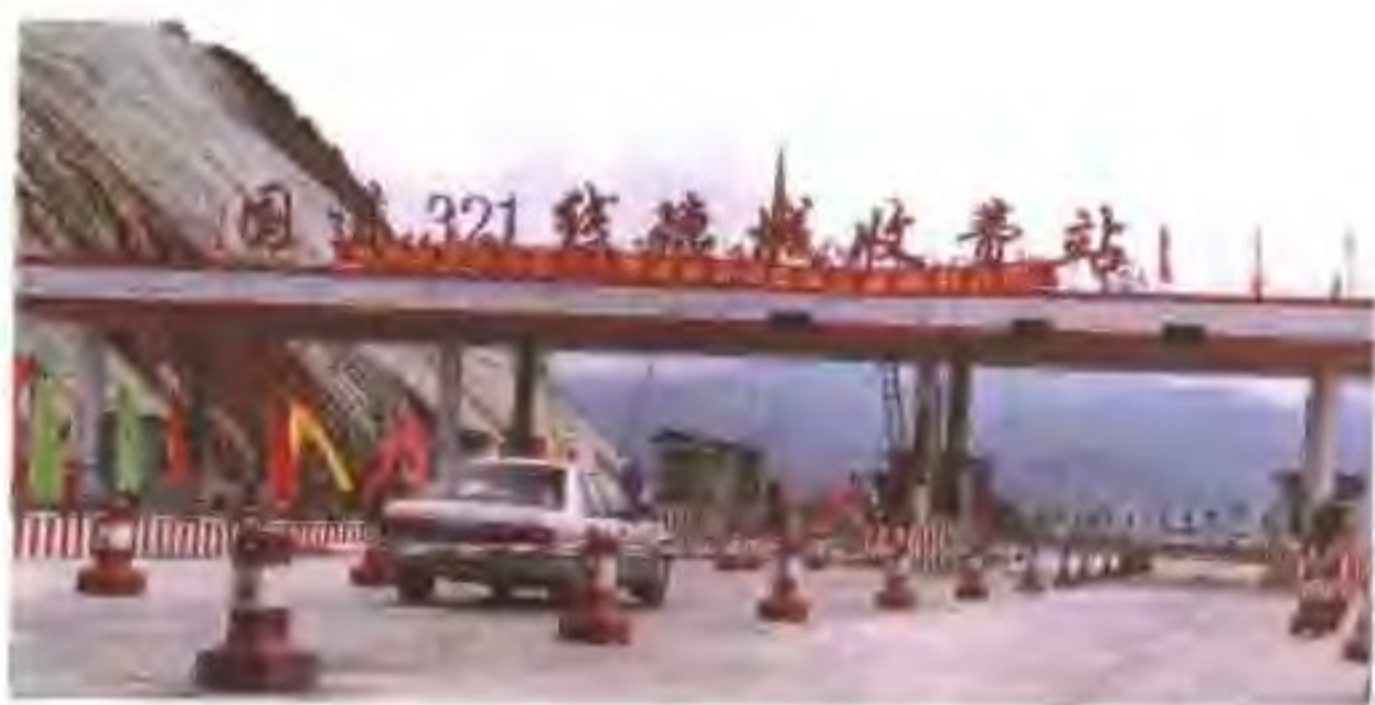
△ 国道321线德城收费站。