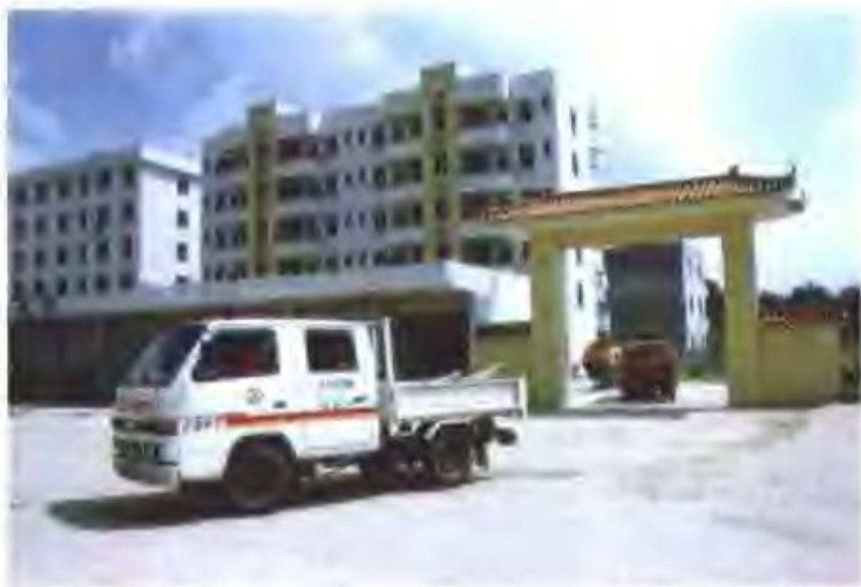
◁ 公路养护道班班房。 (县公路局办公室供图)