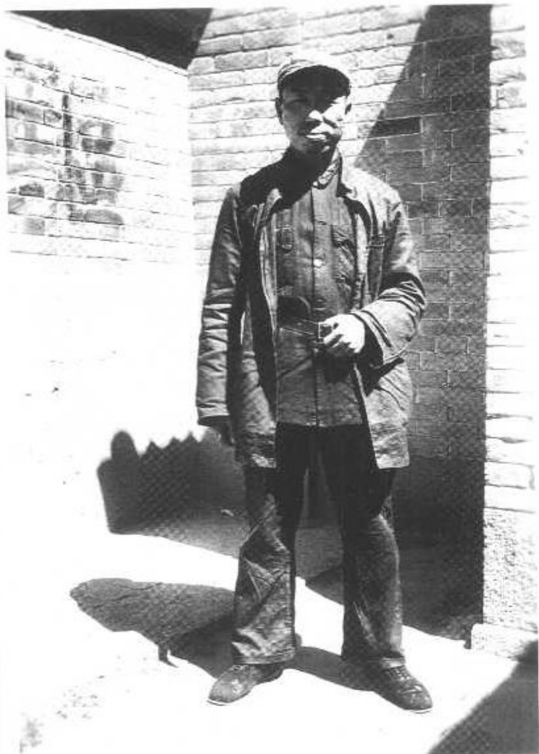
2 成仿吾长征到达陕北。 (1936年)