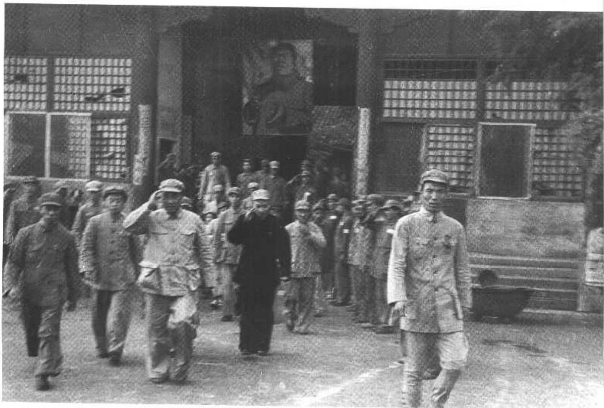
5 成仿吾在华北大学。左起：成仿吾、聂真、朱德、吴玉章。(1949年)