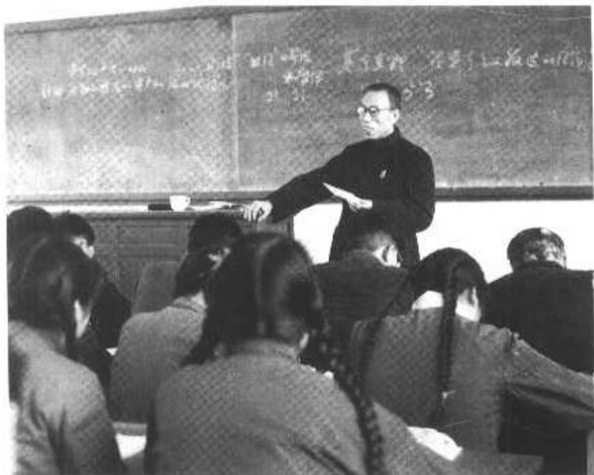
7 成仿吾在山东大学讲《共产党宣言》。(1961年)