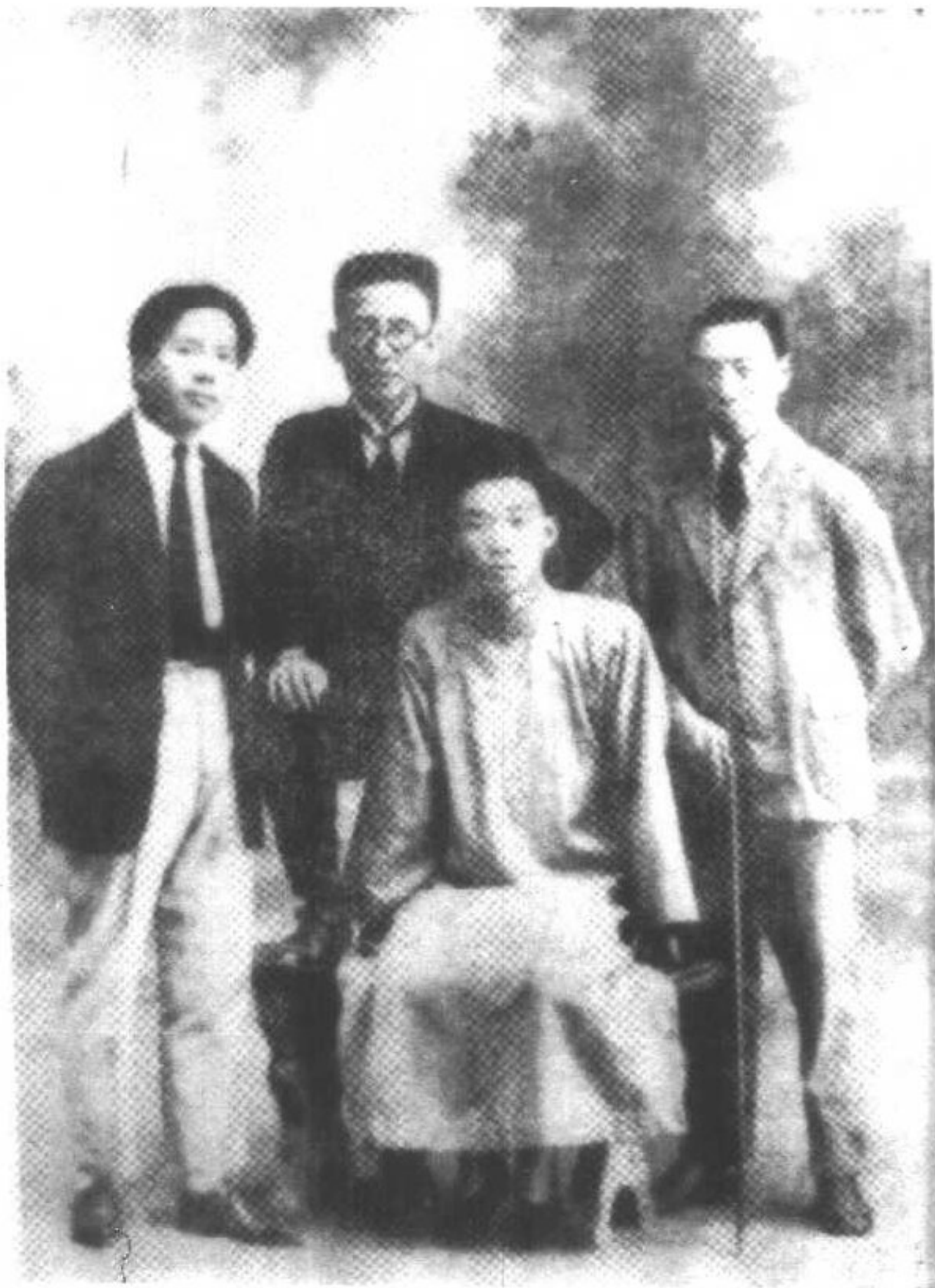
1 成仿吾在创造社时期。右起：成仿吾、郁达夫、郭沫若、王独清。(1926年)