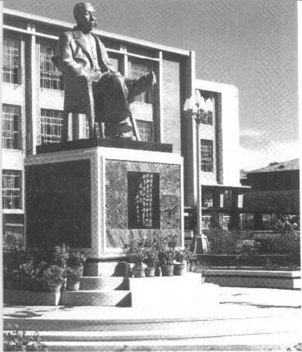
6 成仿吾在东北师大的塑像。 (1986年照)