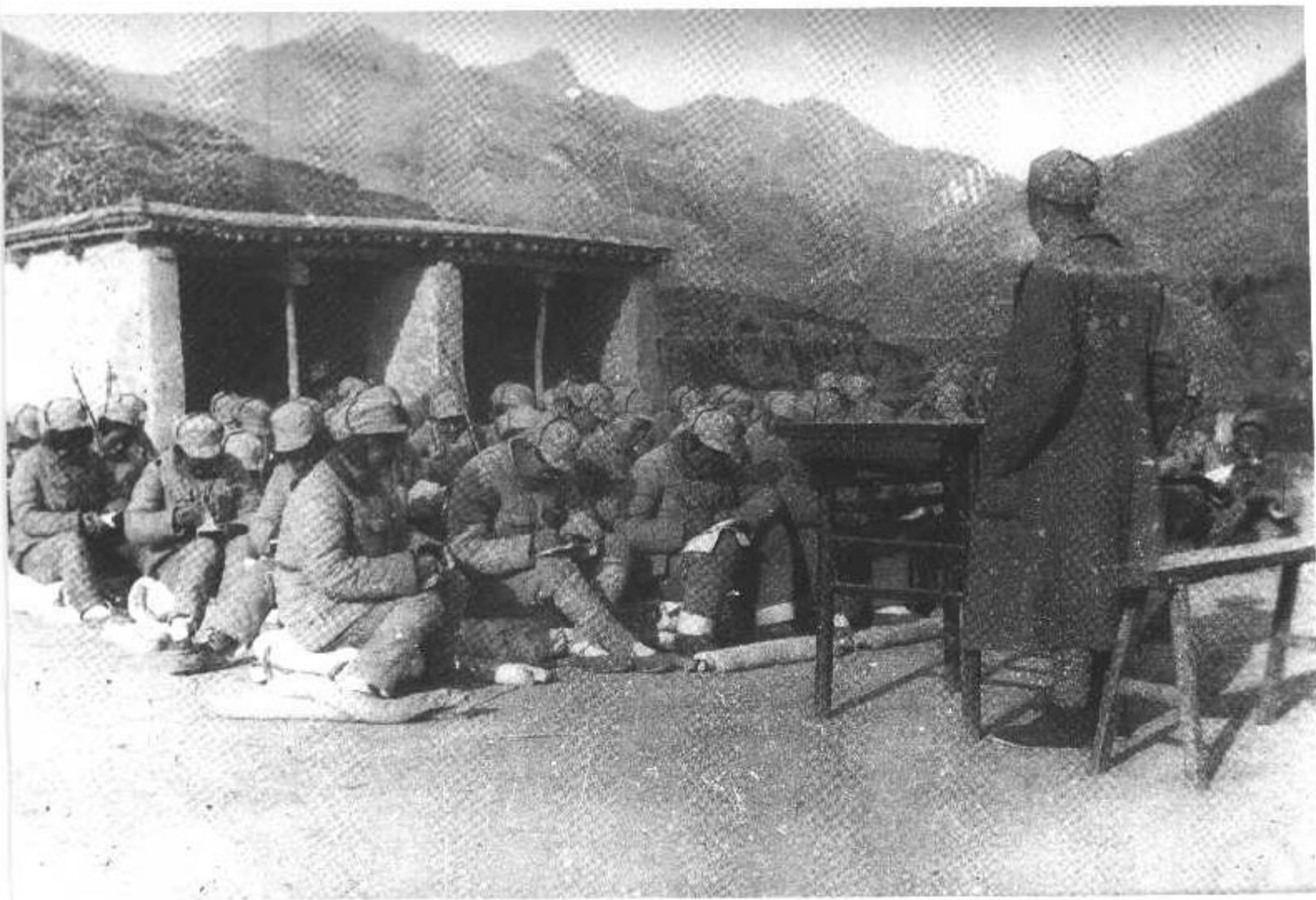
3 成仿吾在陕北公学讲课。 (1937年)