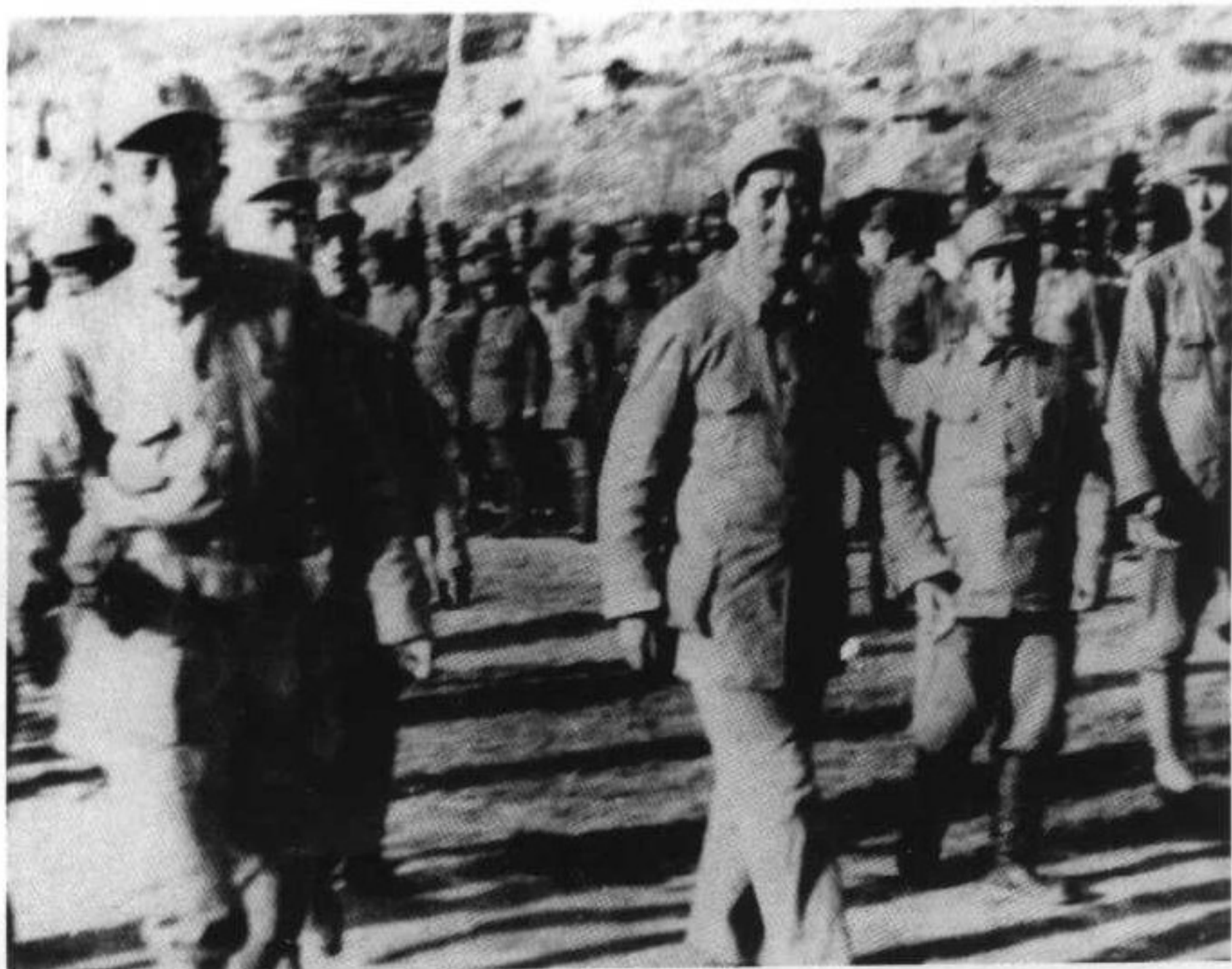
7 1939年6月1日,罗瑞卿陪同毛泽东参加抗大成立三周年纪念大会