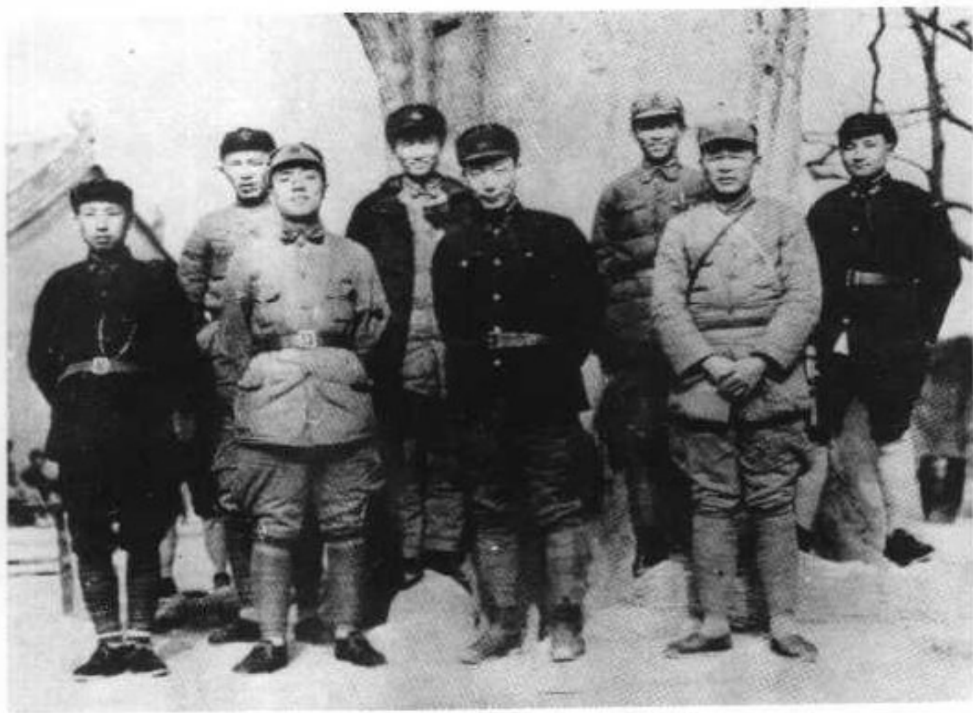
2 红军长征到达陕北后,红一军团、红十五军团部分领导人合影。右起:邓小平、徐海东、陈光、聂荣臻、程子华、杨尚昆、罗瑞卿、王首道