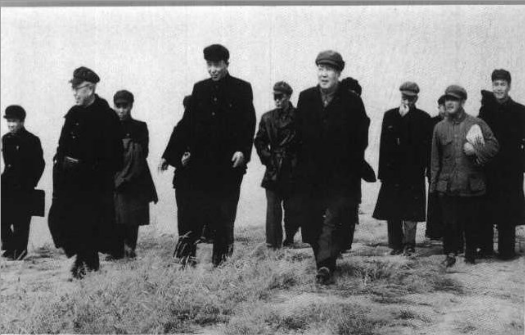
21 罗瑞卿（前 排右二）任 公安部长时 期，陪同毛 泽东外出视 察