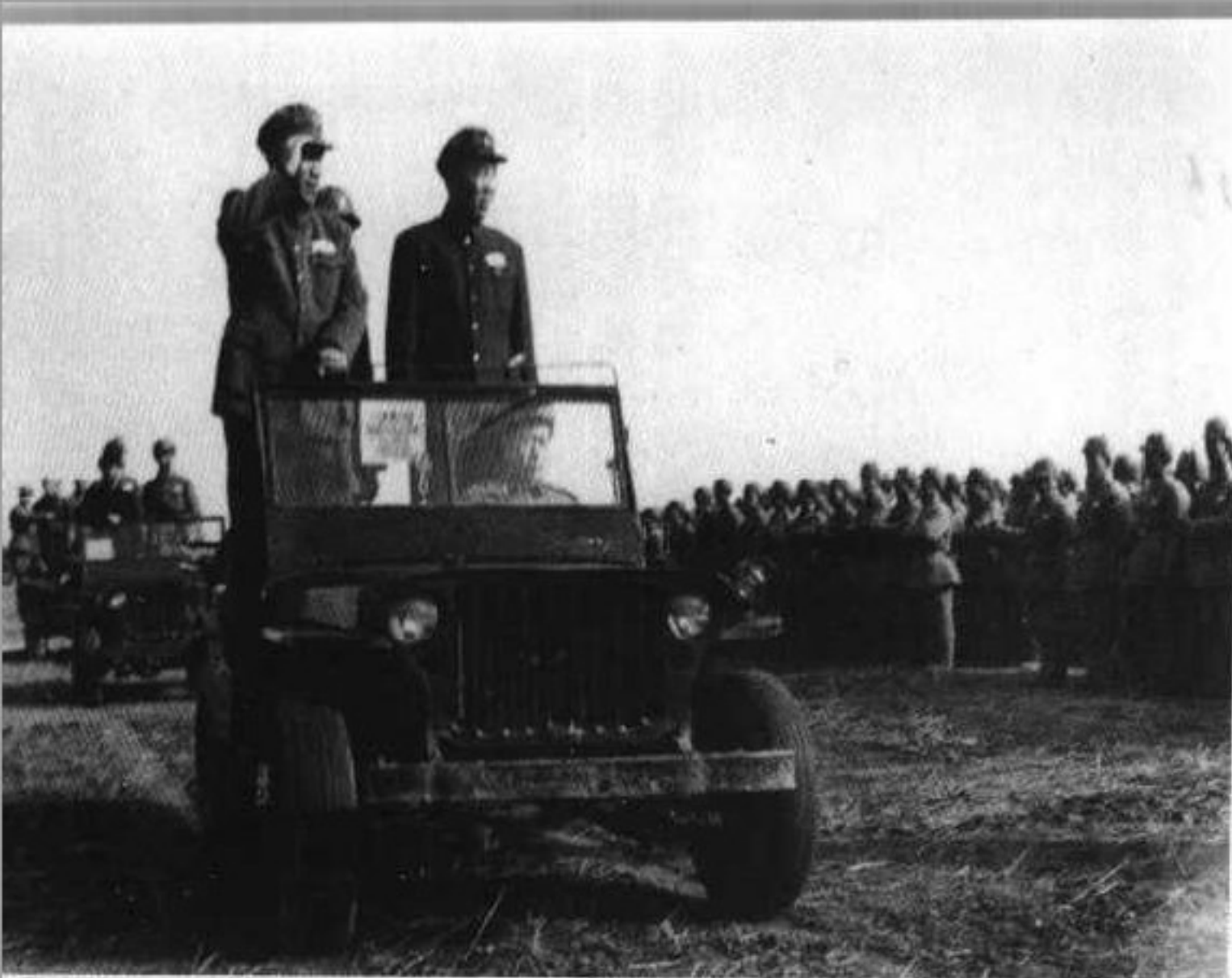
15 1949年，罗瑞卿陪同朱德参加公安中央纵队成立阅兵式