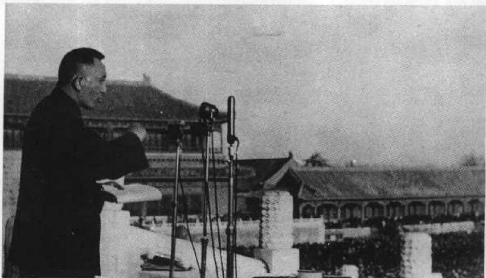
16 1950年10月，罗瑞卿在北京市劳动人民文化宫召开的镇反大会上讲话