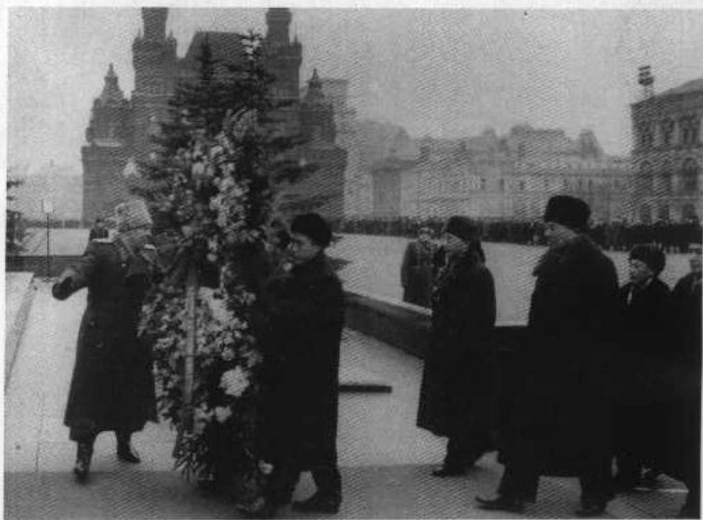
22 1957年12月至1958年1 月，罗瑞卿（前排右一） 与孔原（右二）率公安部 代表团赴苏联访问，向 列宁墓献花圈