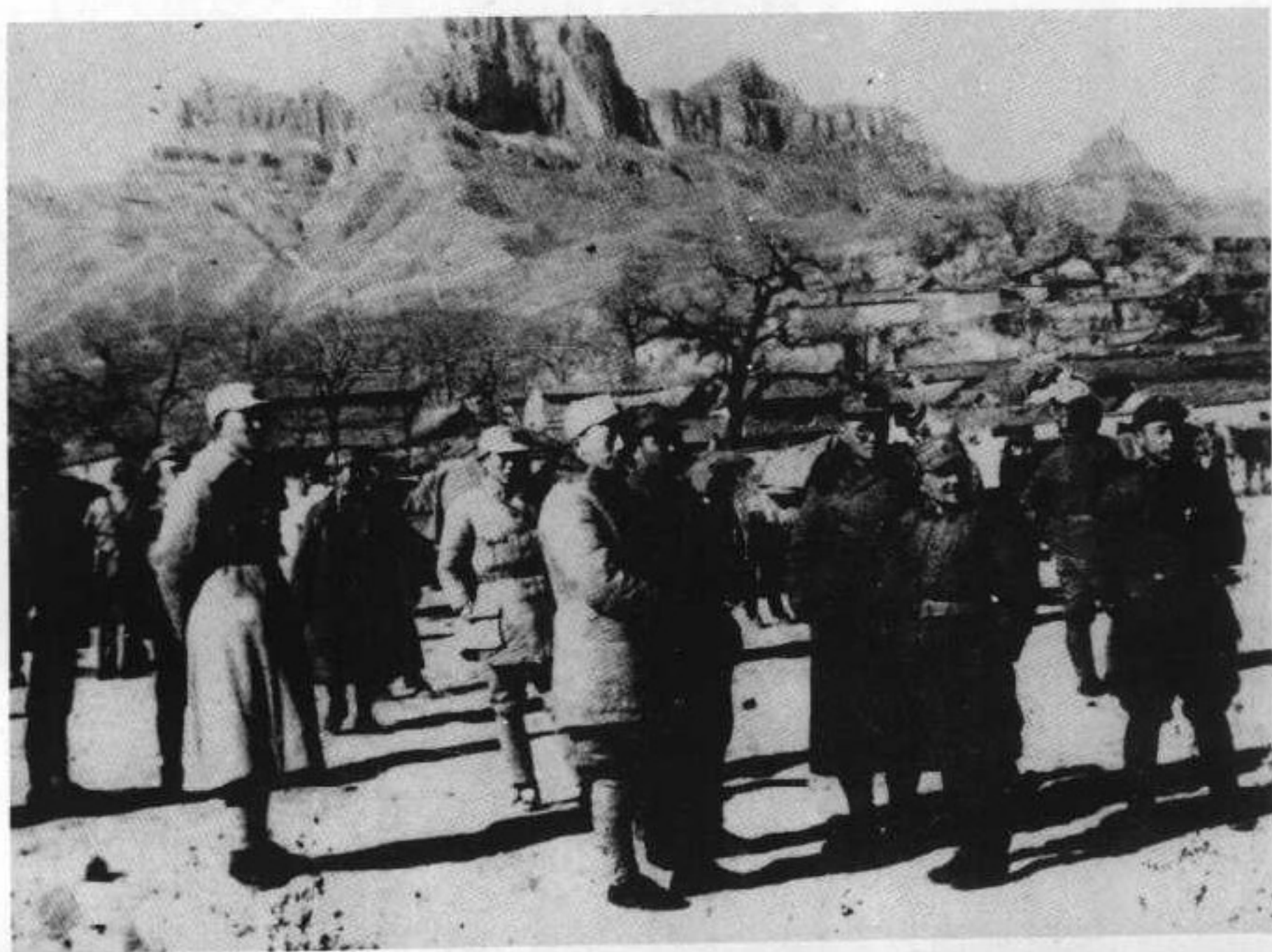
8 1940年春,在太行王家峪合影。左起:罗瑞卿、聂荣臻、朱德、刘伯承、邓小平、林彪