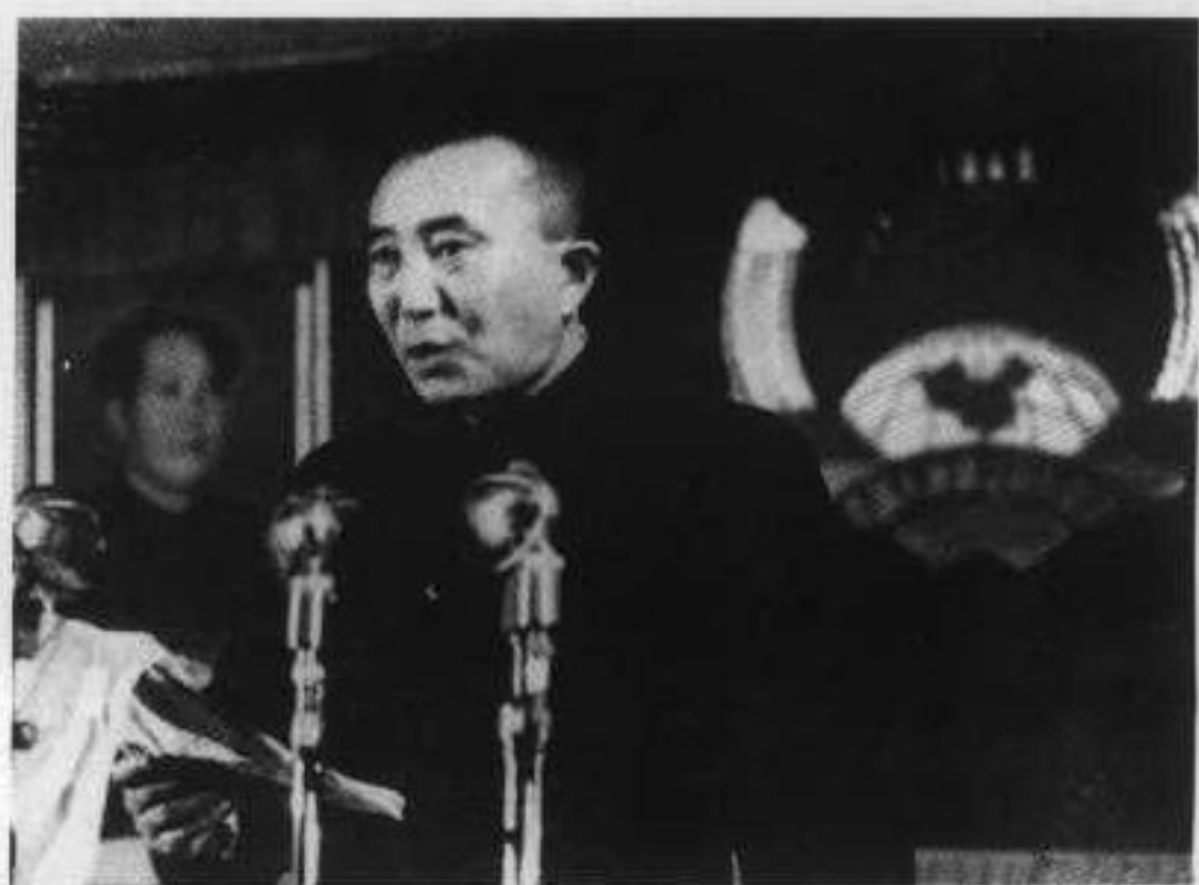
17 1951年9月，罗瑞卿在第四次全国公安工作会议上讲话