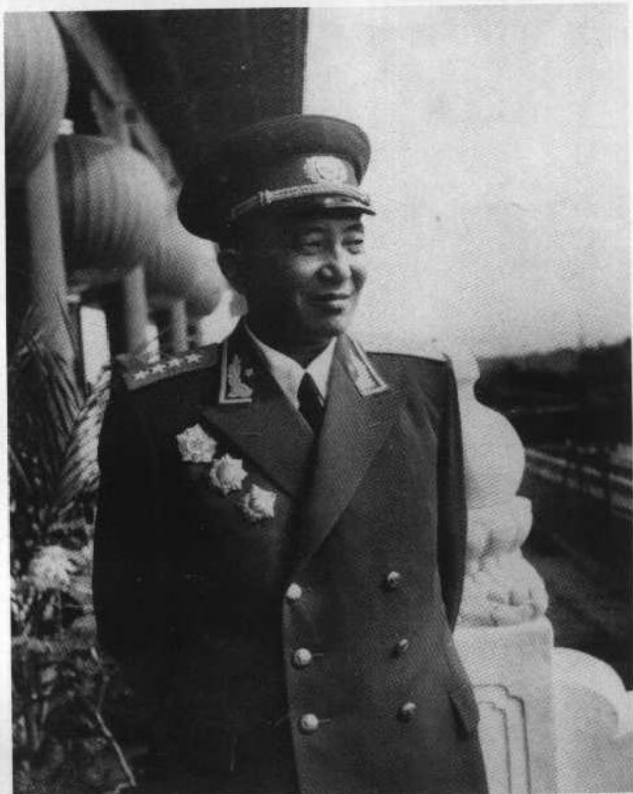
20 1955年国庆节，罗瑞卿在天安门上