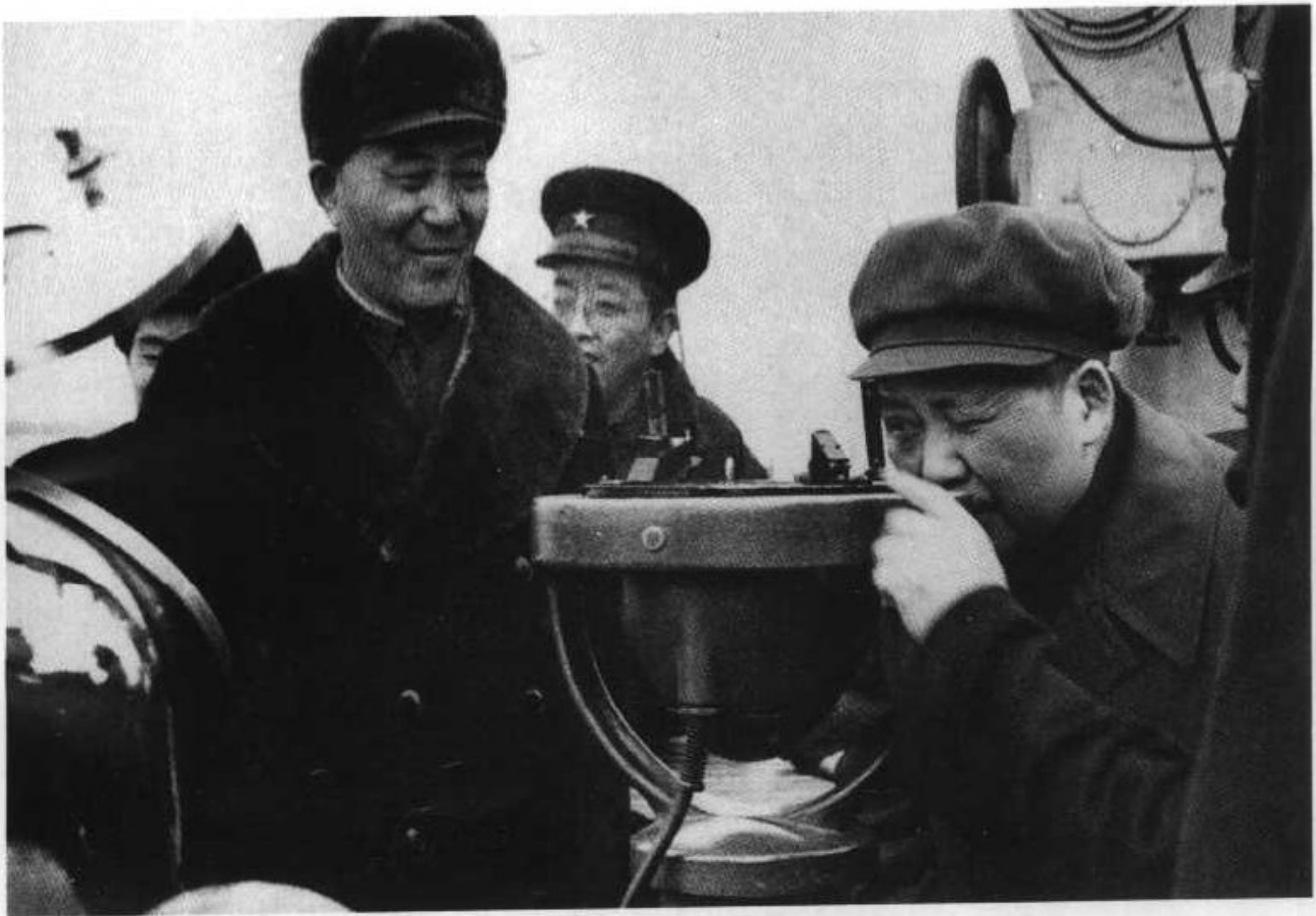
19 1953年，罗瑞卿陪同毛泽东视察《长江》舰