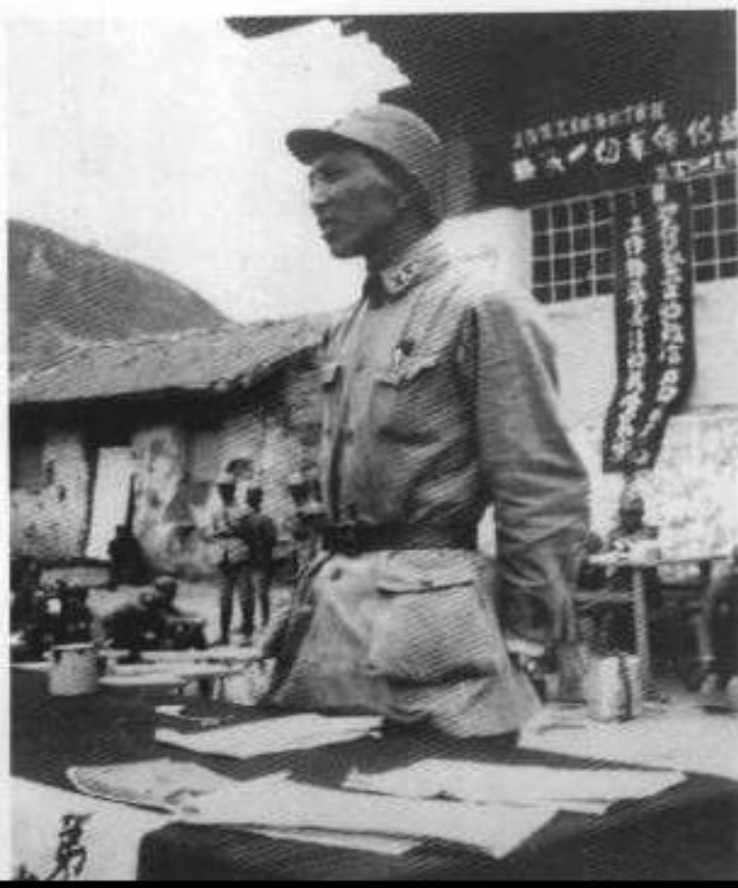
3 1938年春,罗瑞卿在抗大第四期开学典礼上讲话