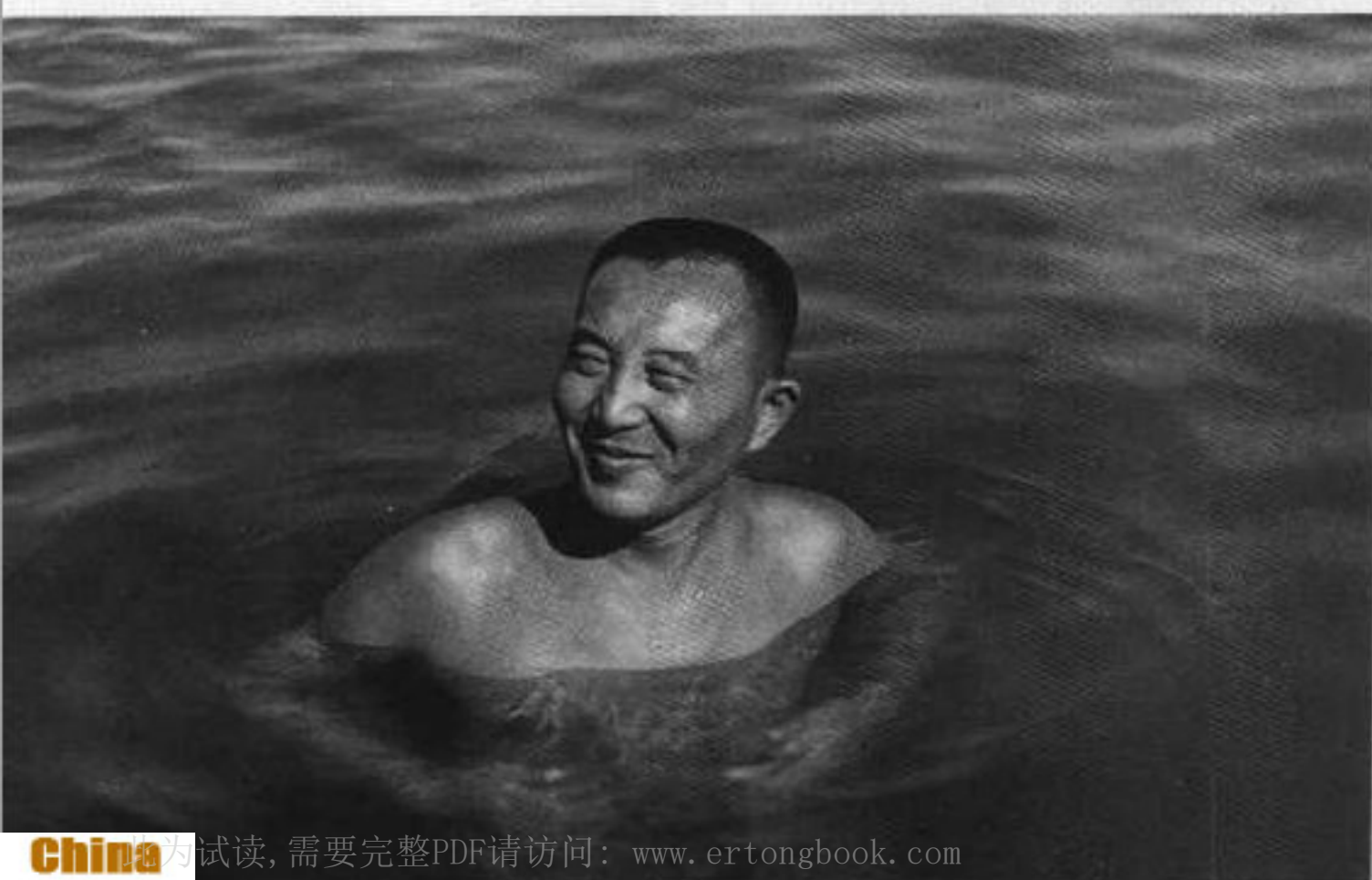
23 50年代，罗瑞卿 学游泳