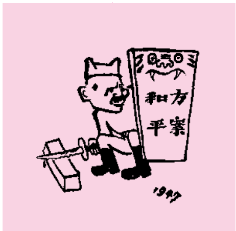
漫画：磨好刀再杀（1947） 漫画：榜样（1945）