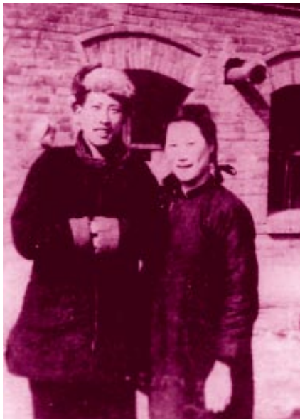
华君武与夫人宋琦