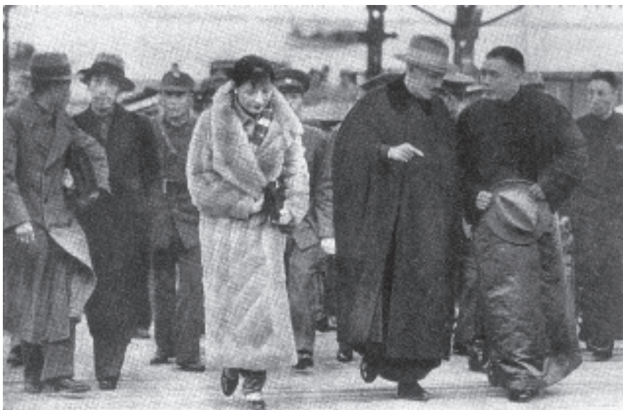
● 蒋介石与宋美龄在西湖

作家、学者、科学家、实业家，占据优势资源的强者和无权无势的弱者，如果在现实生活中没有公平可言，在历史天平上应该可以找到公平。以往的历史书中充满了宏大叙事，我们只能看到血肉横飞的战争、你死我活的权争，一切都以权力宝座、利益最大化为目标，史书的版面总是慷慨地提供给英明神武、能以超级暴力击败所有对手的几个人身上，关注军阀也只是关注他的武力大小，似乎他们在创造历史。一部中国近代史好像就是打打杀杀，主导历史的人物总是军阀、枭雄、造反者，也就是拿枪的人，他们被当成了绝对的主角。拉长历史的镜头，从长程来看，他们的厮杀、权谋，他们的翻手云、覆手雨，王朝的更迭，流血和不流血的政变，铺天盖地的大规模风暴，“一将功成万骨枯”的壮阔战场，一浪接一浪的动荡，张献忠式的无情杀戮、“嘉定三屠”、“扬州十日”、南京大屠杀……这一切固然都要载入史册，但这些历史记录，作为事实发生了，这是历史的偶然性与必然性的汇合，是历史三峡中的急流险滩，更多的只是提供历史的背景。这些历史本身并没有意义。