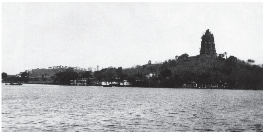
●雷峰塔倒塌前的西湖

明史的视野中，在增量历史观下，我注视的是生前并无显赫权势的龚自珍、胡适、竺可桢，一笔在手的邵飘萍、史量才……正是他们才把一个老大民族带入了近代文明社会。他们才是真正推动历史的人。一部通向希望之门的近代中国史，实际上是他们书写的。