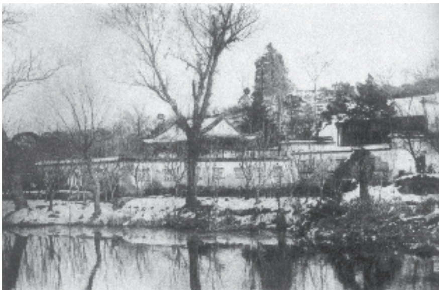
● 西湖雷峰塔下秋瑾等革命党人出没的白云庵

而是在千百万个人的努力中生长出来的。文明是常人（而不是救世主、超人）一点一滴创造出来的，文明进程是靠更多的常人推进的，文明是一种制度，也是一种生活，文明之路就是人类免于恐惧、通向自由的道路。一部文明史是由一代代的伏尔泰和他的读者们一起书写的，而不是路易十六书写的。从这个角度重新认识中国近代史，我总是想起“种瓜得瓜，种豆得豆”“要这么收获，先那么栽”这些谚语和格言。