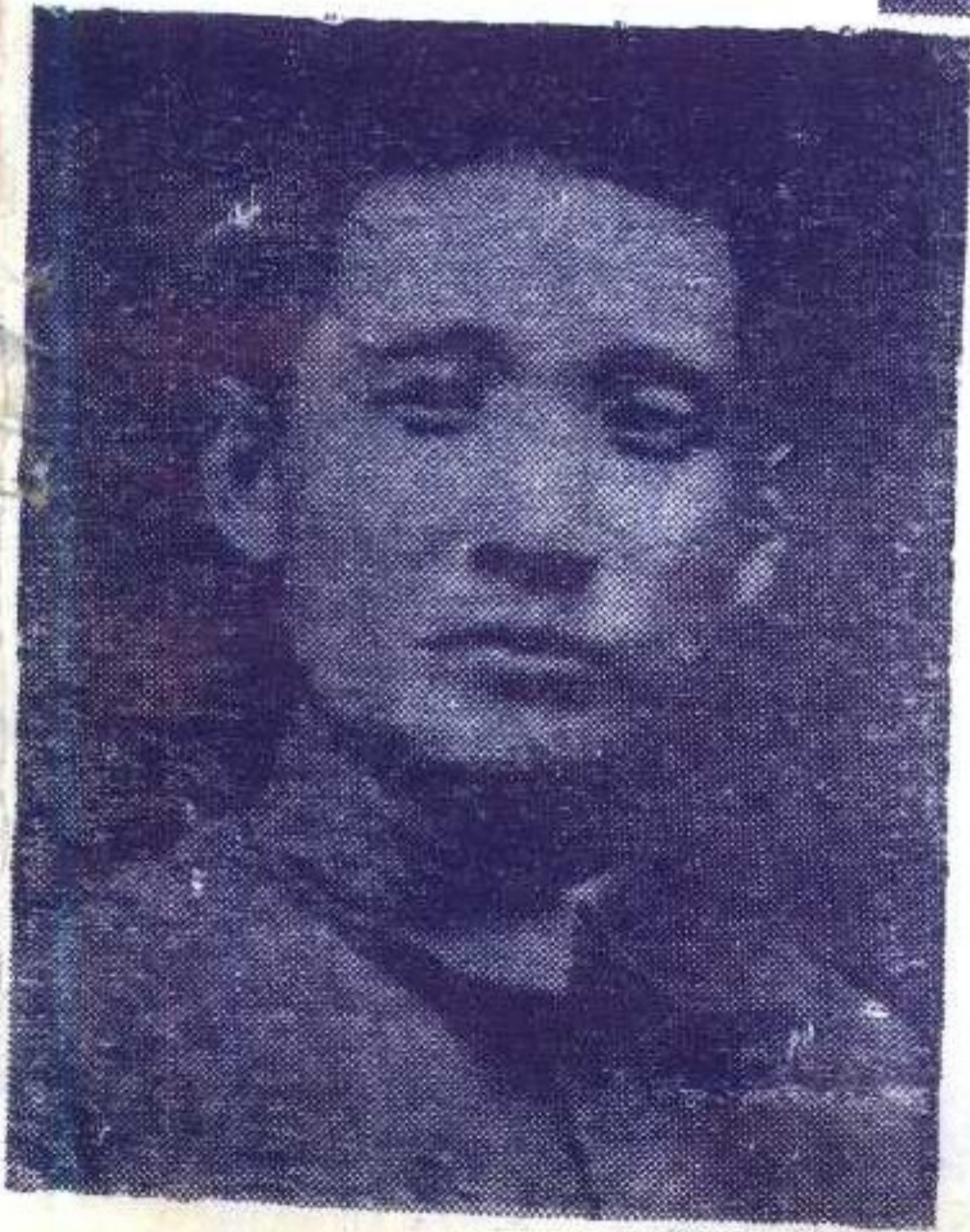
图②张治中在1932年一二八抗日战争时留影。