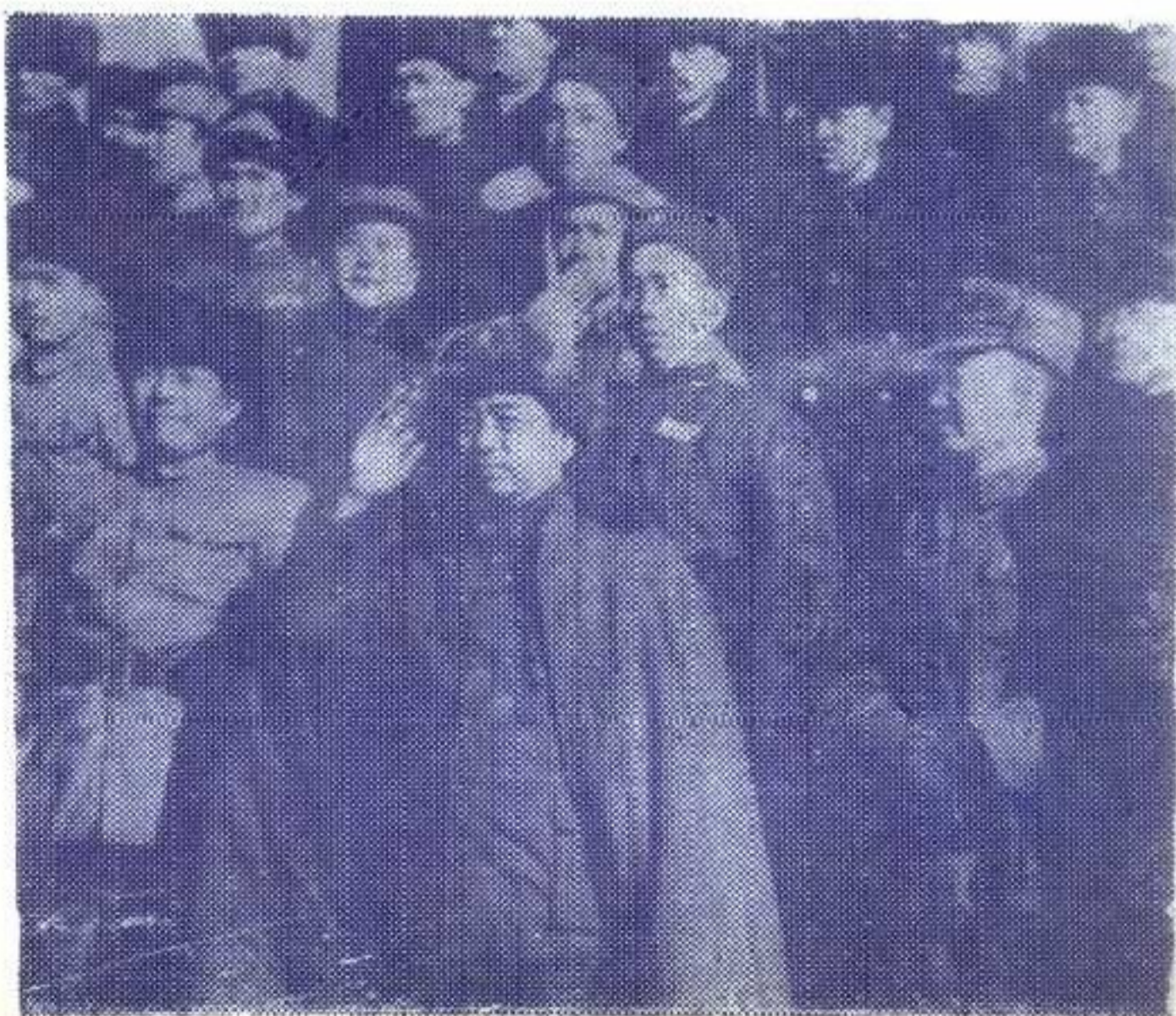
图⑥1949年11月张治中和彭总、王震同志在迪化阅兵台上。