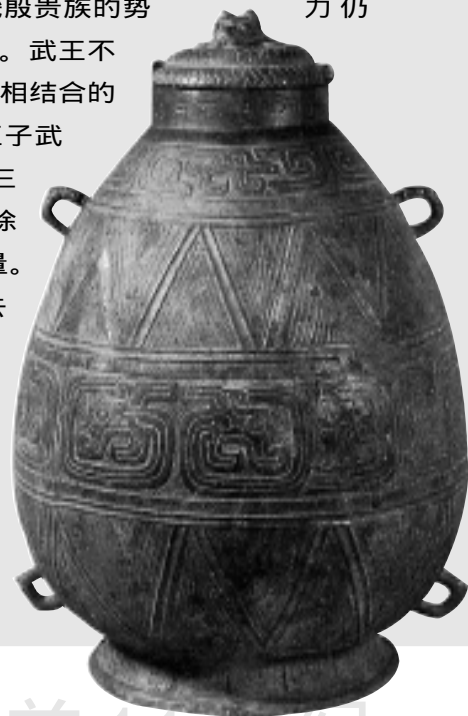
侯母壶 高39厘米，为西周晚期器物

殷的直属领地已经缩小很多，而四周的夷狄部族和方国势力一时大有扩展，使得殷减弱了力量，这也是殷灭亡的原因之一。周克殷后，新建的周朝继承了这个局面。同时，周以“小国”攻克殷的“大邦”，一下子不容易控制“大邦”的局势，加上周的克殷，在京畿一战而胜，原来京畿殷贵族的势力仍保持着，而且根深蒂固。武王不得已而采用安抚和监督相结合的政策，继续分封殷的王子武庚为属国，并设置“三监”，但如此并无法消除殷贵族的顽强抵抗力量。武王克殷之后二年便去世，所谓“天下未宁而崩”，而成王年幼，三监、东夷联合起来发动叛乱，确实造成了周的动荡艰难的局面。经过周公三年东征，才使艰难局面转危为