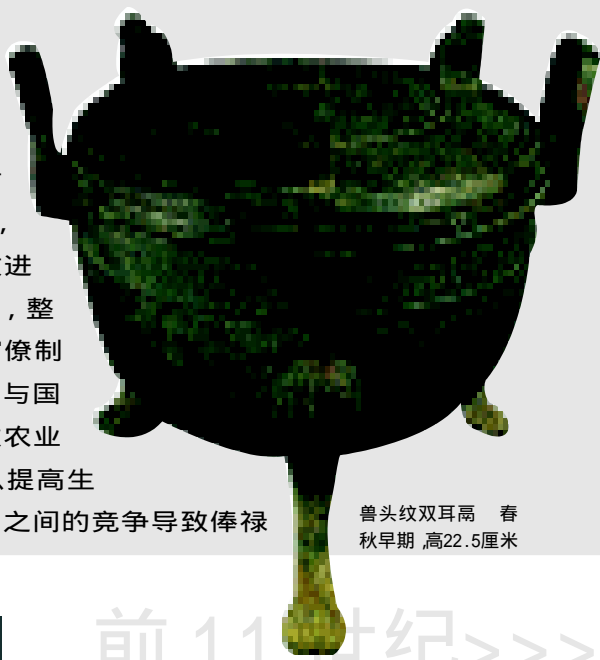
兽头纹双耳鬲 春秋早期，高22.5厘米

战争是催化剂，战争的双方为了击败对方，开始有意识地改进各自的管理制度，整合各种资源，官僚制度由此产生。国与国之间的竞争导致农业技术的改进，以提高生产效率；国与国之间的竞争导致俸禄