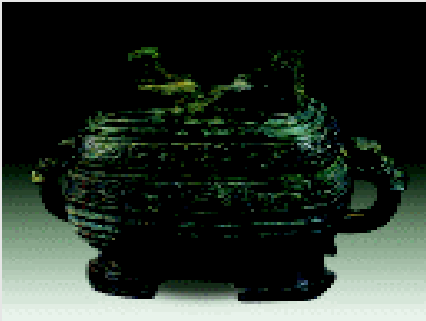
西周晚期的伯父盃 高21.5厘米。盃和簋一样，均为祭祀和宴享时盛放稻、粱、黍等饭食的用具

丈夫送行，祝愿永远的幸福，也可以说是希望丈夫能够活着回来。铭文蕴含着深深的祝福和憧憬，标志着周代社会出现了理智和人性的光辉。