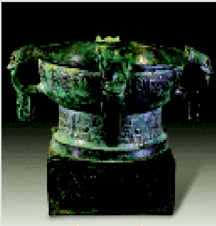
西周早期的鄂叔簋 高 18.5 厘米