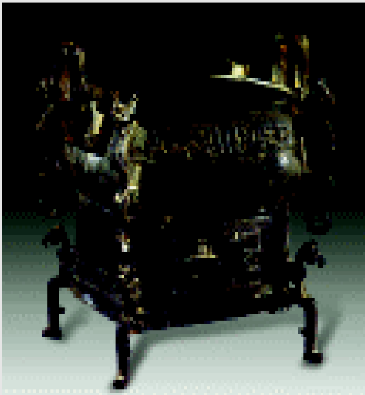
西周中期的别人守门方鼎 1976年陕西扶风县庄白村出土

分封的诸侯，有两种，一种是先代是功臣之后，另一种是亲属。至于对待敌对的殷贵族，虽然也有给封地的，但情况完全不同。当时，原商朝王畿以内，殷贵族的势力还很强大，特别是殷贵族的基层，士一级人数众多，很难统治。武王对此采用一面加以安抚、笼络，一面加强监督控制的方法。加强监督控制就是设置三监，三监分别是纣王之子武庚，以及武王的两个弟弟管叔和蔡叔。设置三监的目的在于把新征服的商朝王畿分割开，以便对原来有统治势力的殷贵族加以安抚和监督，进而消除他们的顽强反抗。事实上，这个办法并没有取得预期的效果。