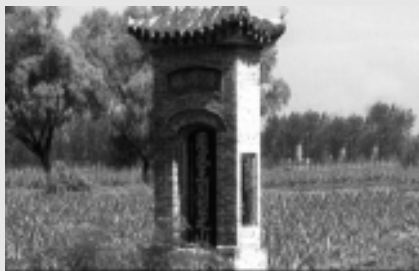
河南新乡周武王同盟之山碑