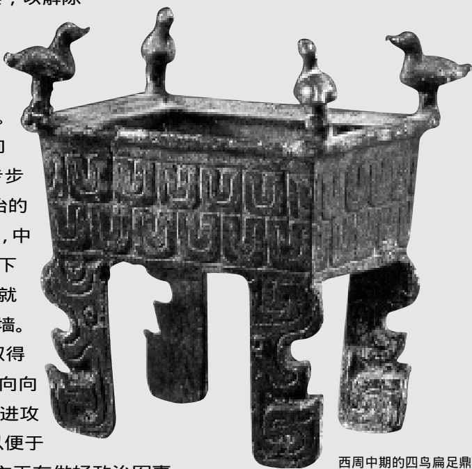
西周中期的四鸟扁足鼎 高12.8厘米，1978年陕西扶风齐家村出土

武王即位后第四年，经过对自己队伍的充分演练和准备后，恰逢殷贵族内部因为纣王的淫暴而分崩离析。武王认为伐商的时机已到，亲率战车三百乘，勇猛的虎贲三千人，以及普通甲士四万五千人向东讨伐殷纣王，在牧野一日之内击溃殷的守军，攻占朝歌。殷纣王在鹿台自焚，殷朝政权土崩瓦解，然后，武王分兵多路，瓦解殷朝驻屯别处的守军和其所属藩国的抵抗。