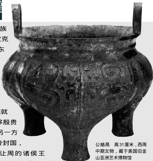
公姑高 高31厘米，西周中期文物，藏于美国旧金山亚洲艺术博物馆

周公东征胜利后，为了防止殷贵族势力的再次叛乱，决定改变对殷贵族就地监督的办法，开始大规模地强迫迁移殷贵族。一方面把殷贵族集中迁移到洛邑；另一方面，就是分批分配给主要的周贵族的分封国，