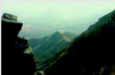
河南淇县牧野古战场