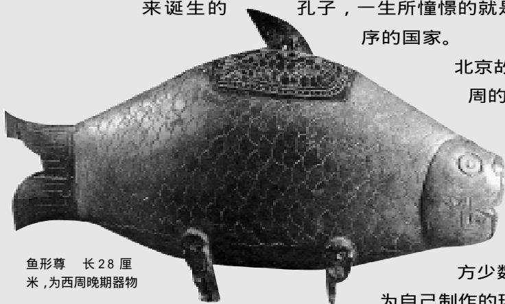
鱼形尊 长28厘米，为西周晚期器物

北京故宫博物院收藏的“世父钟”是西周的青铜乐器，由8只22件大小不同的钟组成的乐器叫做编钟。由编钟演奏的音乐不只是为了娱乐，在祭神和祭祖等重要的仪式中也是不可缺少的。“宗周钟”是西周末期为了纪念周厉王平定南方少数民族入侵而制作的，它也是周王为自己制作的现存极为稀少的青铜器之一。在周