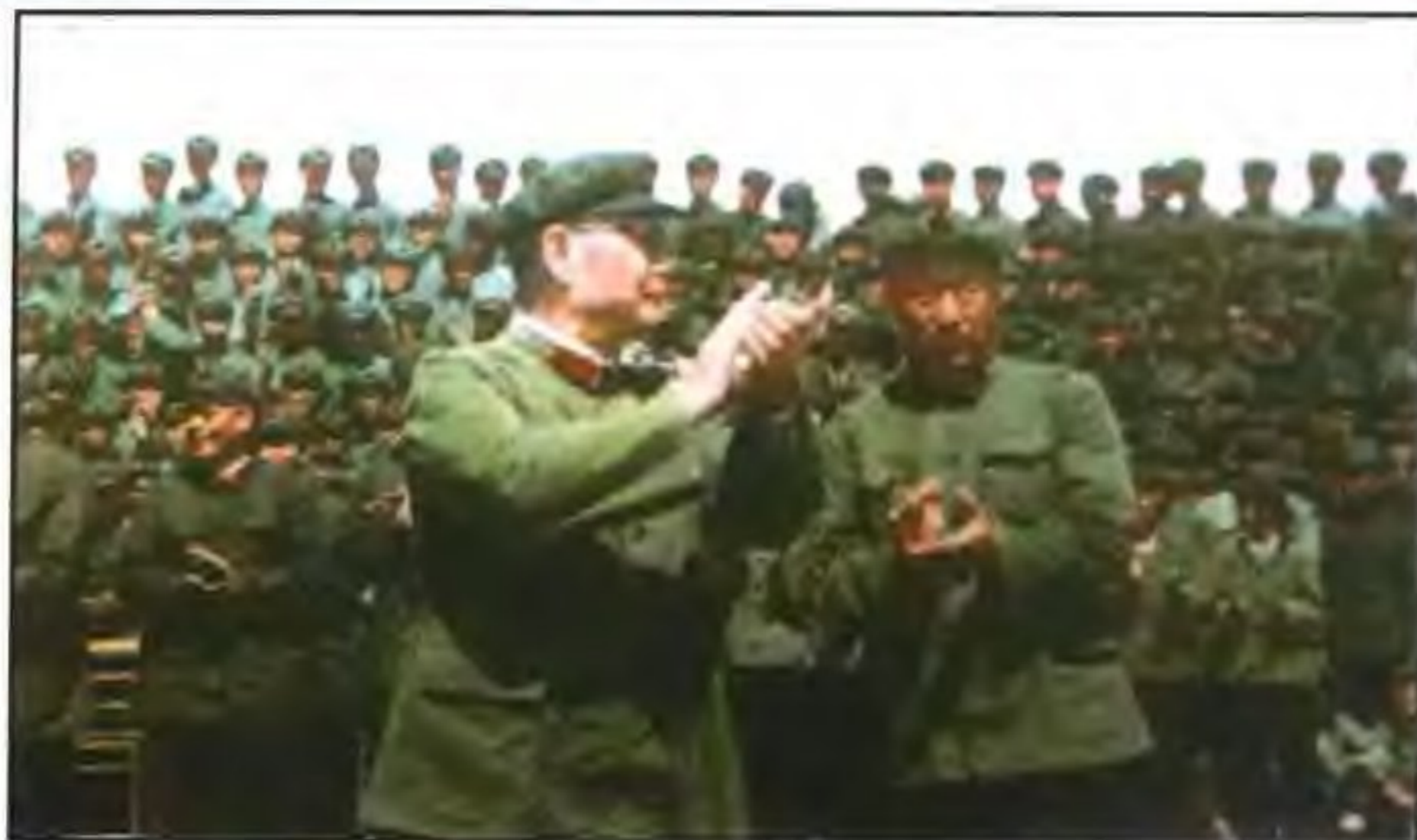
叶剑英元帅来陕视察 (1965年)