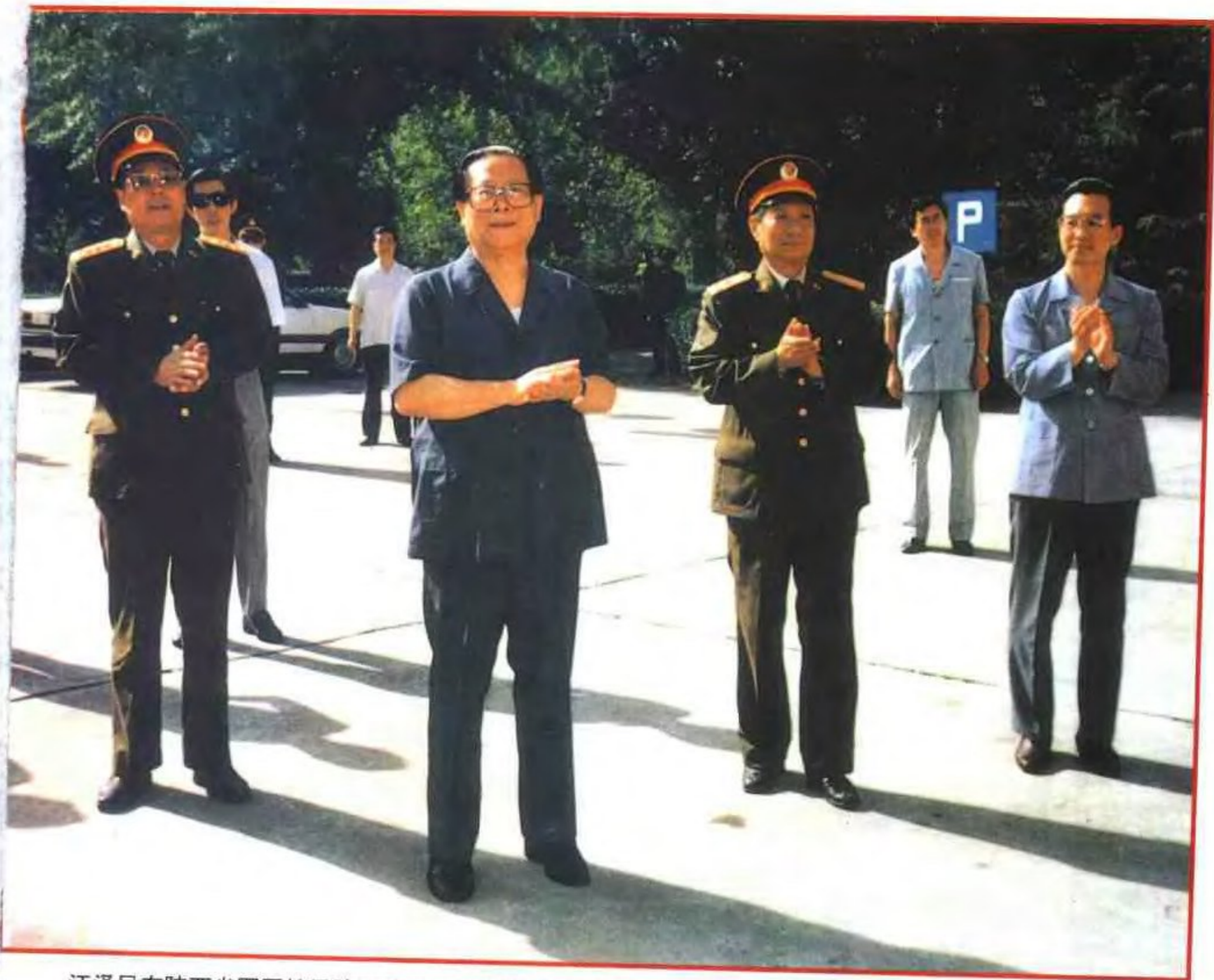
江泽民在陕西省军区接见陕西驻军单位领导(1993年)