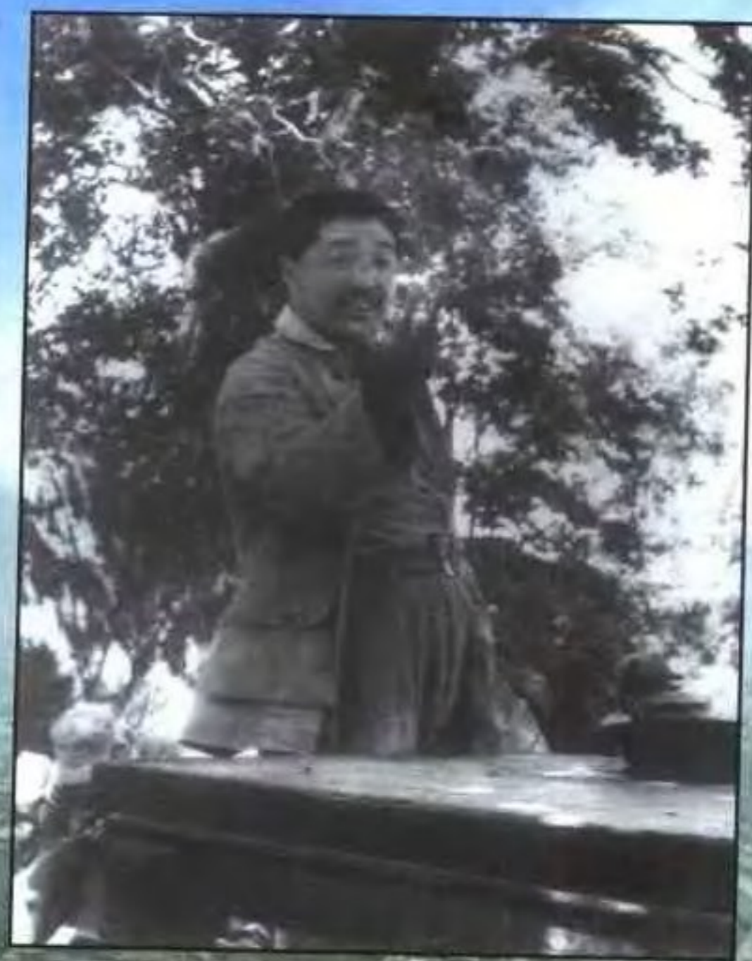
贺龙在新式整军运动中作报告（1947年）