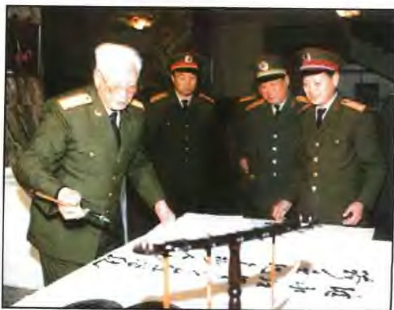
军委副主席张震来陕视察时 为武警技术学院题词