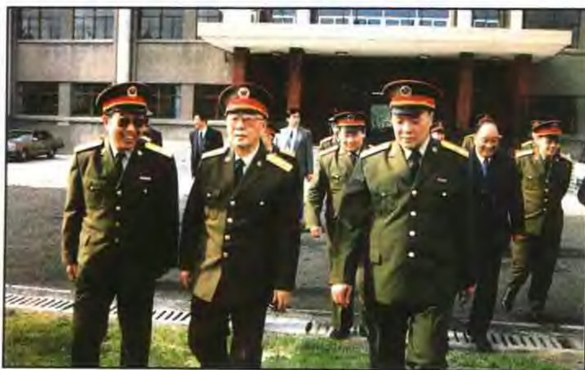
军委副主席 刘华清来陕视察