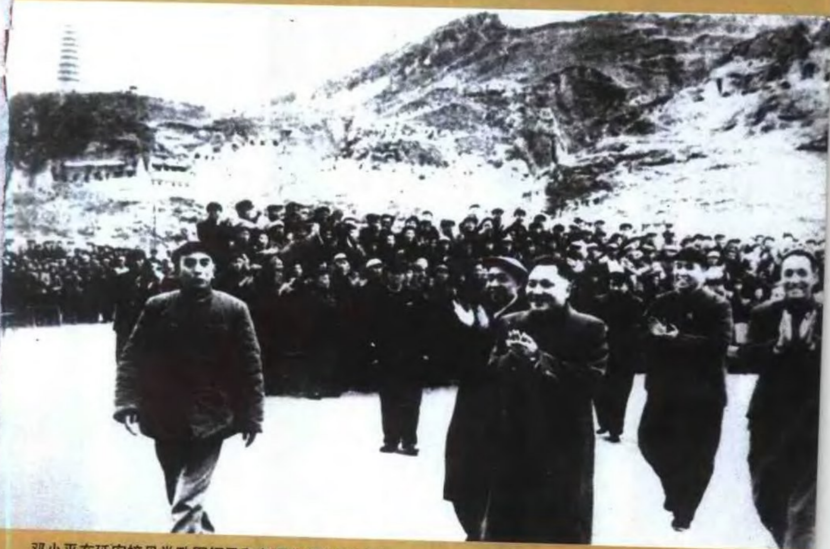
邓小平在延安接见党政军领导和各届代表(1966年)