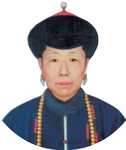
孝圣宪皇后半身像

雍正是清朝皇帝中最富神秘色彩的一位。他的登基，他的死亡，都已成为难解的奇谜。就连乾隆帝到底是不是他生、抑或是他与谁所生至今仍众说纷纭。