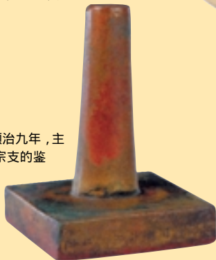
宗人府左司印印文

清廷宗人府，设置于清顺治九年，主管皇族事务，诸如皇族宗支的鉴别、玉牒，宗室人员的管理，户口田产等均属其责。设宗令一人由亲王或郡王选充。