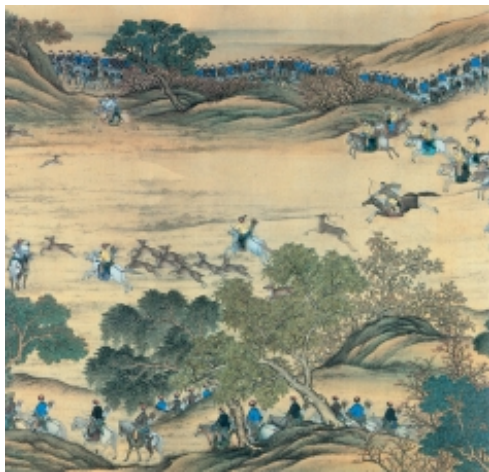
合围 清 选自《木兰图卷》

满清王朝以骑射立国，特别重视对士卒的训练及演习。为此，康熙帝在承德特辟木兰围场。每到秋天，皇帝亲率皇子贵族八旗劲旅举行“木兰秋狝”，以保持满洲勇武之风。