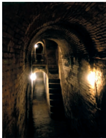
▶ 位于亳州城区的曹操地下运兵道

曹操为了保证长期控制大量军队，使兵士来源固定，建立了“世兵”制，按照规定士家以当兵为终生职业，有单独的户籍，父子相袭世代为兵，不许改业。为避免兵民混杂，禁止士家与一般民户通婚，婚姻只能在士家之间进行，士逃亡要罪及妻子。士家身份大大低于平民，是依附性加强在士兵身上的反映。