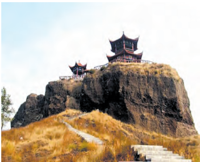
▲ 河北秦皇岛碣石山

乌桓是我国北方的一个少数民族，东汉末年逐渐强大起来。袁绍灭公孙瓒后，曾以汉献帝的名义封乌桓王为乌桓单于，企图利用乌桓势力抗拒曹操。曹操为了彻底消灭袁氏残余统一北方，于公元 207 年亲征乌桓，斩乌桓单于，降其兵二十余万。在凯旋归师的途中，曹操过碣石山（河北秦皇岛附近），写下了《观沧海》一诗，以抒发自己建立统一大业的雄心壮志。