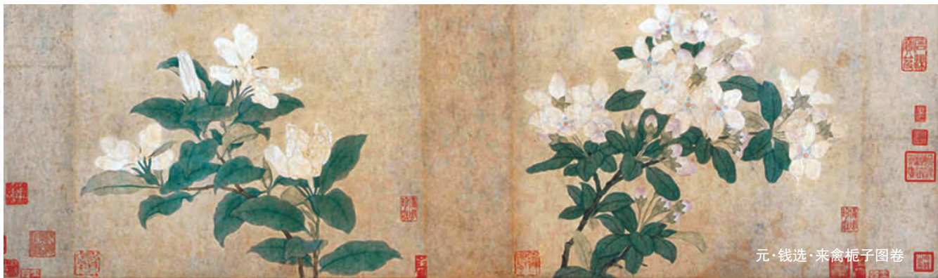
元·钱选·来禽栀子图卷