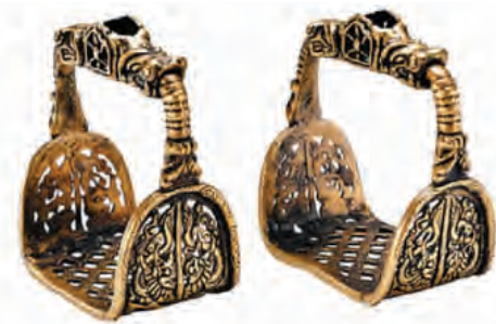
▲ 元·皇室御用鎏金镂空雕龙纹铁马蹬

蒙古文作为全蒙古族的文字。这对于蒙古文化的发展和政令的推行,都起到了一定的作用。