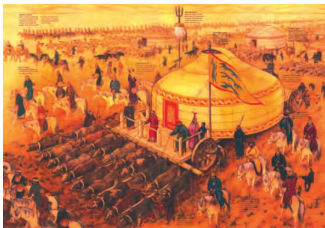
▲成吉思汗率领大军西征场面

蒙古政权是一个军事奴隶制政权，同时还带有氏族社会末期的一些残余，因而它特别富于掠夺性，邻人的财富刺激了蒙古贵族的掠夺欲望，战争掠夺成了他们的“经常职业”。成吉思汗和他的后继者，凭借自己的优势兵力，驱使蒙古人民发动了三次大规模西征。1219~1224年间，成吉思汗招降了畏兀儿人，灭亡了中亚细亚的花刺子模，并越过高加索山，侵占黑海沿岸的钦差部地区，打败俄罗斯封建主的联军，一直攻到克里米亚半岛。1235~1242年间，窝阔台大汗派拔都继续向西方用兵，进入俄罗斯，攻陷莫斯科、基辅等城，占领整个俄罗斯境。蒙古兵更向西攻入波兰、马札尔(今匈牙利)，前锋直达意大利的威尼斯，由于受到捷克人的抗击，才停止西进。1252~1259年间，蒙哥大汗令旭烈兀