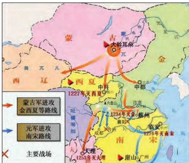
▲蒙古族的崛起和元朝的建立形势图

蒙古族，是一个历史悠久的民族，唐代称为蒙兀，是室韦的一支，也称“蒙兀室韦”。他们最初聚居在额尔古纳河流域，唐中期以后，逐渐向西迁移，居住在今以乌兰巴托为中心的地区。辽、金时期，他们处在辽、金统治者的控制之下。蒙古族分为好多部落，蒙古部是其中的一个部落，另外较大的部落还有克烈部、乃蛮部、蔑儿乞部、塔塔儿部、汪古部、斡亦剌部等。12世纪中期以后，为了争夺领地、掠夺人口和牲畜，蒙古部和其它部落之间争战不已。最终，蒙古族杰出的首领成吉思汗，适应历史的发展，完成了统一大业。