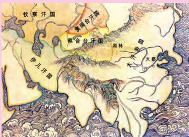
▲大汗(蒙元)帝国与四大汗国分布图