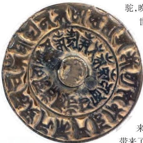
▲元·褐色印度文铜镜