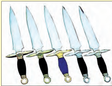
▲ 蒙古骑兵常用的短刃兵器——蒙古剑

了第一次大规模的进攻,1216 年结束第一阶段的战争。在这一阶段,蒙古兵进入长城,占领了河北、山西、山东以及辽东地区,大河以北