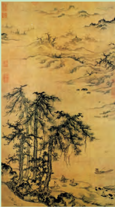
▲元·朱德润·林下鸣琴图

化、掠夺、剿杀灭丁的政策，更加剧了蒙古族内部的斗争和混乱。因此，到12世纪末期，蒙古地区便陷入了“天下扰扰，相互攻伐，人不安生”的局面。这种局面，使蒙古族四分五裂，筋疲力尽，经济发展受到严重的破坏。