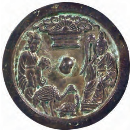
▲元·褐色仕女图铜镜

在金和南宋对峙的时期，我国北方兴起了一支强悍的少数民族——蒙古族。蒙古族在唐朝时叫“蒙兀室韦”，是室韦的一支。他们最初居住在额尔古纳河东部，后来进入到蒙古高原的广大地区。蒙古族有许多部落，多数过着游牧生活。白天在草原上放牧羊、牛、马、骆驼，晚上住在用毡子搭成的帐幕里。12世纪时，蒙古族已处在奴隶社会。贵族拥有大量的牲畜和奴隶，强迫奴隶替他们饲养牲口、剪羊毛、挤奶、制革、造毡毯。蒙古族和邻近各民族加强了经济联系，学会制造铁工具和武器。汉族、维吾尔族和中亚商人经常到蒙古各部落进行贸易，带来各种商品和手工业生产技术，也带来了先进的文化，对蒙古社会经济的发展有积极的作用。