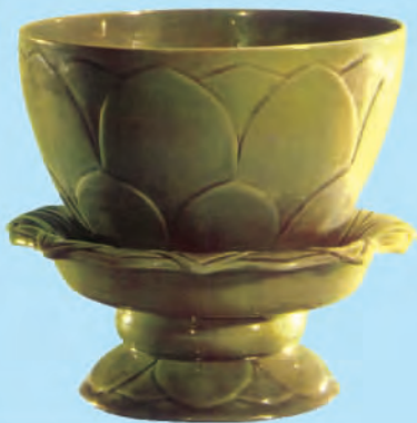
▲五代·越窑青瓷莲花托碗

不得妄有科配”，“自今后州县府镇凡使命经过，若不执敕文券(中央所发的证明)，并不得妄差人驴及取索一物已上”。开平元年(907年)，又放出洛阳皇宫中两宫内人及唐朝时的宫人，使其成为自由人。梁太祖还告诫军队将领“不得焚烧庐舍，开发丘墓，毁废农桑，驱掠士女”。朱温出身于农民，懂得苛税重役给农民造成的后果，采取这些措施，就是对民众作出一些让步。但梁朝从开国到灭亡，短短十几年间，大大小小的战争始终未间断，因此减轻租赋的意义，对于民众来说，也就很有限了。