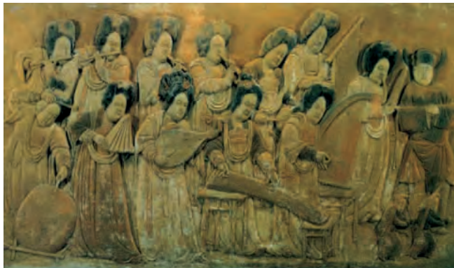
▲后梁彩绘浮雕妇女伎乐图