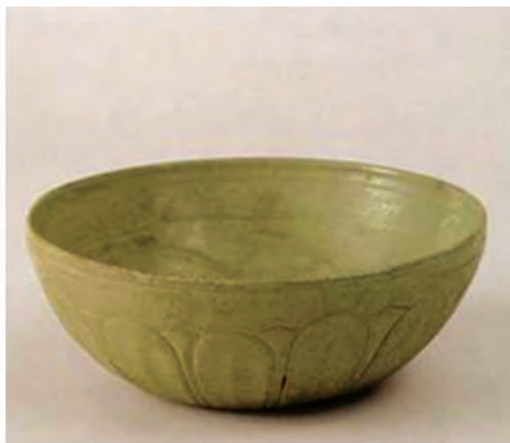
▲五代·海水龙纹莲瓣碗