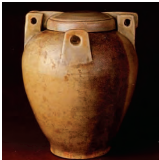
◀ 五代·青釉夹耳盖罐

梁太祖鉴于唐代以来形成的藩镇割据危及中央的教训,对于辖境内的节度使严加防范。因此,手握重兵、帮助朱温抢得政权的功臣,多被诛戮。如曾任保大节度使的氏叔琮、曾任武宁军留后的朱友恭(后迁为左右龙虎统军),均被以军政不理的罪名杀死。邓季筠、黄文靖因阅兵时马瘦被杀;李谠、李重允以不守军令被杀。尽管杀掉几个大将,但并不能改变百余年来藩镇专权的局面。梁太祖晚年,大将杨师厚手握强兵,历任大镇节度使,势益器强,这说明梁太祖限制节度使权势的措施未达到所期望的效果。