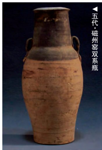
▲五代·磁州窑双系瓶

官半职。敬翔十分憎恶他们，对梁太祖说：“国家刚刚建立，应选用品行端正之士，以正风气，像苏循这类无德行之人，专靠卖国而谋利，不能留这种人在朝廷里。”于是梁太祖下诏，把苏循父子等官僚士族斥逐出朝廷。唐时供奉之风很盛，地方官僚为求得高升，常常攀