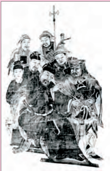
▲ 中坐看箭者为李克用