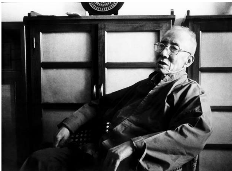
20 世纪 90 年代初，在学湖里寓所。