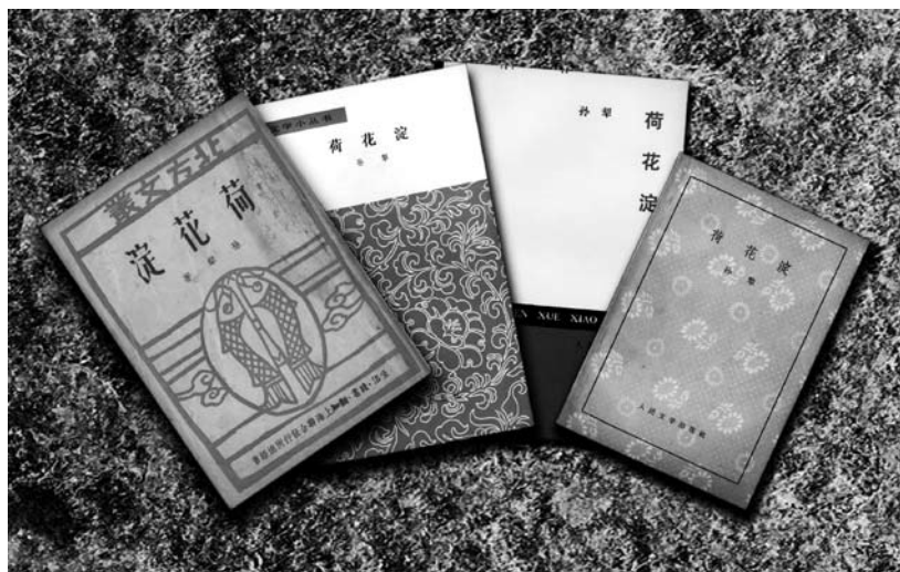
《荷花淀》部分单行本。