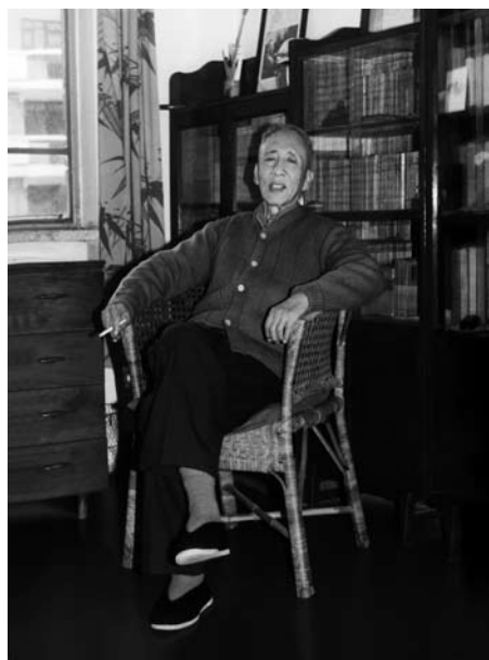
20 世纪 80 年代末，在学湖里寓所。