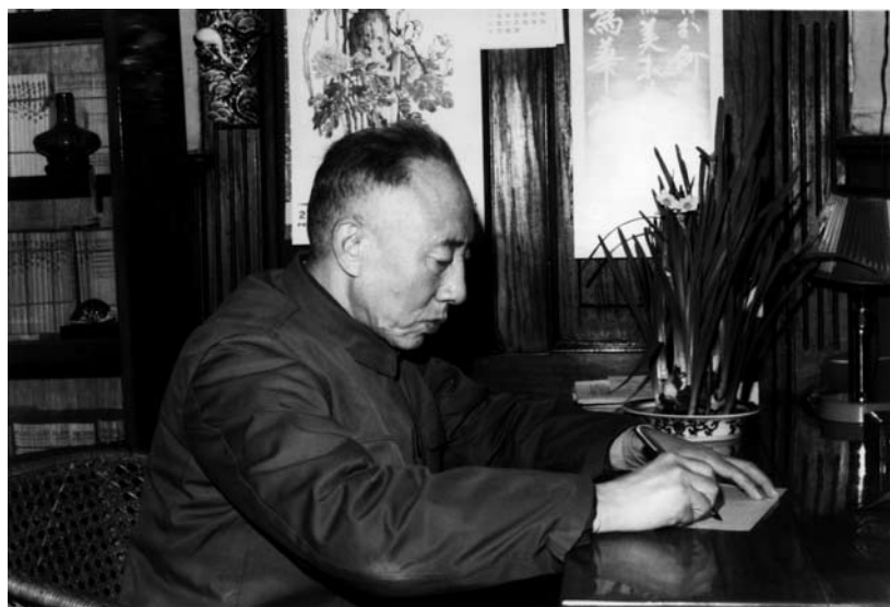
20 世纪 70 年代末，孙犁在多伦道大院寓所内给友人写信。