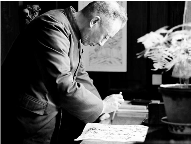
20 世纪 80 年代中期，孙犁在多伦道寓所练习书法。