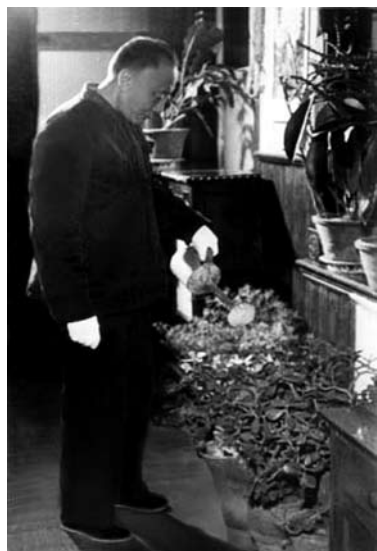
淡泊宁静与世无争。养花养鱼养小鸟，自得其乐。20世纪70年代末摄于多伦多寓所。