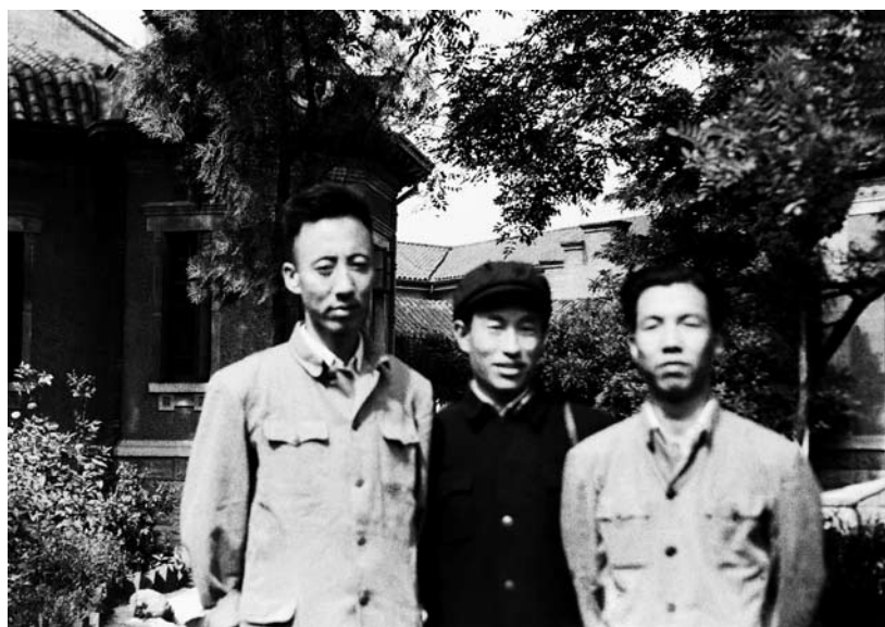
1952年孙犁与郭小川（中）、李冰（右）在多伦多道大院合影。