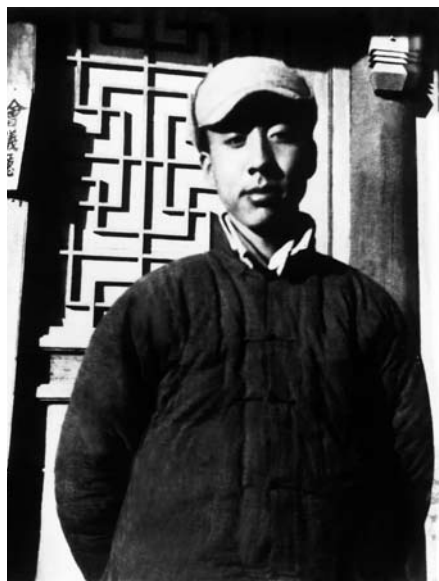
1946年孙犁在河北省蠡县， 时年三十三岁。