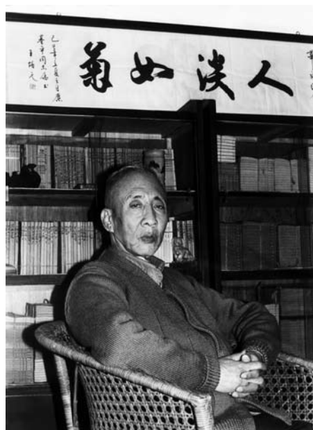
甘于寂寞，人淡如菊。一生爱书，不离不弃。孙犁先生 20 世纪 80 年代在学湖里寓所。