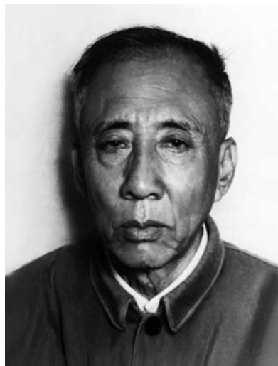
20 世纪 80 年代的孙犁。