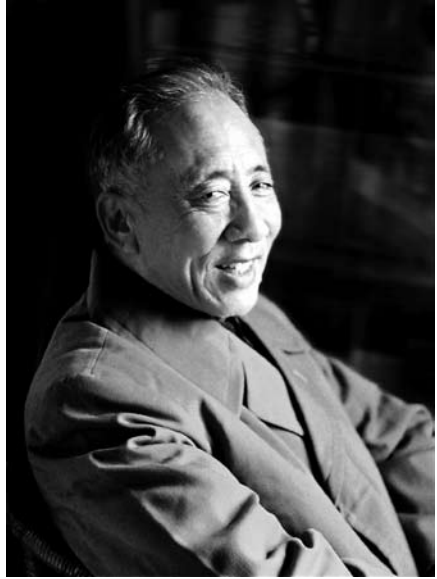
回眸一笑，亲情依依。