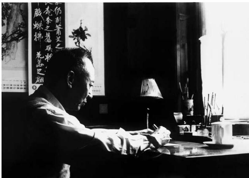
十年动乱之后，老作家重新握笔。