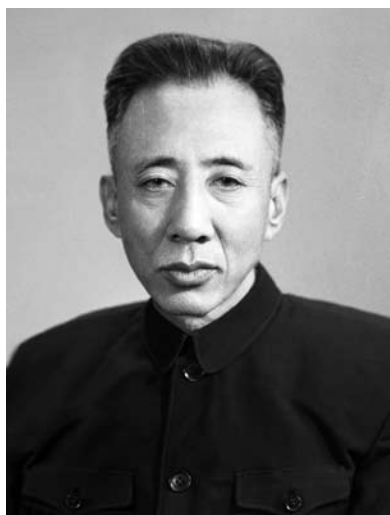
20 世纪 70 年代的孙犁。