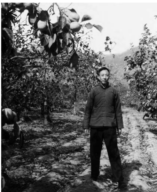
1965 年孙犁在天津蓟县盘山。