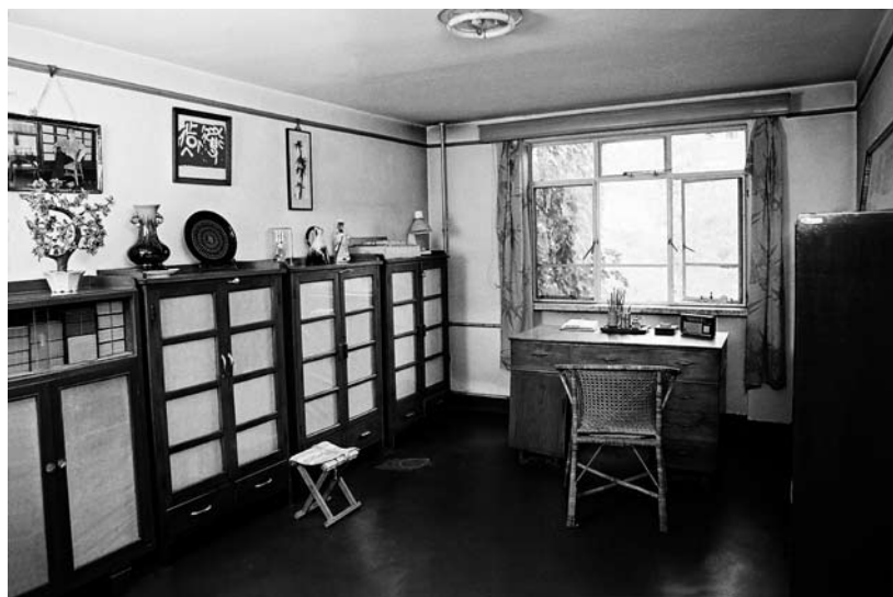
学湖里“耕堂”书房一侧。