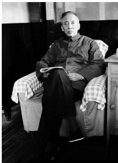
20世纪80年代初孙犁在多伦多寓所留影。