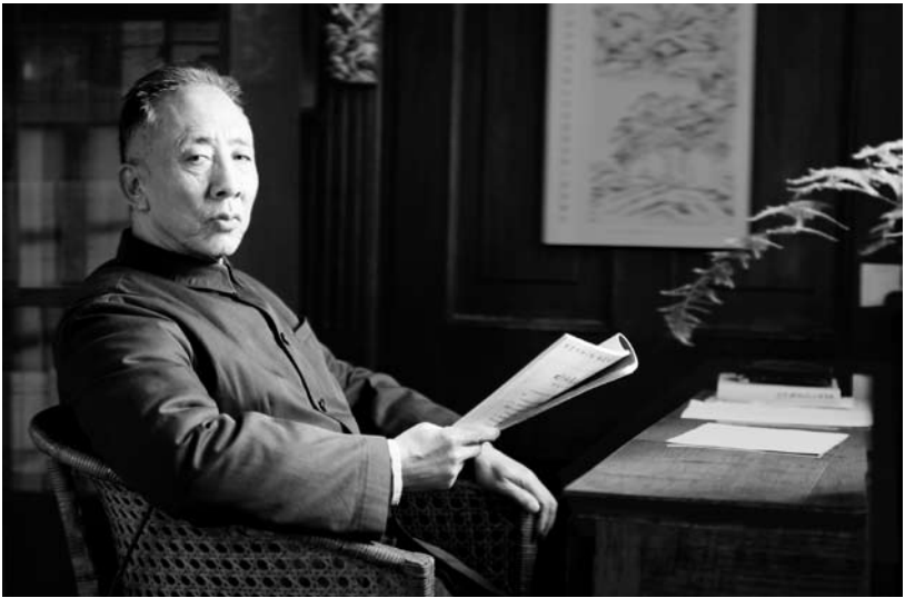
20 世纪 80 年代中期，七十多岁的孙犁在多伦多寓所。