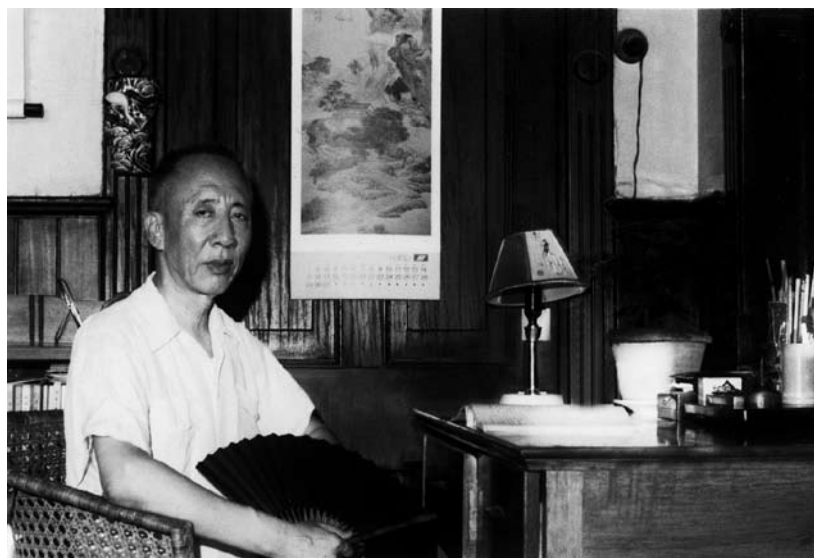
20世纪70年代末，孙犁在多伦多寓所写字台前。