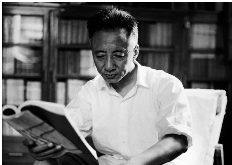
20 世纪 70 年代初孙犁在多伦道寓所内看书。