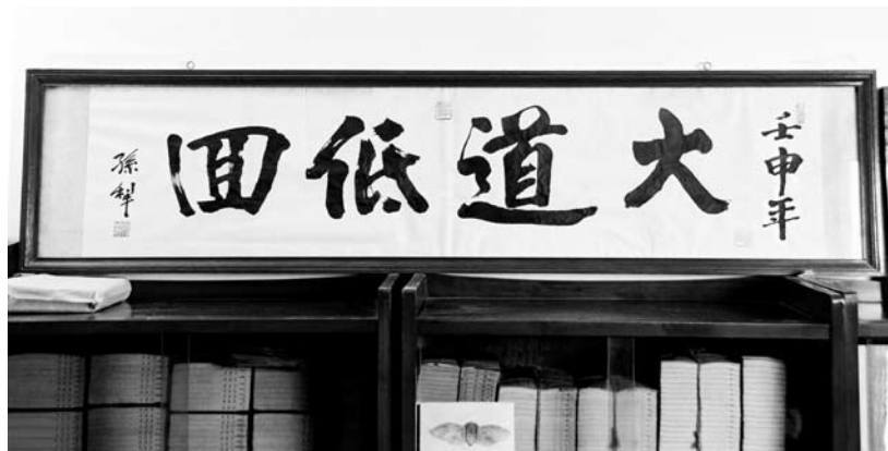
“耕堂”内孙犁书写的“大道低回”横幅，下面是他的书柜。