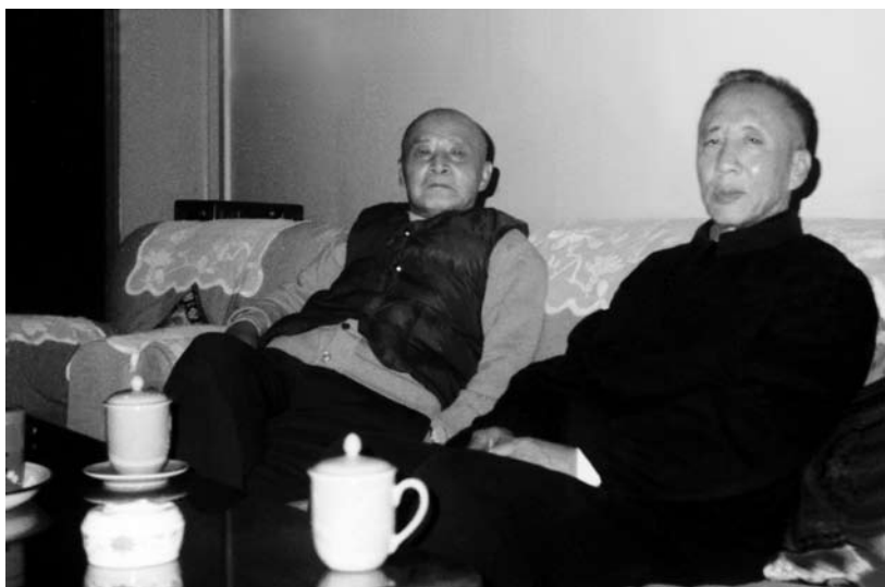
1981年11月22日，孙犁亲去天津迎宾馆看望来津的吕正操将军，他们已有三十七年没有见面了。这张照片是一同前往的石坚同志所摄。