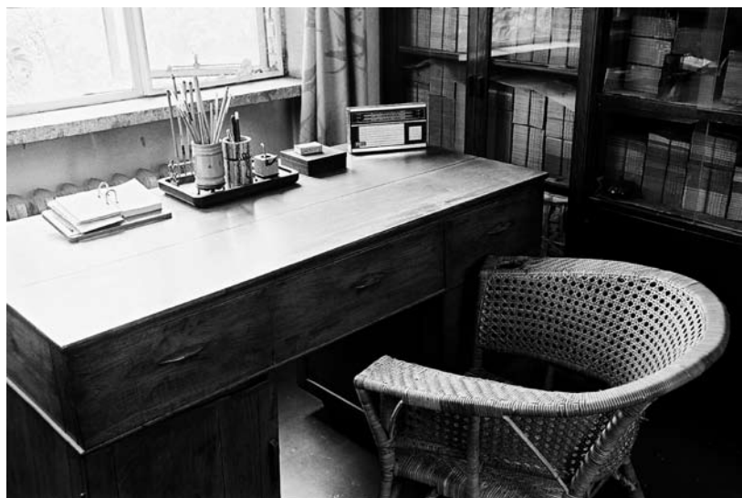
学湖里寓所“耕堂”内孙犁的写字台，这就是他写作的环境。