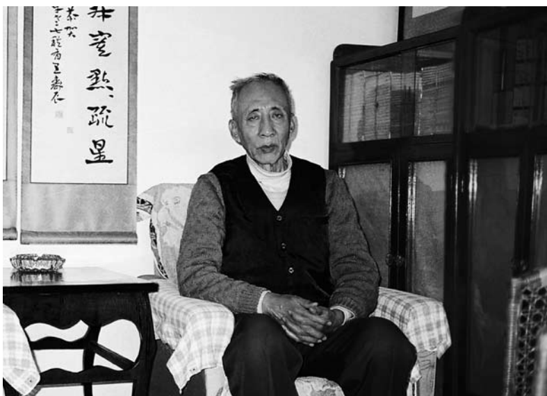
1992 年 4 月，孙犁七十九岁生日前摄于学湖里寓所。