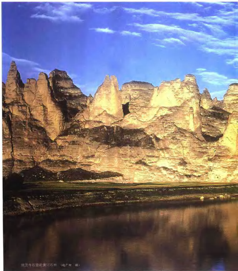
炳灵寺石窟前黄河石林