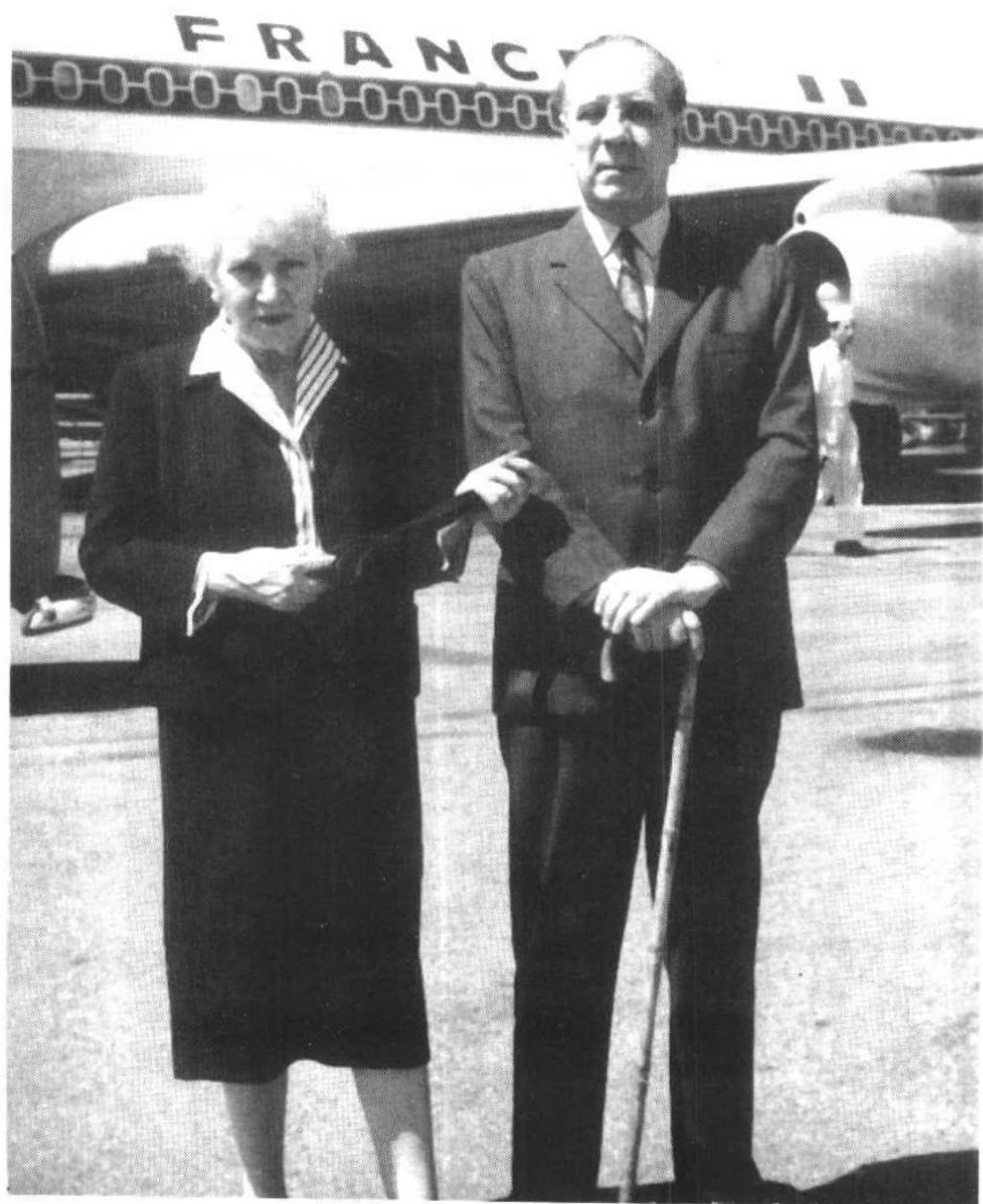
1963年2月，母子二人飞抵英国。