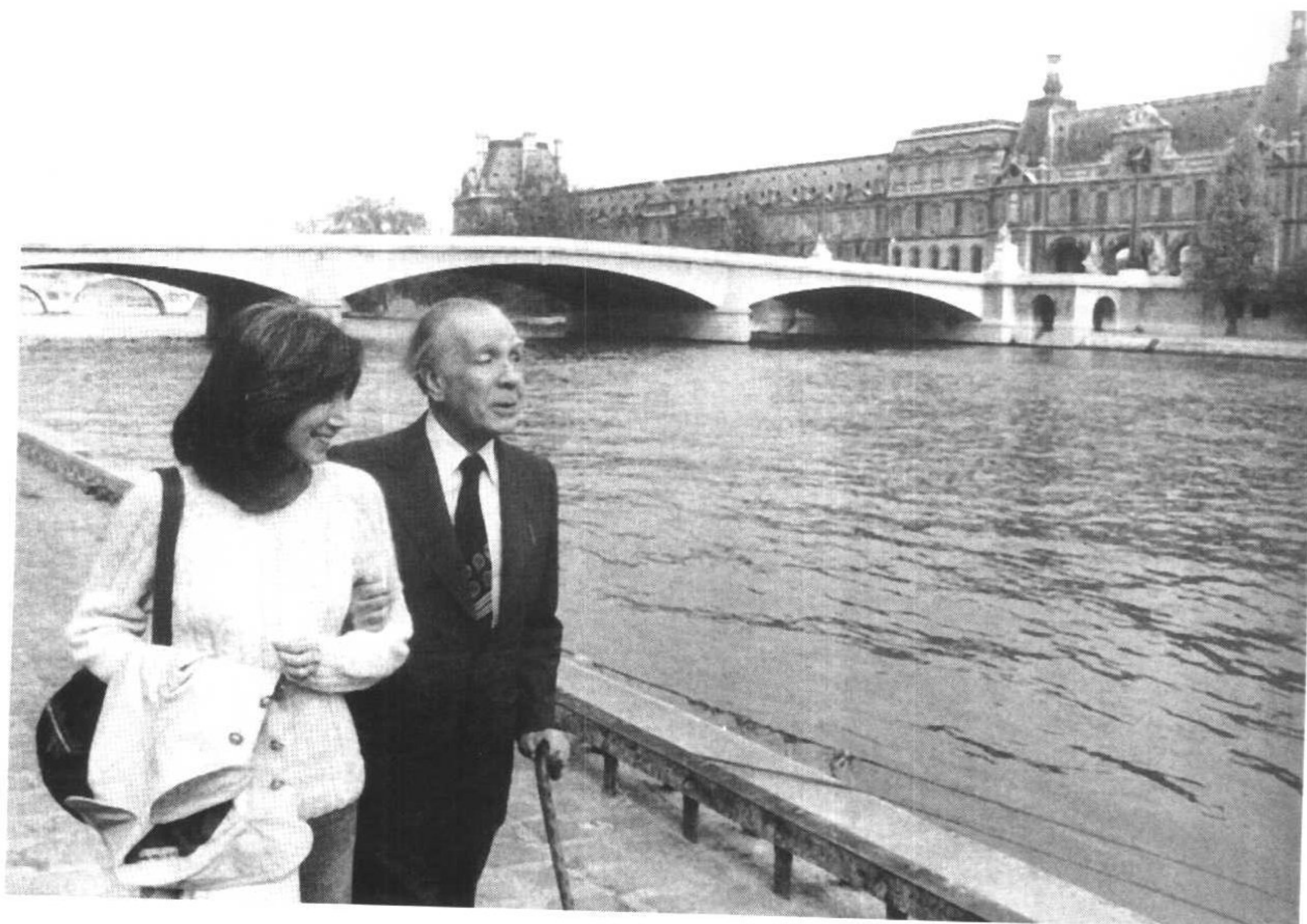
博尔赫斯和他未来的妻子玛丽亚·儿玉在塞纳河畔散步。