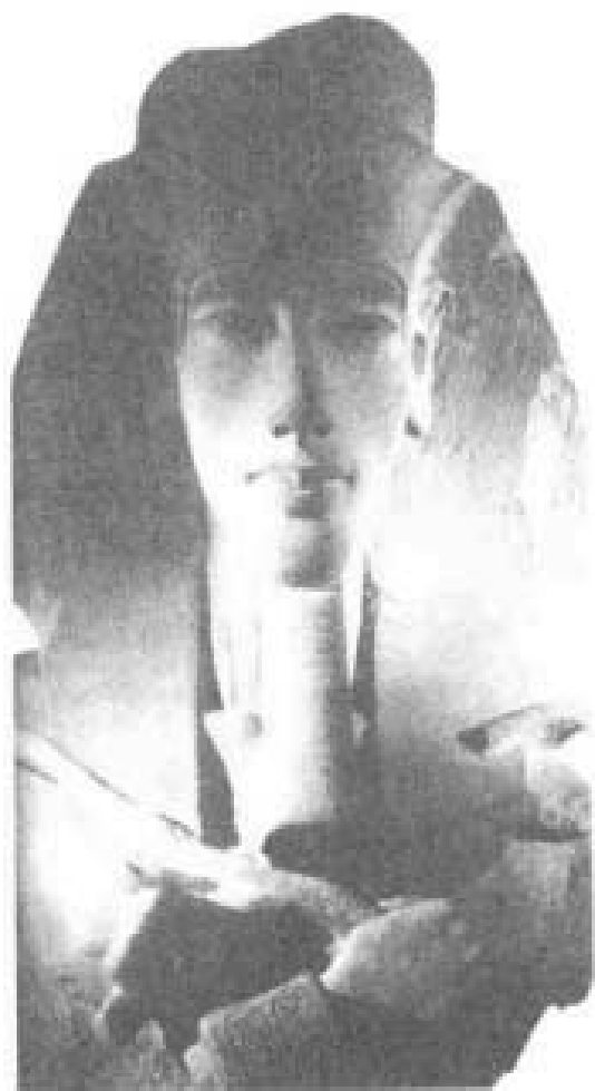
卡纳克的太阳神庙发现的太阳神雕像，以法老埃赫那吞的形象形成了神像的上半身。

首先，谋杀说本身疑点重重。图坦卡蒙在位期间，正值埃及十八王朝的末期，和他的前代——“异教徒”国王埃赫那吞坚决推进宗教改革不同，年幼的图坦卡蒙面对阿蒙祭司和旧势力贵族的重压，选择了妥协退让。他接受了旧教徒的主张，终止了前王的宗教改革；把都城从阿克塔顿又迁回底比斯，恢复对阿蒙神的崇拜；归还阿蒙神神庙的领土和财产，他还把自己的名字改为“图坦卡蒙”，意为