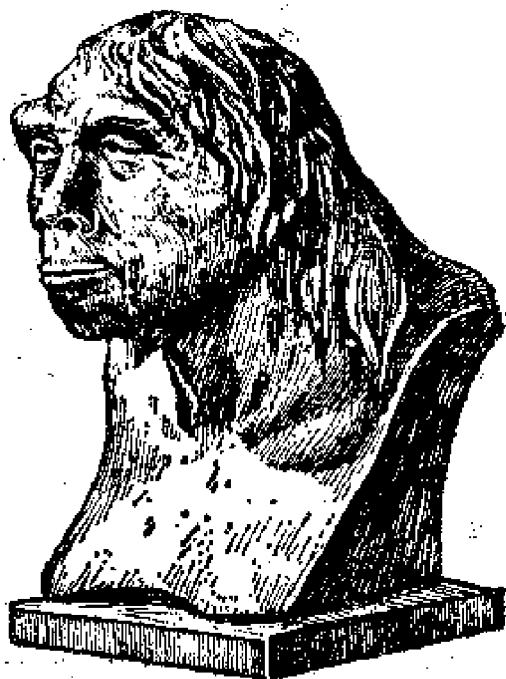
北京人头部复原像

裴文中发现“北京人”第一个头盖骨的消息很快就传开了，它轰动一时，震惊了世界学术界。周口店的发掘工作者们接到了很多贺电和贺信，但他们并没有因为取得这一载入世界史册的成就而松懈，而是更加倍地努力工作。裴文中工作刻苦，细心、肯动脑筋，对洞中的骨块、石头、灰烬等每一件东西都反复观察，仔细研究。他发现有些石头上有人工打击的痕迹，便断定，这是“北京人”制造的石器。这一发现证明了“北京人”已经能够制造工具，说明他们从猿转变成了人。