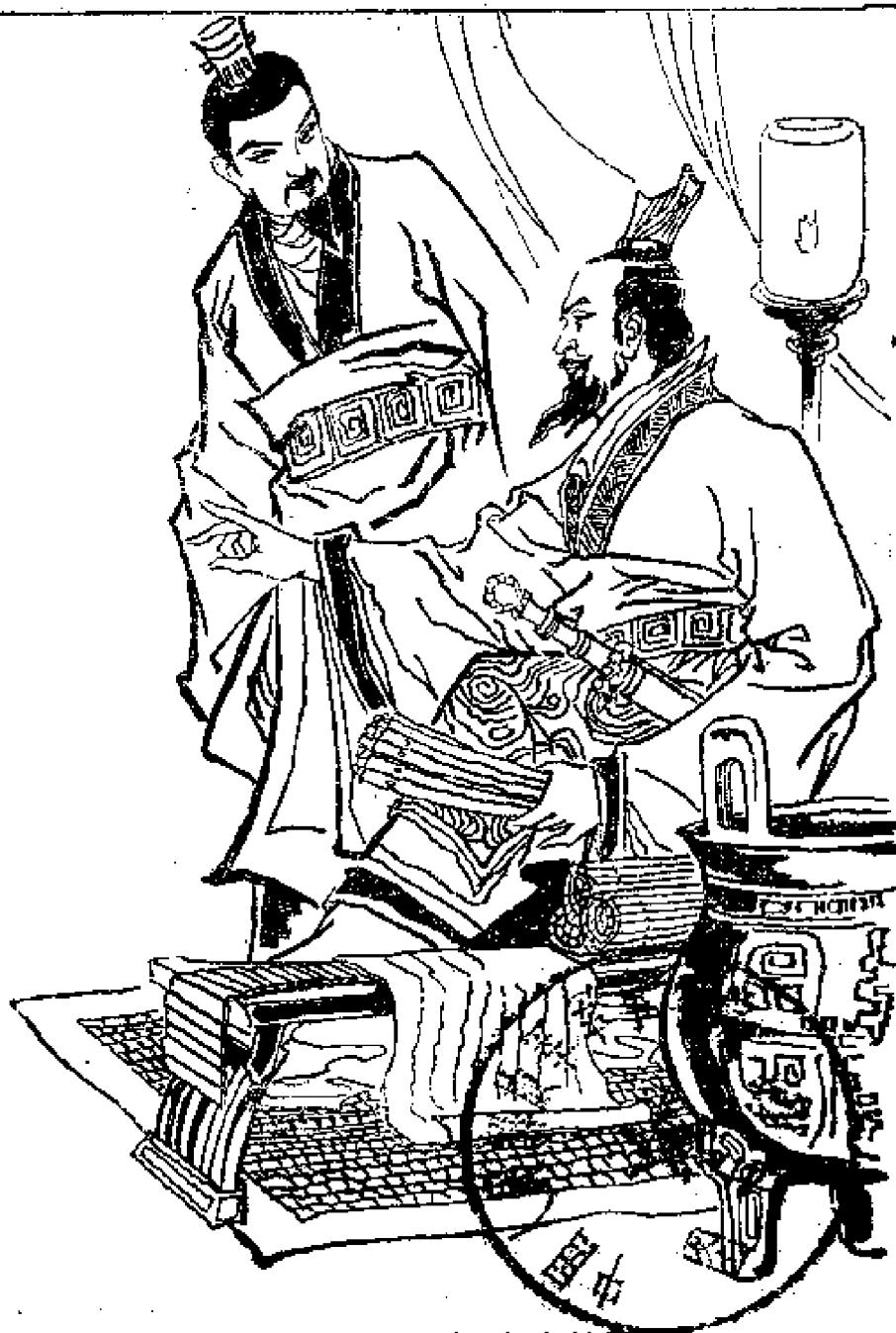
燕昭王向郭隗请教图