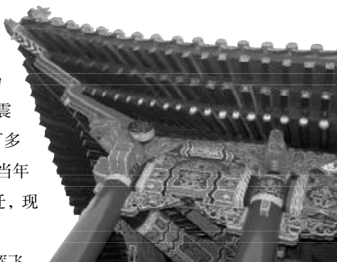
△三层交叠的檐椽，比太和殿的建筑规制还要高。