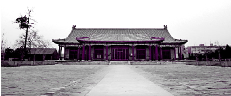
管理部门拉起的警戒线预示这里经过整修，将恢复开放，昔日繁华的“小南城”虽仅剩银安殿，却依旧气势逼人。