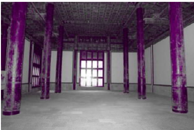
△大殿北面由六根红木柱支起，超过了清朝对“王府五间”的规制。

鸟革，虎踞龙盘，雕镂奇异，金碧辉煌”，有大殿四间，其余曲室阿房，崇楼杰阁“殆以千计”。300多年过去，这府邸随历史的更替至今，只剩一座大殿——银安殿了。银安殿外东西两侧的厢房、回廊早已不见踪影，但据熟悉的人介绍，它们的基座还在，只是被水泥盖在了下面。