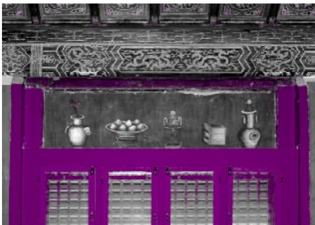
△ 油画般的花瓶、香炉、书籍等图案。