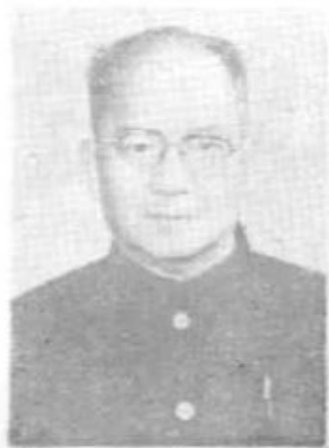
譚其驥 我國著名歷史 地理學家 上海復旦大學教 授