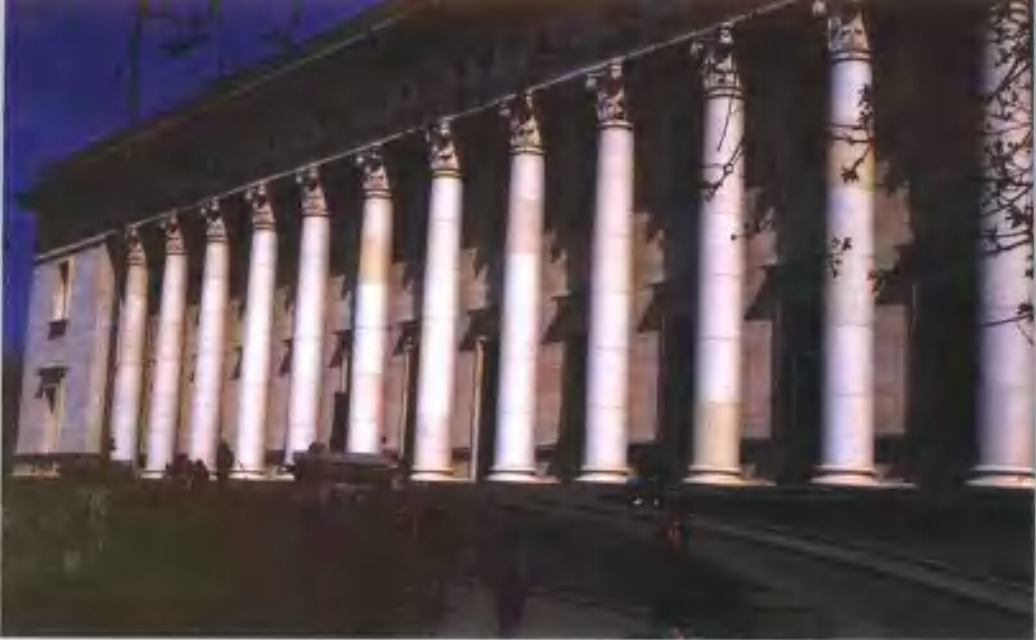
“基里尔和梅托迪”人民图书馆