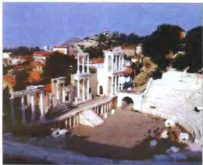
普罗夫迪夫古罗马剧场