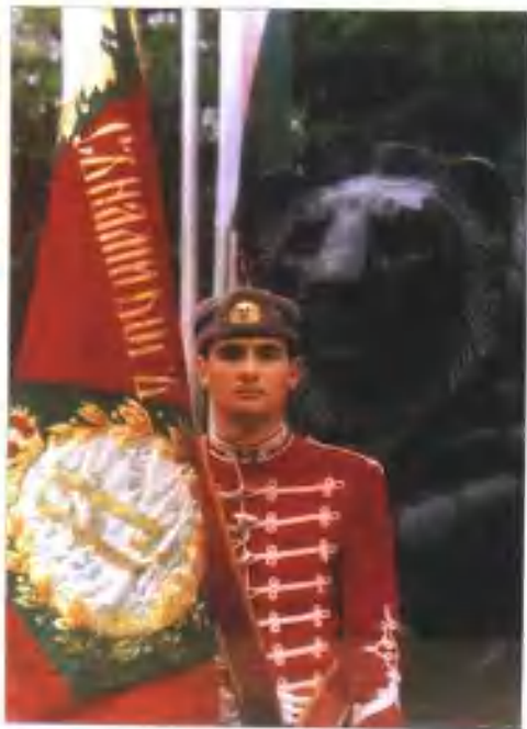
身着传统军服士兵