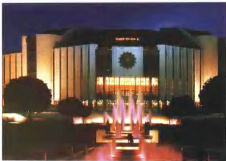
索非亚人民文化宫