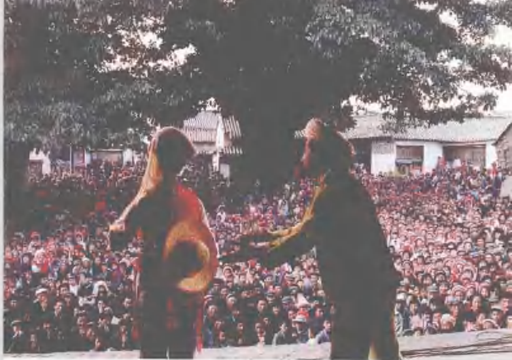
大青树下，成千上万的白族群众观看大本曲表演