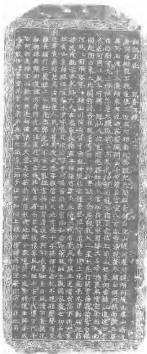
明代学者杨黼创作的白族山花调《词记山花·咏苍洱境》