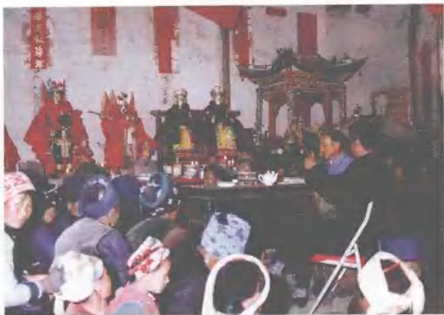
与神共娱同乐，反映白族人神和谐的宗教观