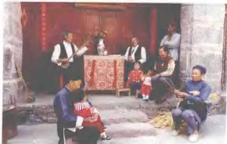
大本曲让白族人家劳动、生活更添情趣