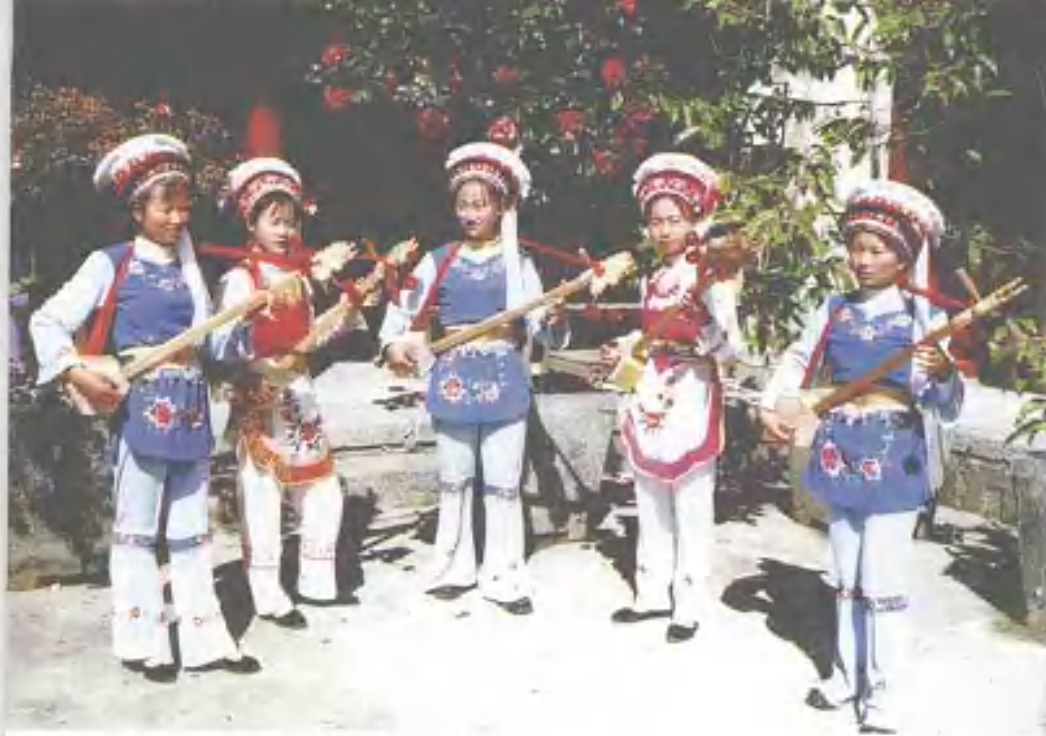
白族大本曲新秀“五朵金花”