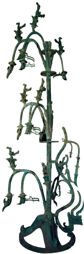
青铜神树，三星堆博物馆藏

这株神树是世界上最早、最高的青铜神树，高396厘米，1986年从二号祭祀坑出土。有专家说，它可能是古神话传说中的太阳神树——扶桑树。也有人说，古代传说有一株叫建木的神树，在世界的中心，是众神上天的梯子，它位于当时称作“都广”的成都平原；而三星堆的神树，正反映了古蜀人的神树崇拜观念。这些说法孰是孰非？