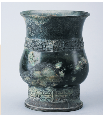
牧正父己铜觶，四川博物院藏