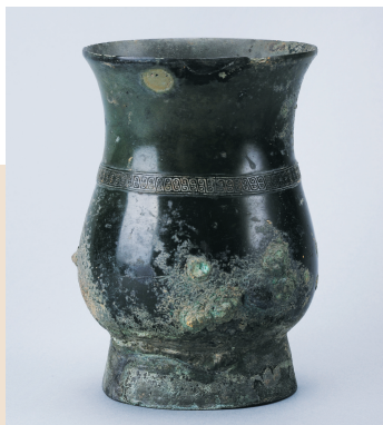
覃父癸铜觶，四川博物院藏