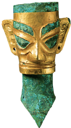
戴金面罩人头像 三星堆博物馆藏

当黄河流域文明之星闪耀之际，古巴蜀璀璨的文化之光也照亮了历史的天空。四川广汉南兴镇有三座突兀在成都平原上的黄土堆，被称作“三星堆”。1929年春，当地农民燕道诚在屋旁挖水沟时，发现了一坑精美的古代玉器，由此揭开了三星堆文明神秘面纱的一角。1980年，三星堆遗址开始正式发掘。1986年，两个商代大型祭祀坑被发现，出土了大量青铜器、玉石器、象牙、贝、陶器和金器等。金器中的金杖和金面罩制作精美。而其中最具特色的首推三四百件青铜器，这些青铜器不仅器形高大、造型生动、结构复杂，而且多数器物种类和造型的特征都