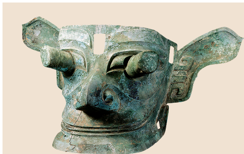
纵目面具，三星堆博物馆藏

三星堆遗址的发掘轰动了世界，首次向世人展示了商代中晚期蜀国青铜文明的高度发达和独具一格的面貌。三星堆文明上承古蜀宝墩文化，下启金沙文化，前后历时约2000年，是我国长江流域早期文明的代表。