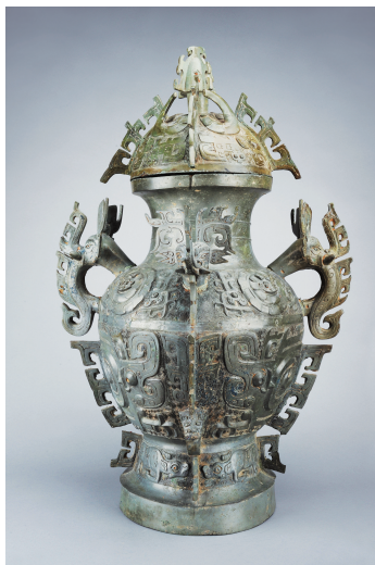
西周象首耳兽面纹铜罍，四川博物院藏