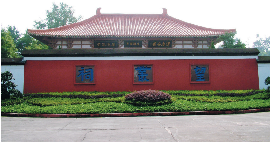
成都郫县望丛祠，是祭祀望帝杜宇和丛帝鼈灵的地方

传说可以为我们探寻历史真相提供一些线索，但对于传说，我们一定要谨慎思考，选择其中的合理因素，摒弃那些诞妄的成分。如果按传说中所说，望帝是主动让位，就不能算“亡国”。他退位前，没必要非要把国家的重器埋藏在地下。真相究竟是怎样的？至今为止，这个千古之谜仍无准确的答案。我们可以下结论的是，竹瓦街铜器的出土地点位于成都西北约40公里，东距三星堆遗址直线距离约10公里，南距新繁水观音遗址也只有6公里左右。可见，这一区域是古蜀人活动的中心地带。