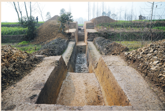
宝墩遗址发掘现场

看到这里,你可能会想,成都平原有没有重要的新石器遗址呢?考古发掘给了我们很好的答案:1995年,新津县城西北的龙马乡宝墩村发掘出了一处古城遗址,它规模宏大,总面积达60万平方米,是成都平原已探明的古城遗址中最大的一个。这一发现证明了远在距今4500年左右,在成都平原就已经产生了作为蜀文化源头的新石器时代晚期文化——“宝墩文化”。宝墩遗址既是这一时期成都平原最早的古城址的典型,也是四川即将跨进文明门槛的历史见证,为“长江流域与黄河流域一样也是人类早期文明的摇篮”提供了坚实的物证。