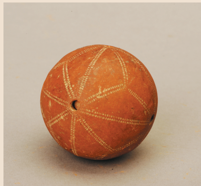
大溪遗址红陶球，四川博物院藏

这件直径4.4厘米的红陶空心球是大溪文物中的精品。大溪的工匠们在十分光滑规整的红陶球表面上戳刺出无数圆点，圆点相连成线，这些线条把整个球面分成若干对称而均等的三角形和扇形，表现了五千年前人们原始的几何学、数学观念。它是做什么用的？有专家说，它是那个时代孩子们的玩具。至于怎么个玩法，大家不妨运用想象力去推测吧！