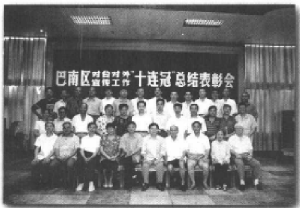
巴南区对台对外宣传工作获市“十连冠”总结表彰会合影