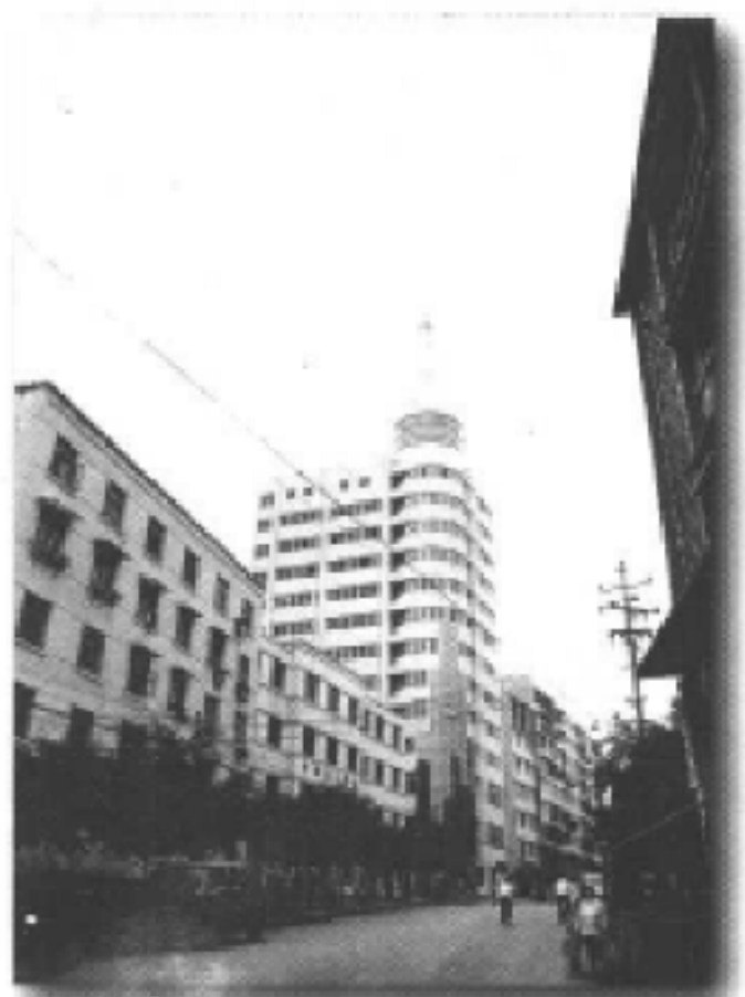
巴南区广播电视局大楼