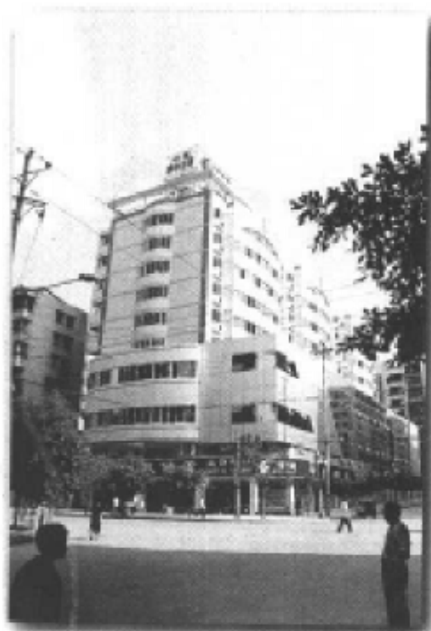
巴南区新邮政大楼