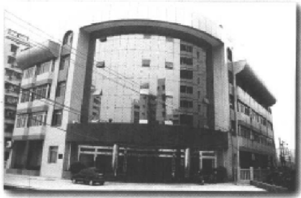
巴南区国家税务局大楼