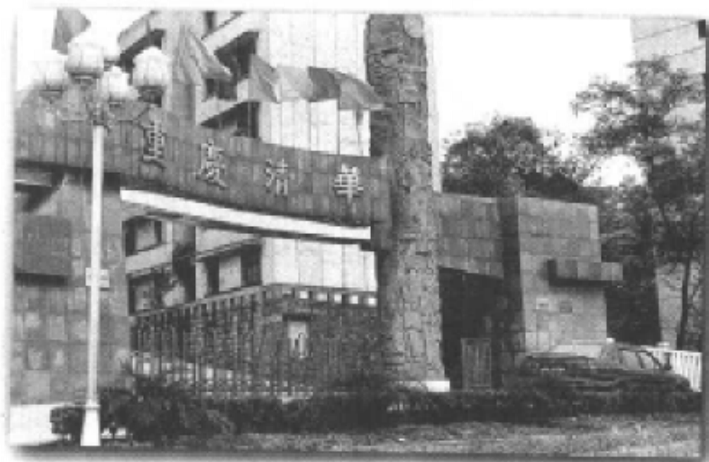
重庆市清华中学校门