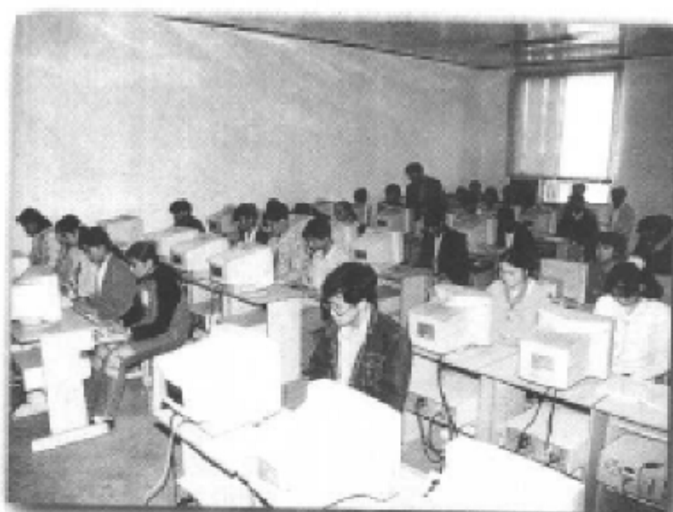
中共重庆市巴南区委党校微机室一角