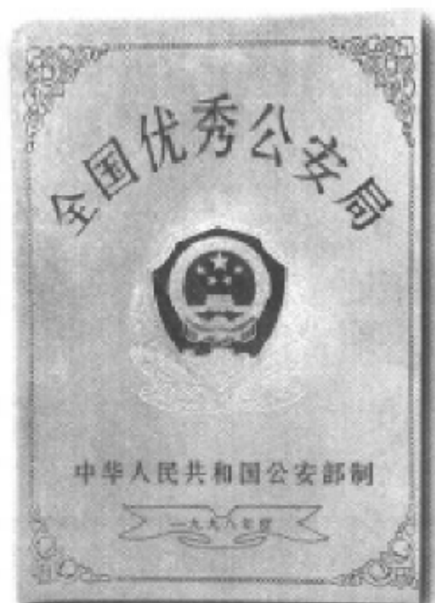
重庆市公安局巴南区分局获全国优秀公安局称号