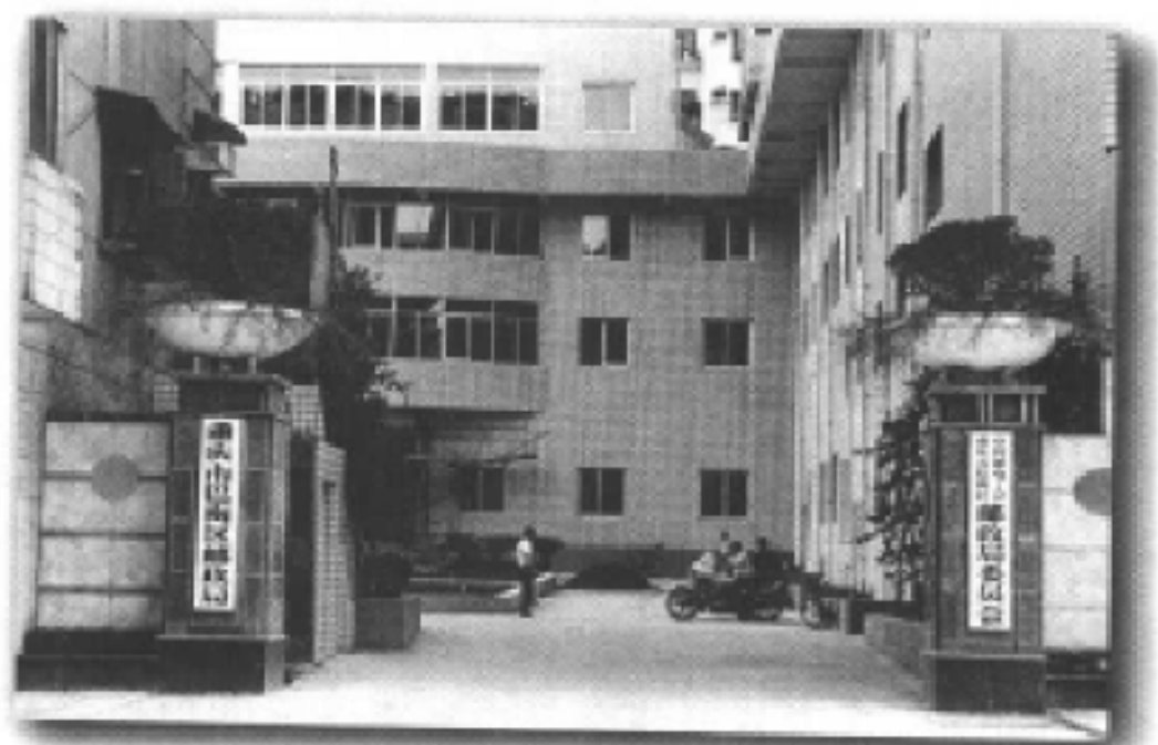
巴南区邮政局新办公大楼