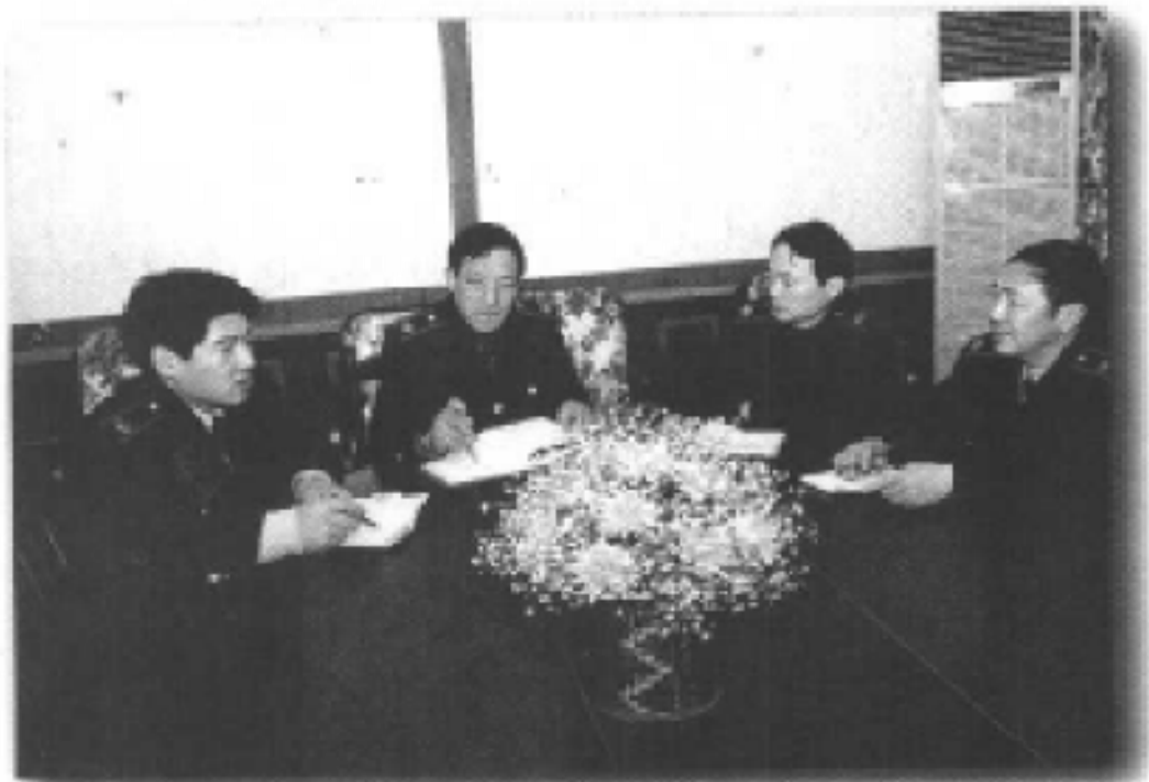
巴南区国家税务局局领导班子在研究工作