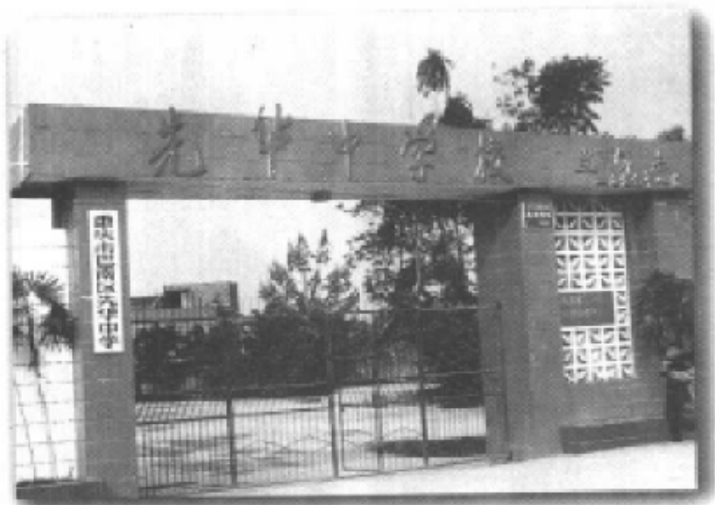
巴南区先华中学校校门