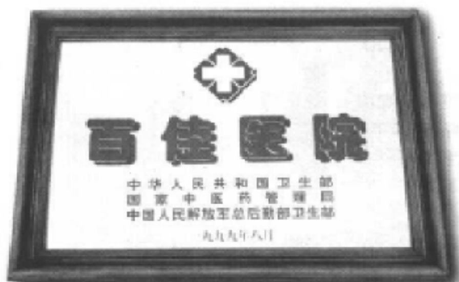
全国百佳医院荣获者——巴南区人民医院