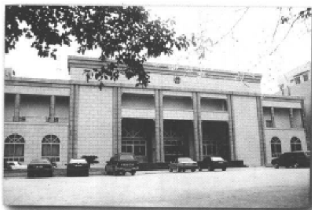
巴南区区政府礼堂