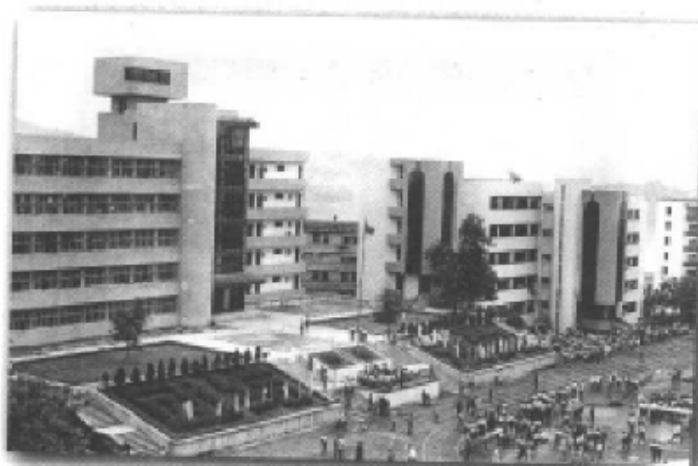
巴县中学校园一角