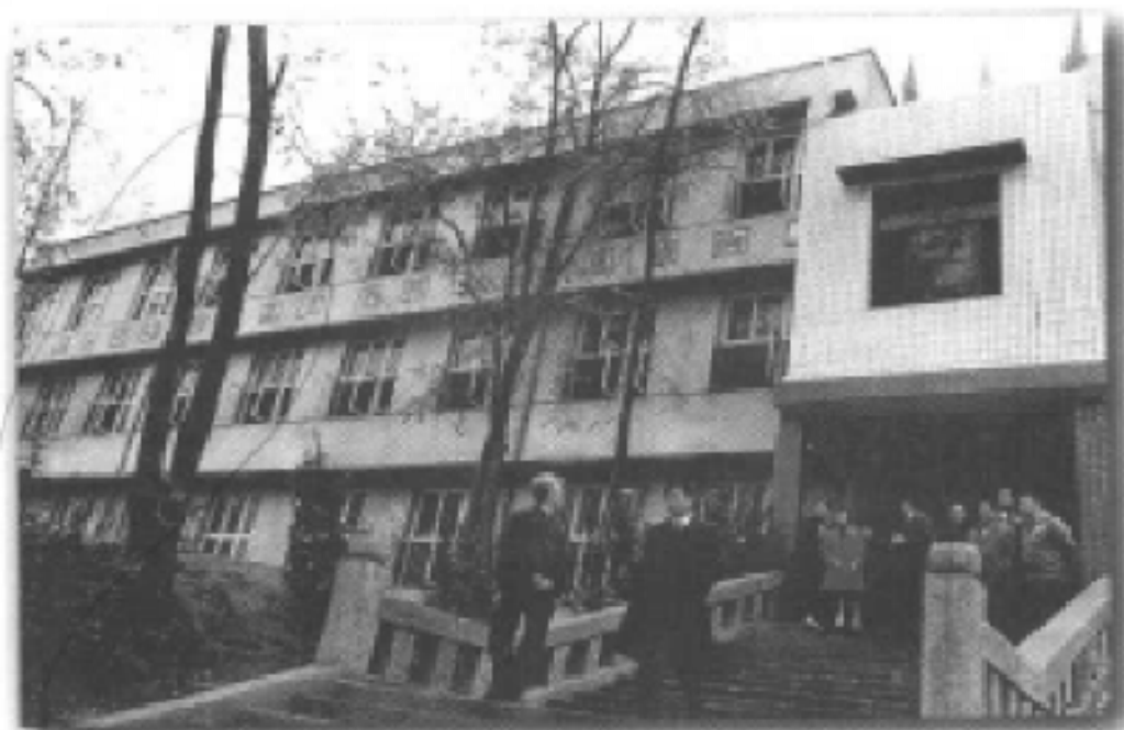
重庆市巴南区光彩学校教学楼