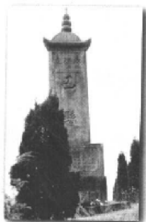
位于巴南区、綦江县、南川县交 界处的“友谊碑”