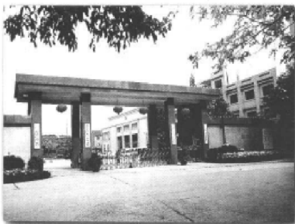
巴南区区机关大门