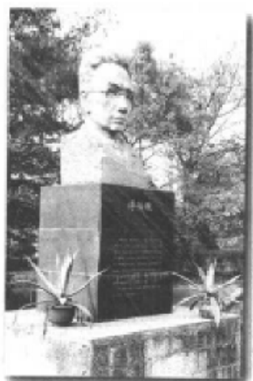
重庆市清华中学首任校长 傅任敢塑像