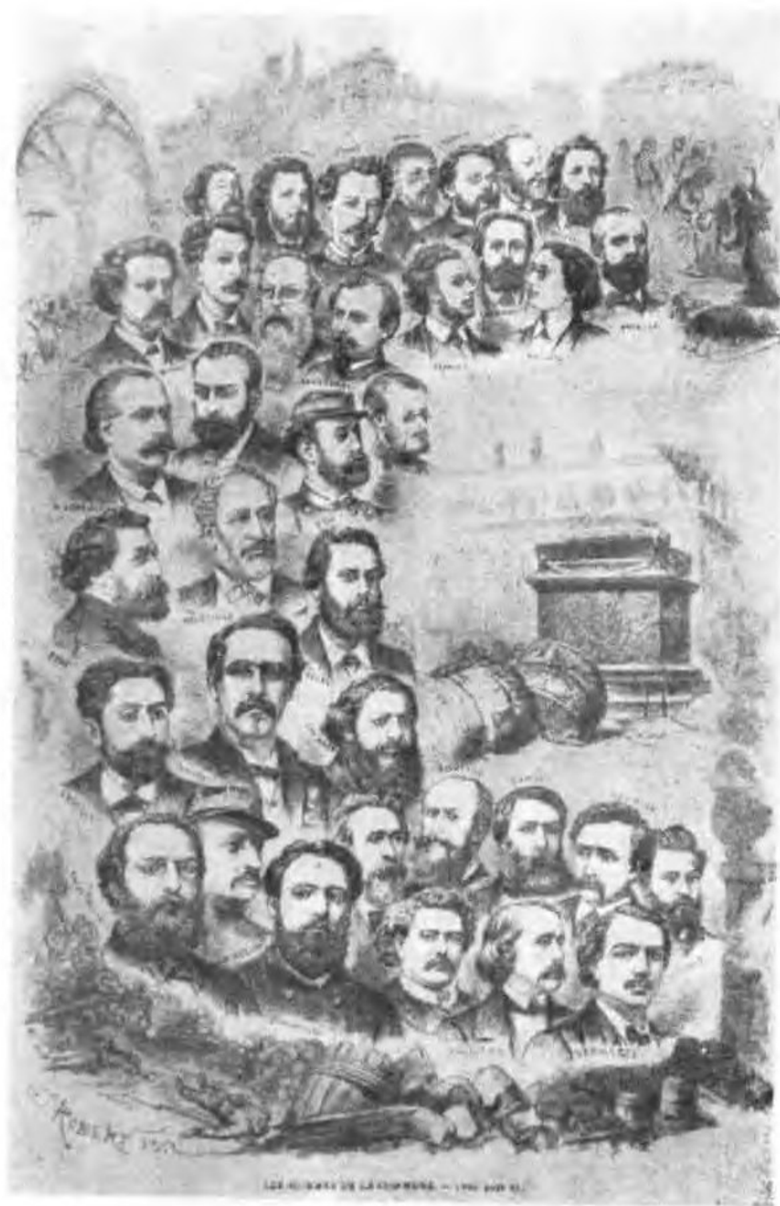
图 2 1871年巴黎公社活动家