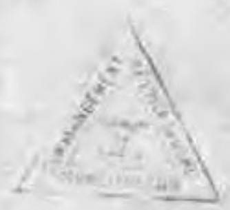
图 10 (續)