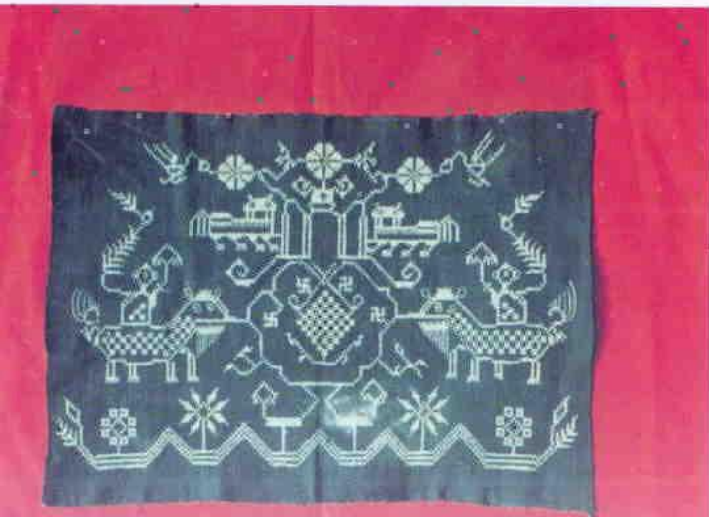
长阳虎凤纹 刺绣手袱