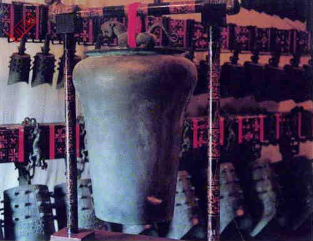
宜昌三游洞巴楚乐宫