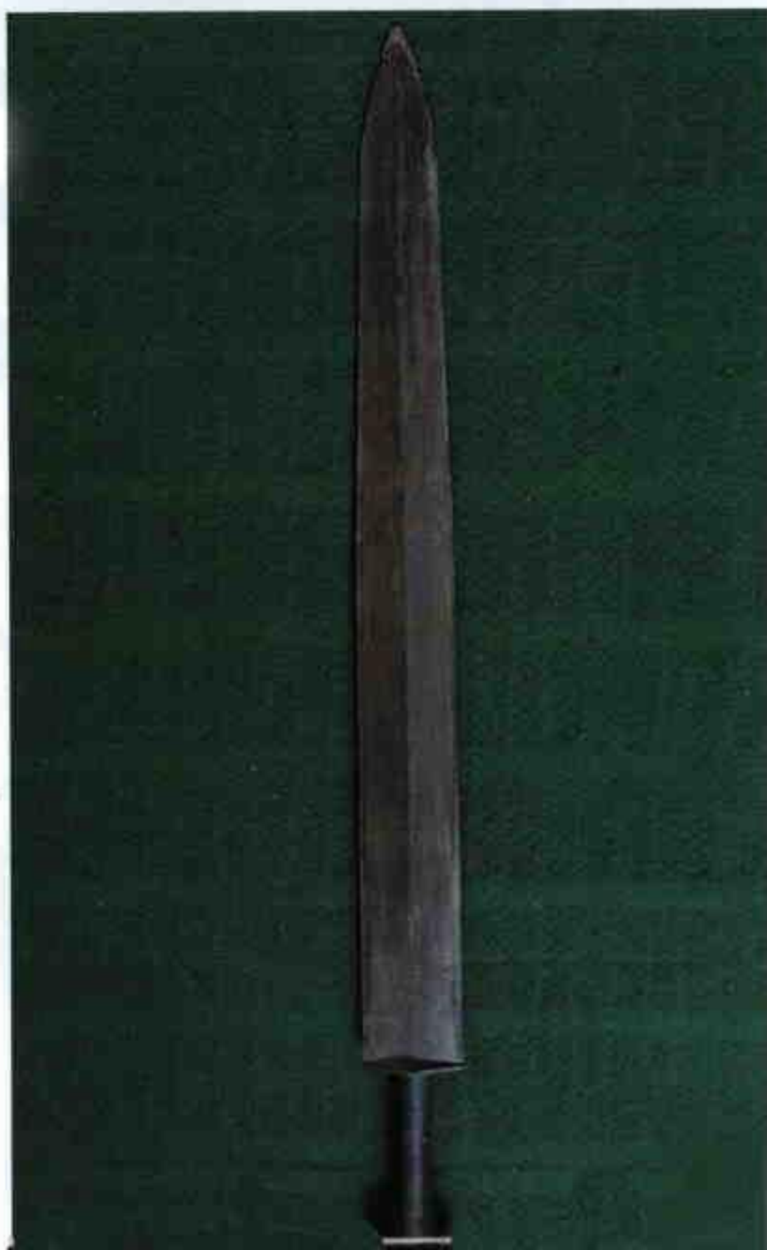
宜昌龙泉楚式铜剑