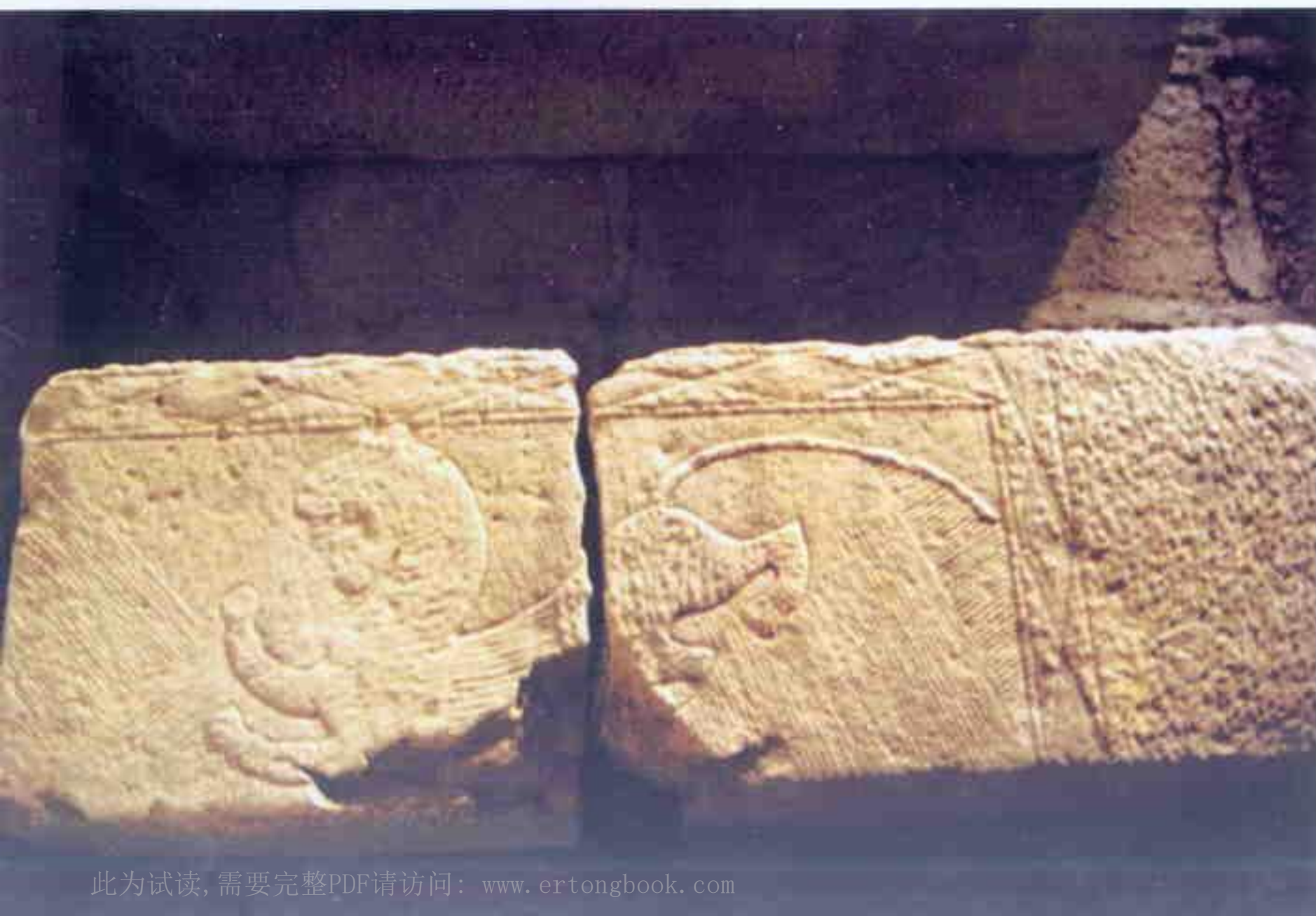
当阳虎凤纹画像石