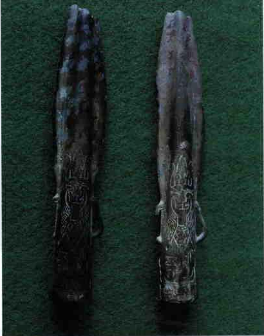
宜昌龙泉巴式铜骷骹