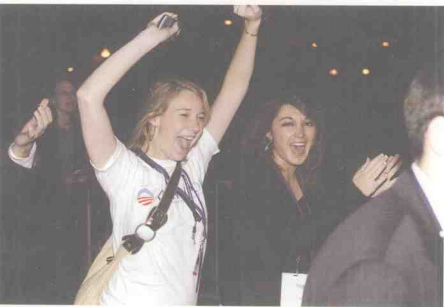
2008年11月4日晚，芝加哥格兰特公园，奥巴马的支持者庆祝奥巴马当选。据统计，当晚格兰特公园里共挤进了12.5万名奥巴马的支持者