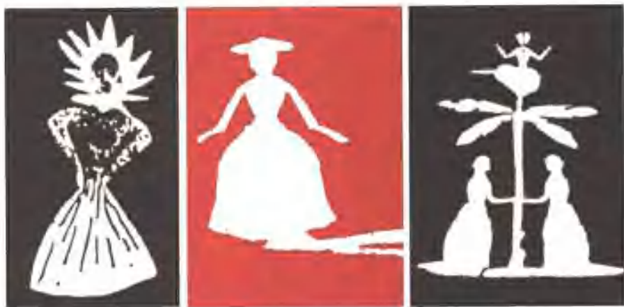
■ 安徒生剪纸。上排：自左至右：歌唱家、贵夫人、爱情。 下排：天使和精灵