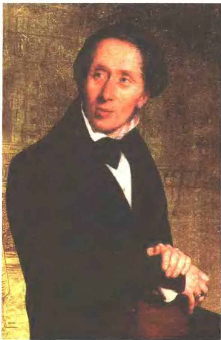
■ 走上文学道路的安徒生