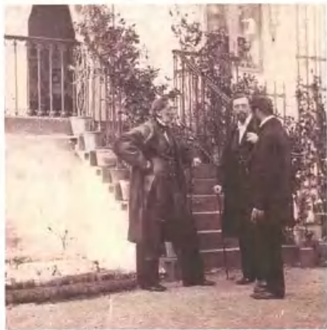
■ 上图：1865年的安徒生 ■ 下图：安徒生和朋友在一起