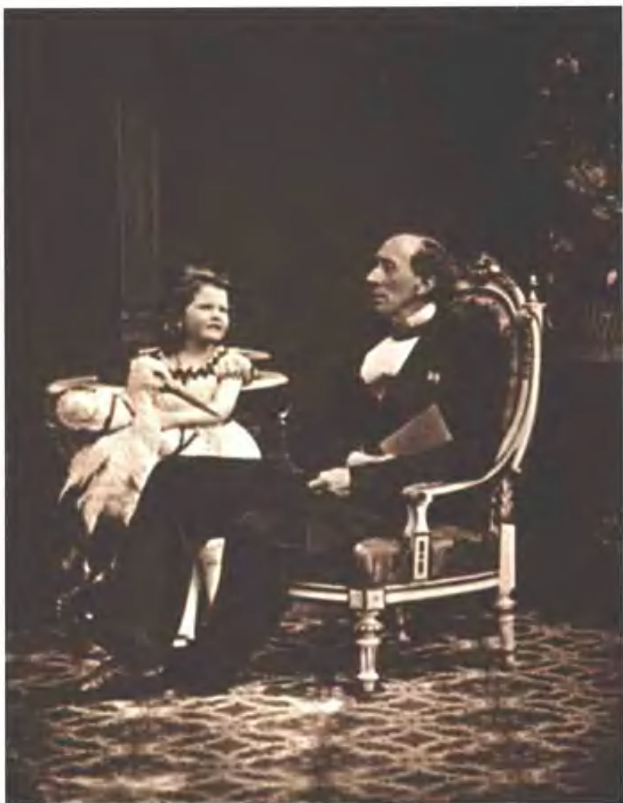
■ 1875 年的安徒生