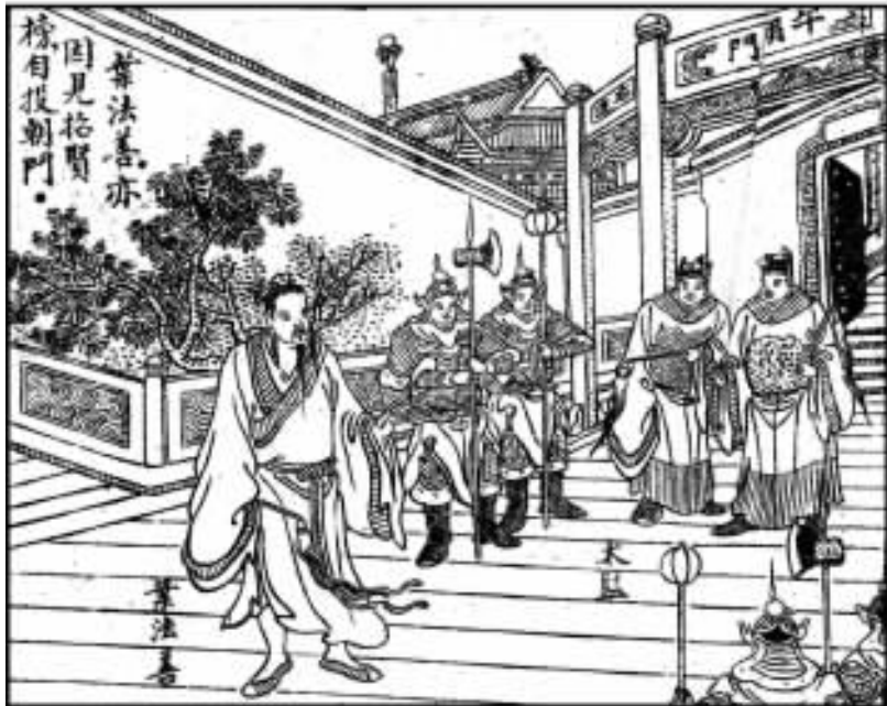
8. 叶法善见榜也来投。