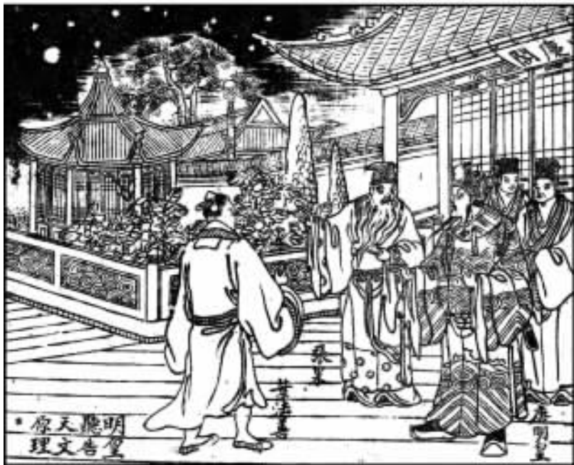
13. 明皇听告天文原理。