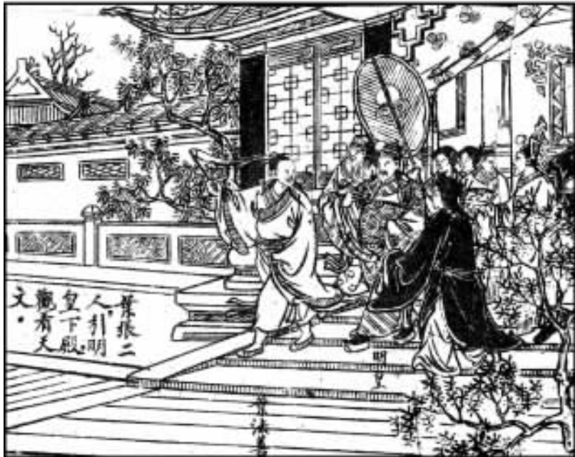
12. 叶张二人引皇帝观天文。