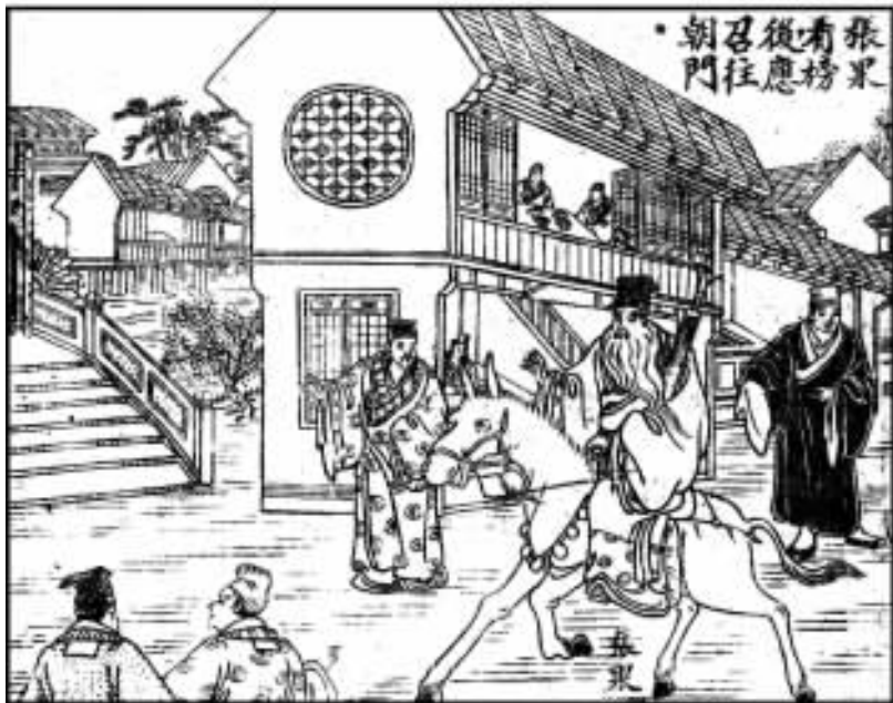
4. 张果看榜后，应召往朝门。