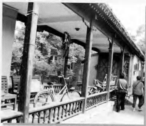
北京阿拉善王府游廊一部分