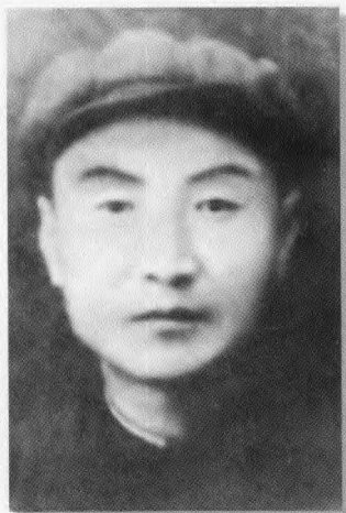
中共阿拉善旗工委书记曹动之