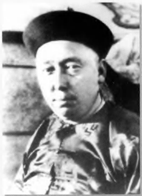
德王—德穆楚克栋鲁普