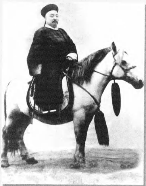
阿拉善旗第八位札萨克亲王多罗特色楞