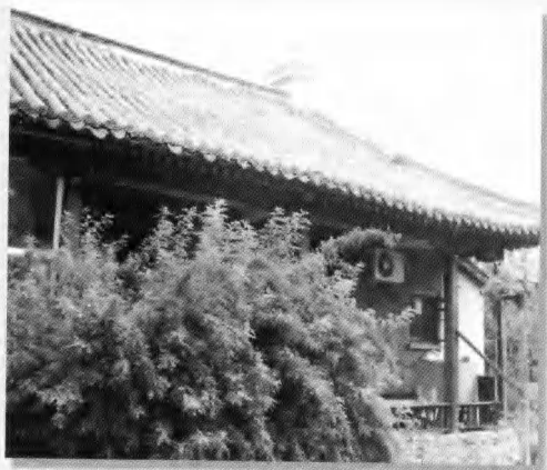
北京阿拉善王府过厅一角