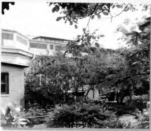
北京的阿拉善王府西式小楼一角