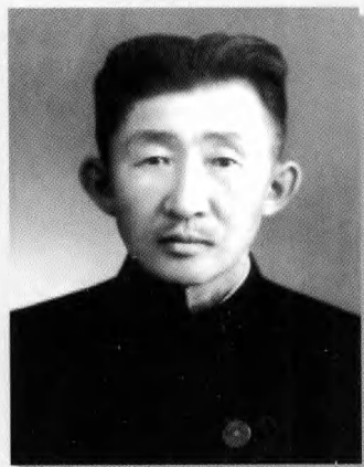
建国后的塔旺嘉布先生