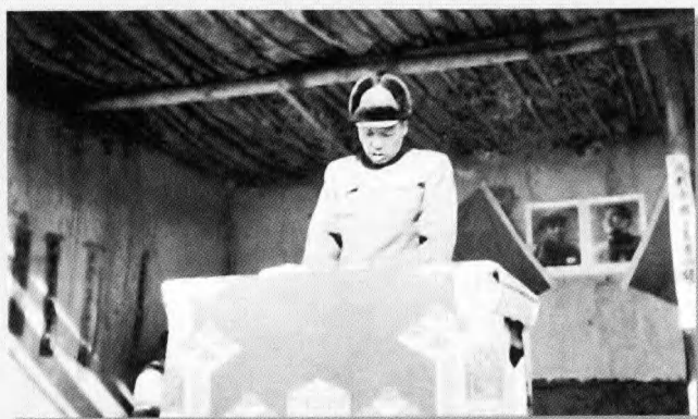
1950年阿拉善旗自治区主席达理札雅在定远营各界庆祝春节大会上讲话