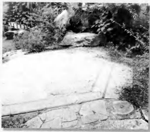
北京的阿拉善王府假山顶六角亭遗迹