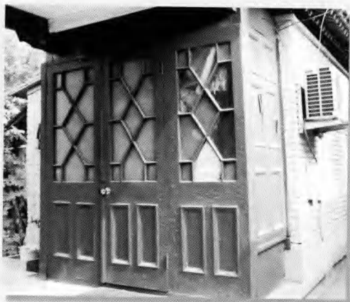
北京的阿拉善王府贵重木材制成的西式门遗存