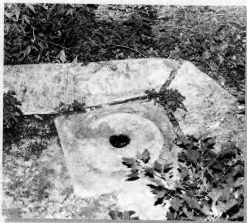
北京的阿拉善王府内的水井遗迹