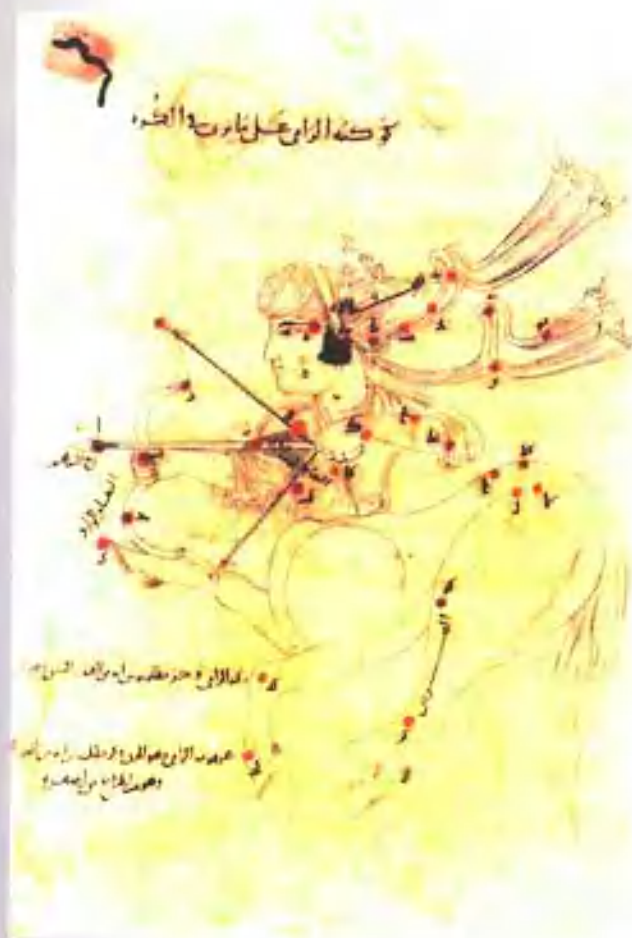
阿拉伯天文学星座图