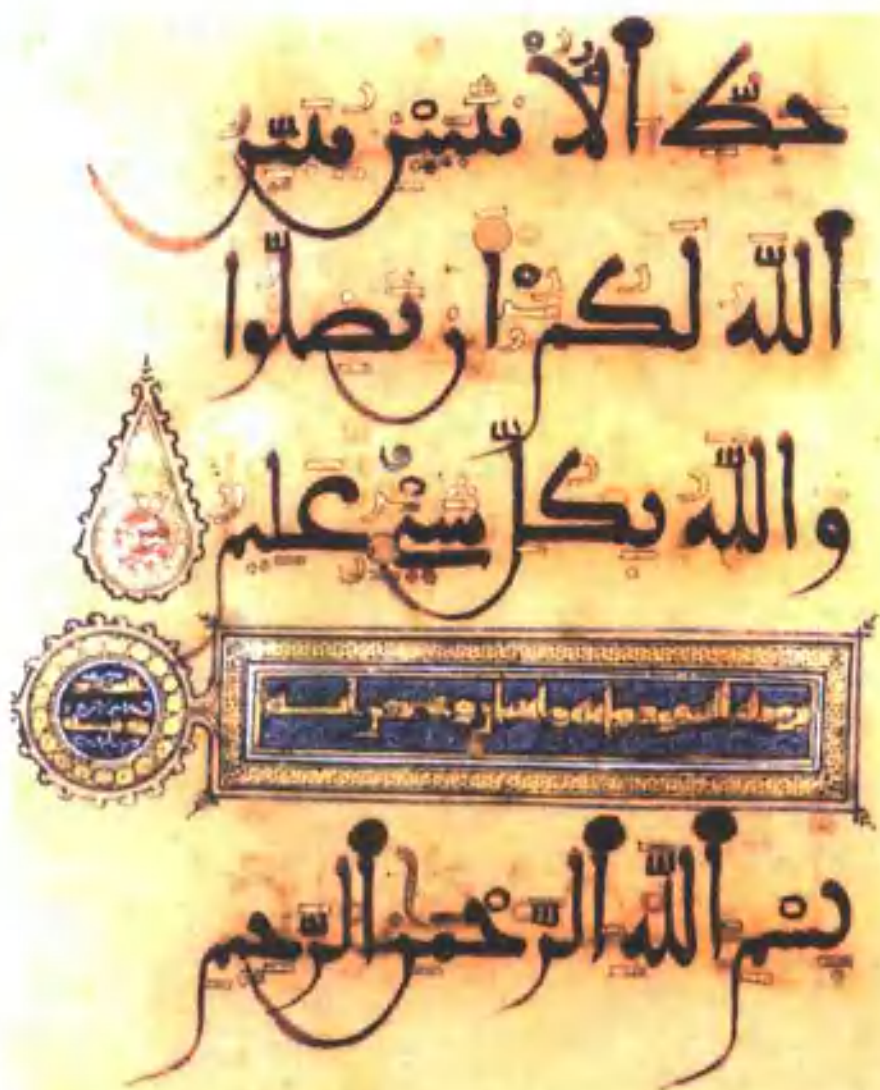
《古兰经》伊斯兰教的圣典