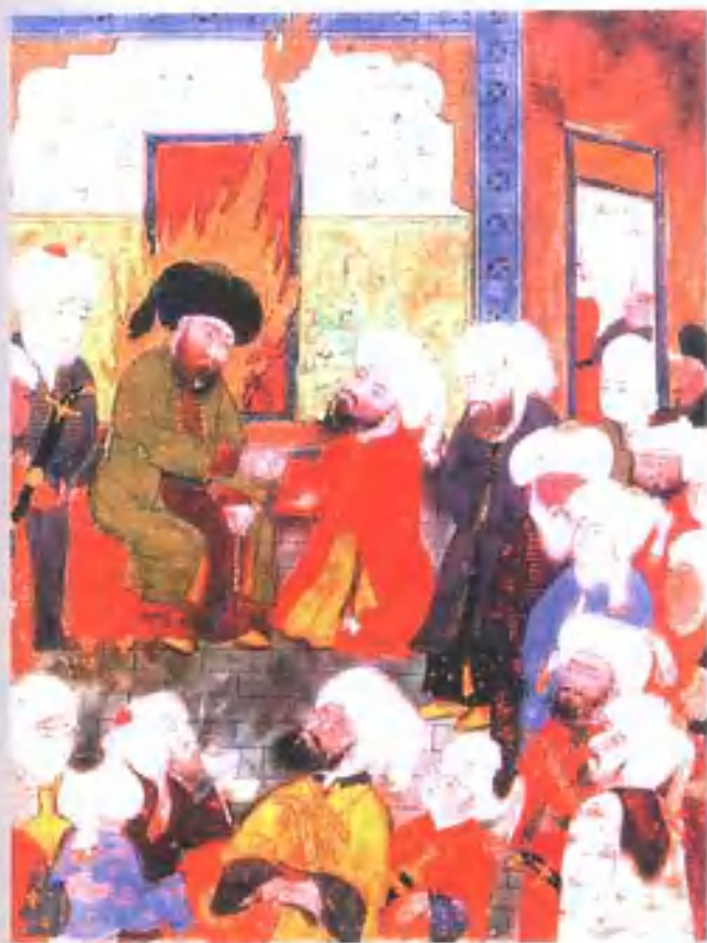
穆斯林向第四任哈里发阿里宣誓效忠