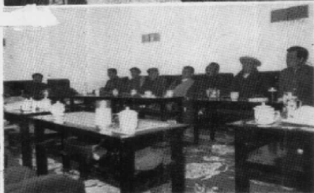
ར་བ་ཁུལ་གྱི་དྲུག་ཁང་གི་རིག་གནས་ལོ་རྒྱུས་དབུང་ལོག་ཞིབ་འཇུག་ ལྷ་ལོན་ལྷ་ཁང་གི་ལ་འབྲེལ་ཡིན་མི་ཕྱོད་ལྷན་དང་ལ་ནས་རིག་གནས་ལོ་རྒྱུས་..... དབུང་ལོག་ལ་མཉམ་བཞེས་བྱེད་བཞིན་པ།