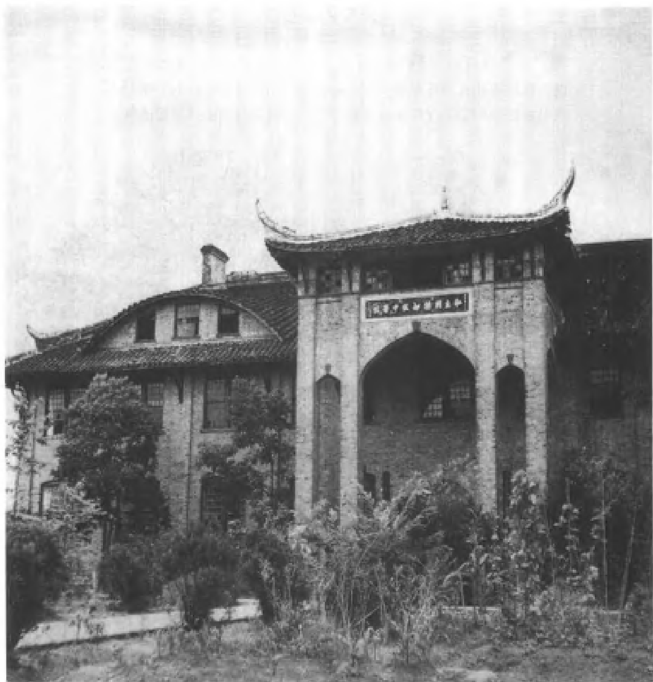
雅安城里一所私立中学的教学楼