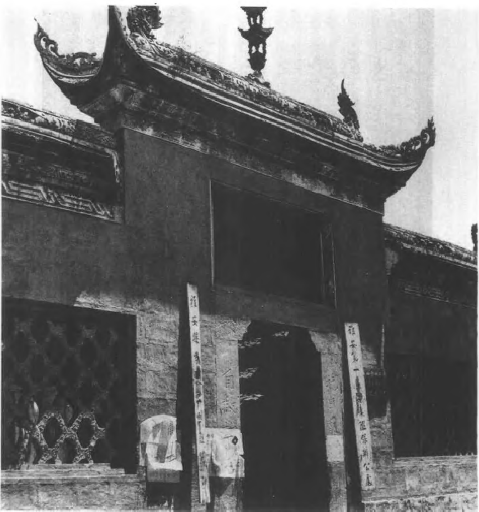
李廉柯已古为今用，派做了巡保办公处。