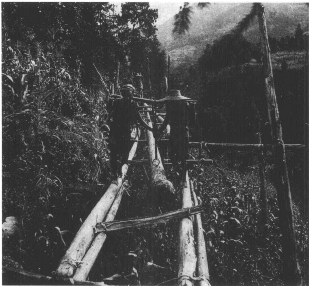
这是伐木人的路，他们走来了。

蜀道之难自古皆然，而西康之途更是猿猴难攀。西康人上山伐木，先要架设木桥，再把木材运出来，其艰难困苦可想而知，无怪古人说上山一千人，回来剩五百。因此，在西康，修路无疑是最具远见的一件事情，也是步入现代化的开明之举。虽然所修的公路还很简陋，一场暴雨就足以让它面目全非，但这蜿蜒崎岖的山路却是连接未来的希望。