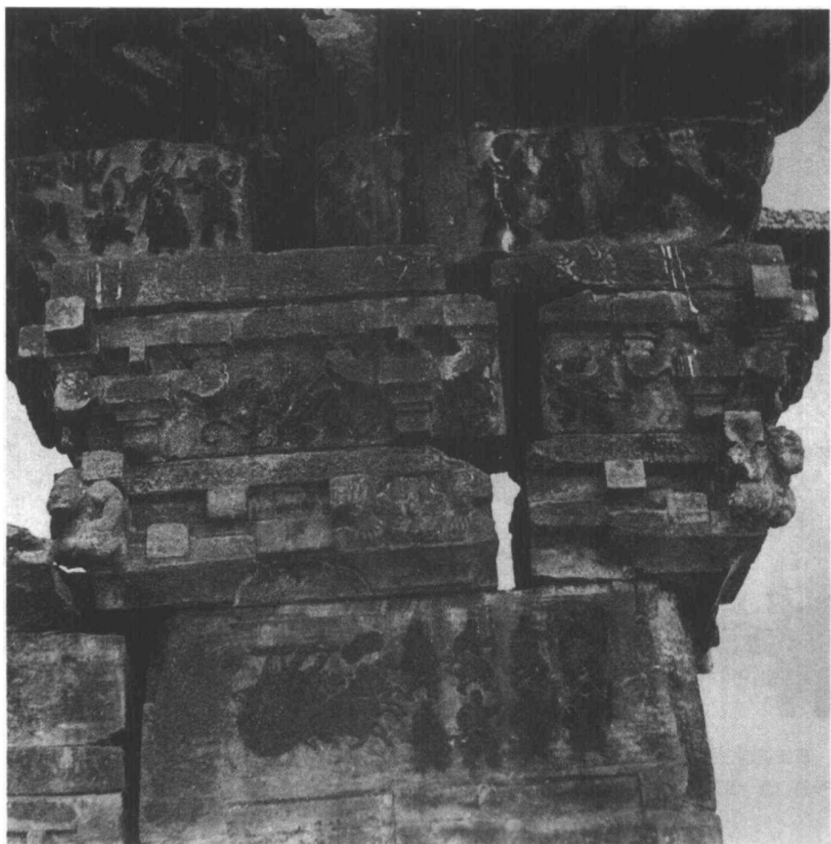
出土墓砖上的浮雕

雅安，古称雅州，自古便是川藏、川滇的交通要道。汉代，雅安在益州之境，属蜀郡。从雅安的汉碑来看，此地曾经出过一位孝廉。只是这位孝廉后来大概也没做过什么显宦，因为查遍《史记》、《汉书》与《后汉书》，均未见有他的名字。不过，从出土墓砖上的浮雕可以看出，此地两千多年前便已颇具气候。