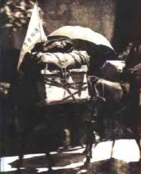
图1-1-1 图1-1-2 图1-1-3 图1-1-4