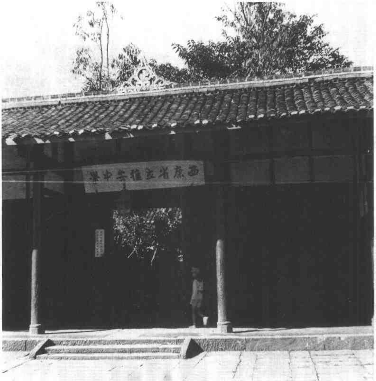
省立雅安中学的大门是中国传统的建筑，而门前的学生却是一副西洋打扮。

刘文辉毕竟是受过教育的武人，虽然退踞边隅，对教育却不马虎。此地的新式教育是教会创办的，但世俗的官办学校却后来居上。当时的雅安中学不仅房舍是全城一流的，而且有着全国最好的师资。