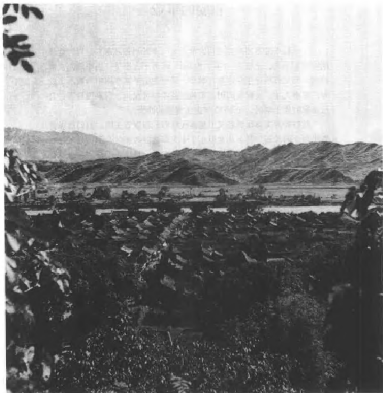
俯瞰雅安城。那时，这座川藏道上的重镇，看上去与内地的城镇并无太大的区别。